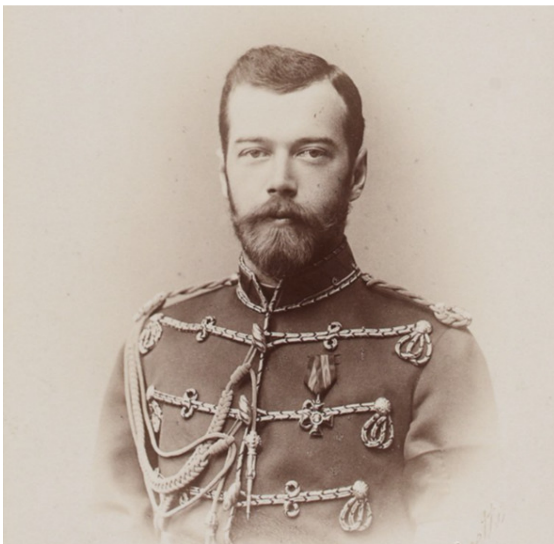
Царь-Мученик Николай Александрович

25.11.2005 (из письма прихожанину, другу семьи)