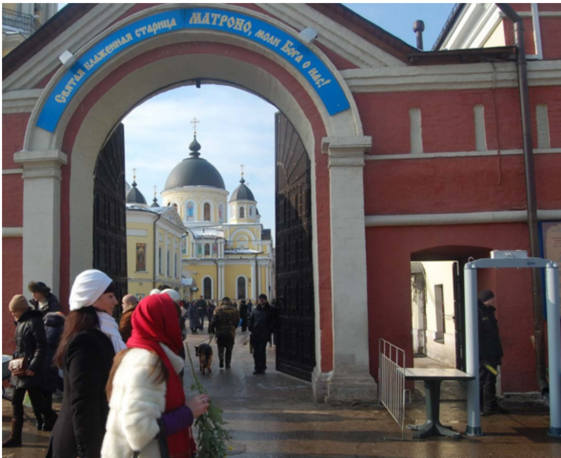
Покровский женский монастырь с мощами святой блаженной Матроны Московской

17.11.2005 (из письма прихожанину, другу семьи)