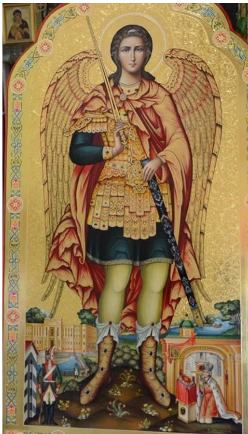
Архангел Михаил с предстоящими ему Царем Николаем I и Царем Павлом I