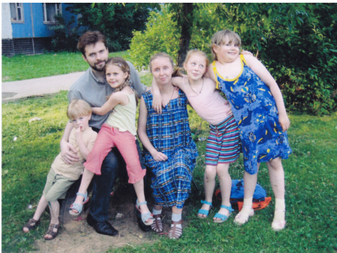
июнь 2006г, на прогулке после командировки в Малоярославец

июль 2006 года (из переписки с прихожанином, другом семьи)