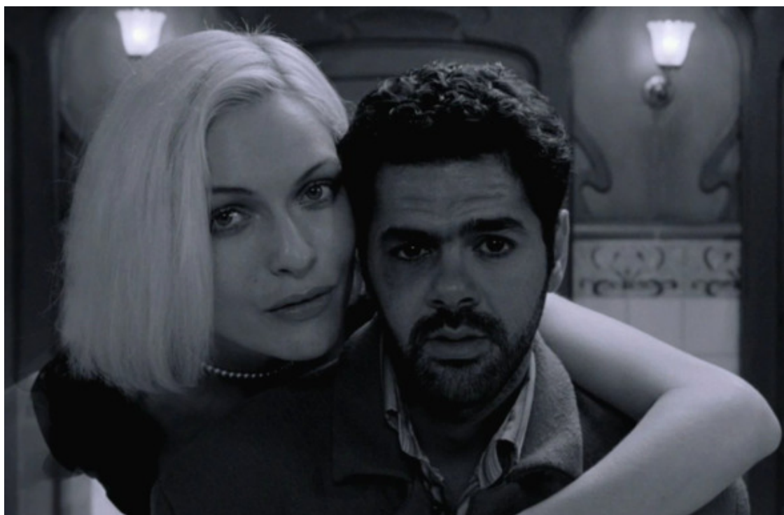
Кадр из фильма «Ангел А» Люка Бессона.

август 2006г (из переписки с прихожанином, другом семьи)