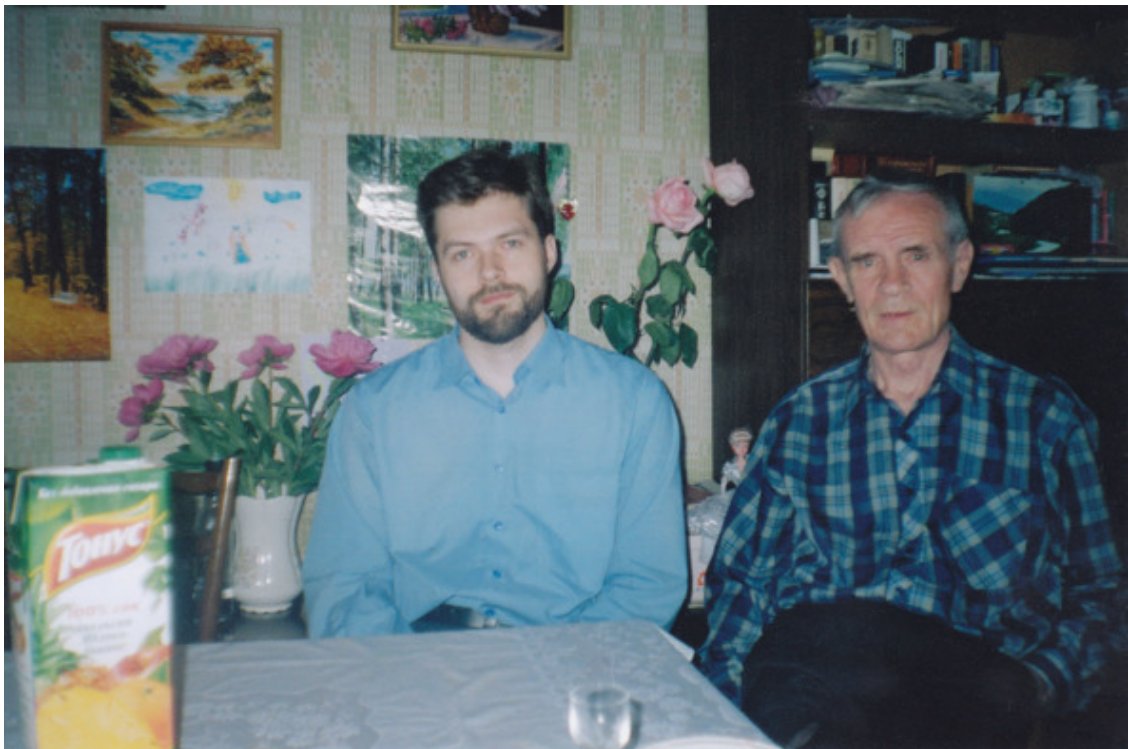
С папой, 2005—6гг.

25.11.2005 (из письма прихожанину, другу семьи)