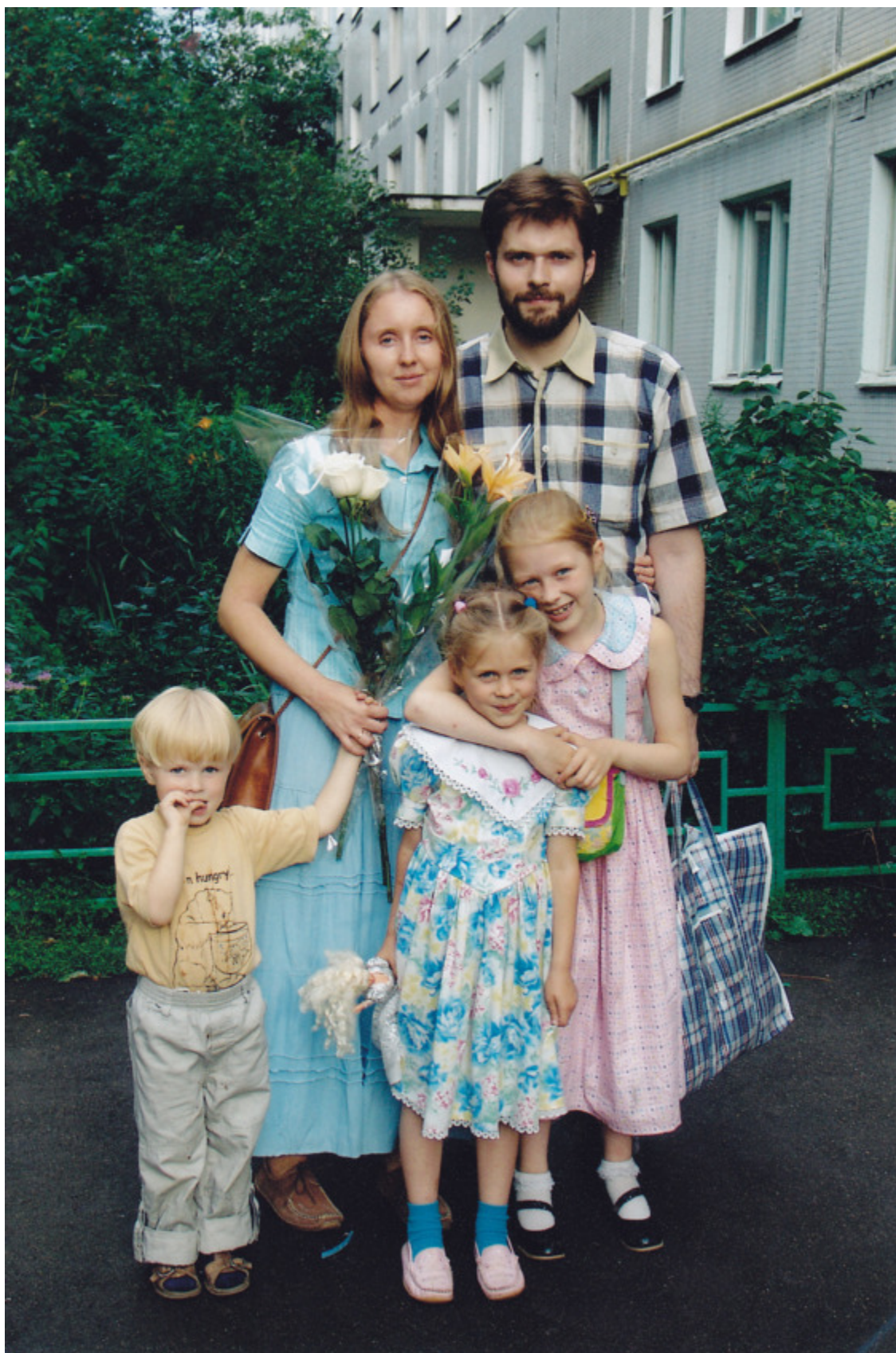
Лето 2005г, с супругой и детьми.