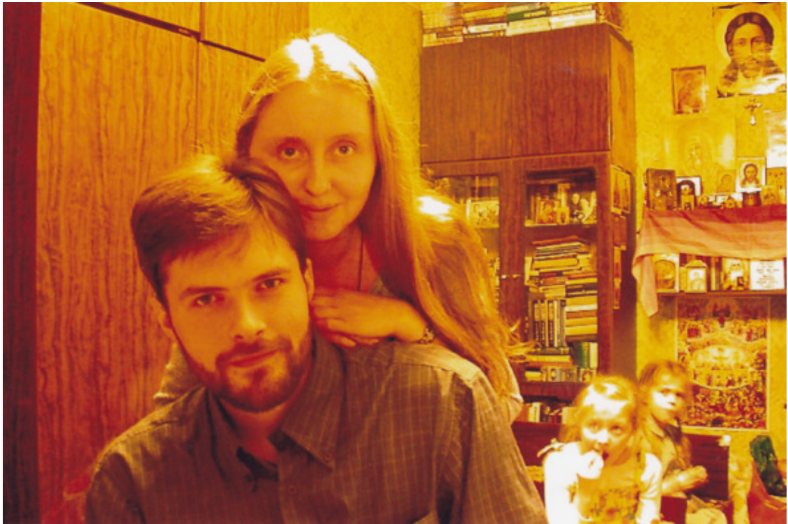
Зима 2004—2005гг, с супругой.

14.11.2005 (из письма прихожанину, другу семьи)