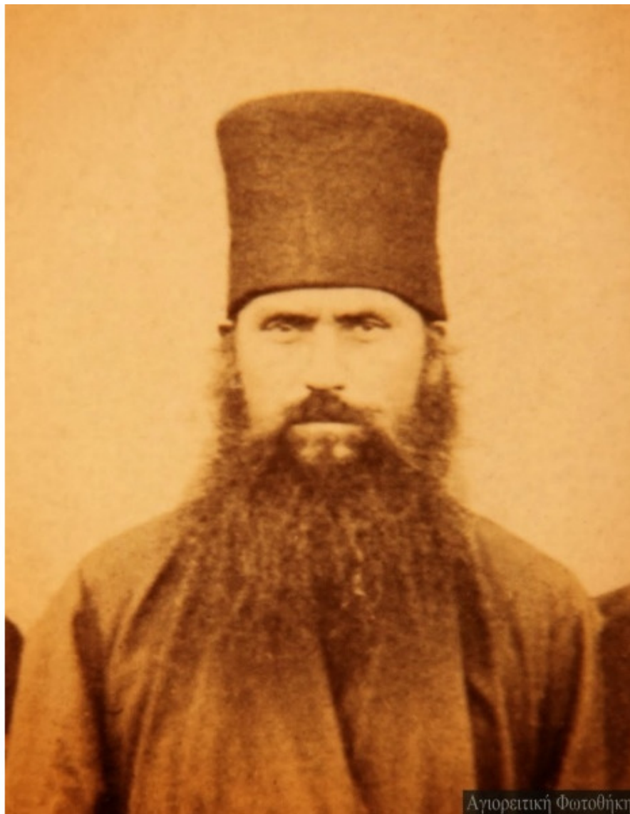
Преподобный Силуан Афонский (25.09.1866—24.09.1938)

11.11.2005 (из письма прихожанину, другу семьи)