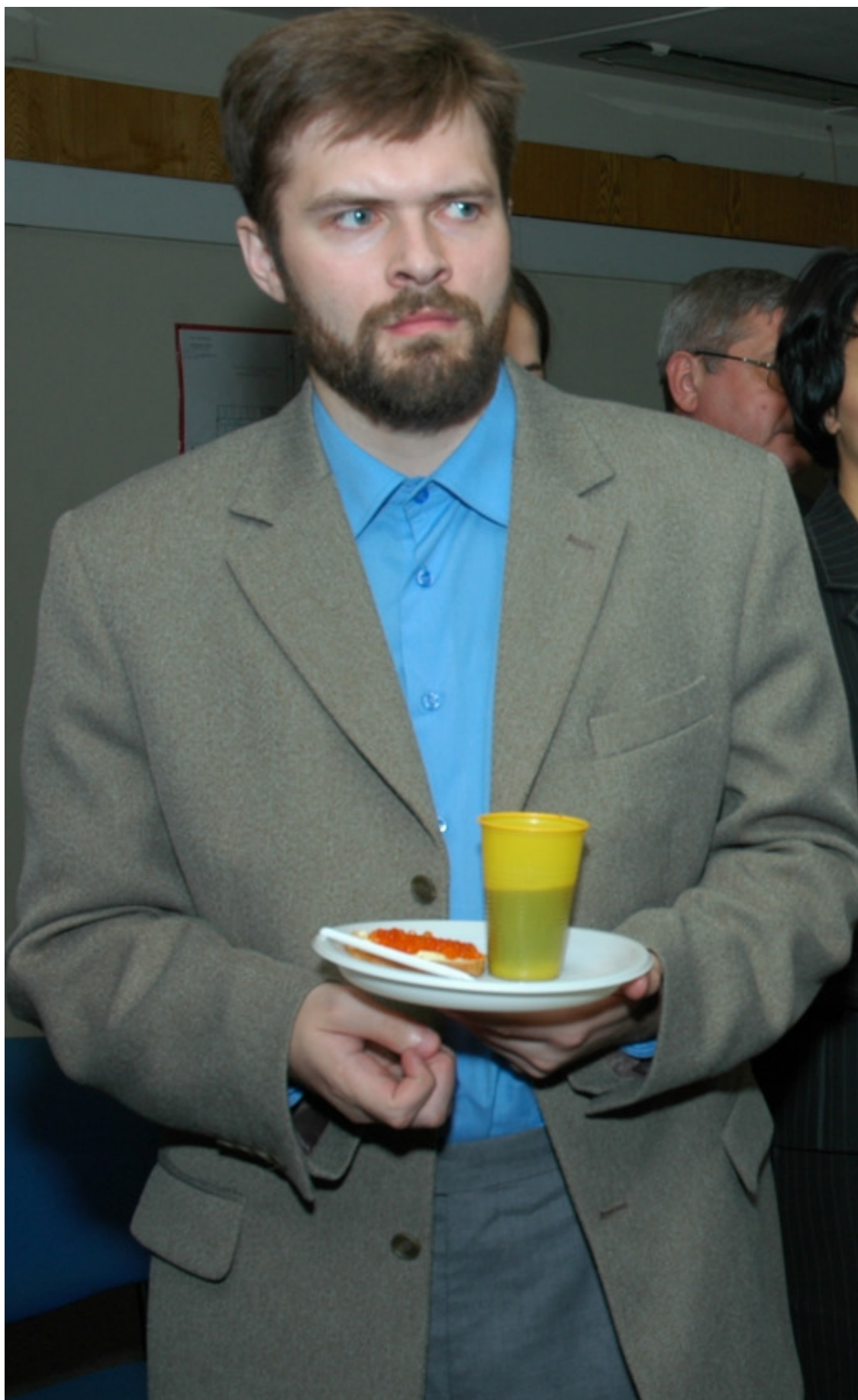
На работе, 2005г, в редакции журнала «Крестьянка».