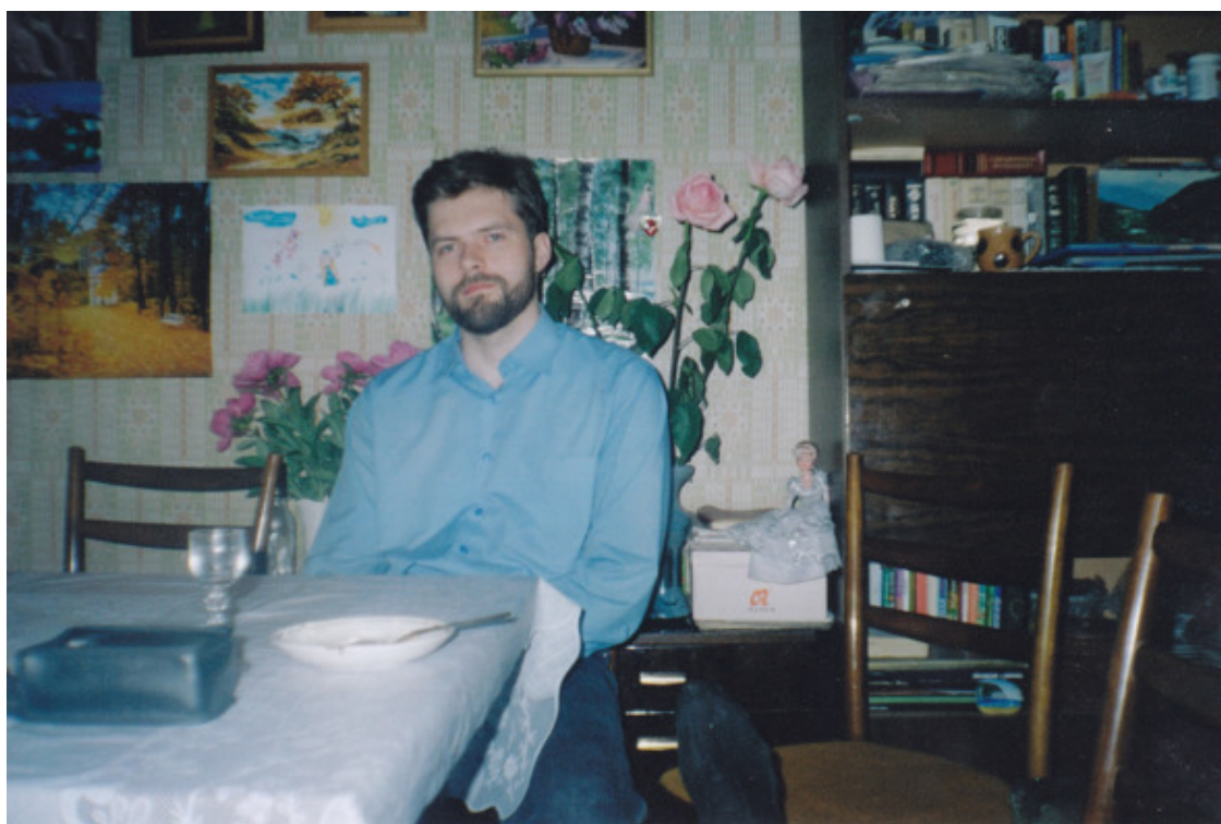
конец 2006-начало 2007гг.

28.11.2005 (из письма прихожанину, другу семьи)