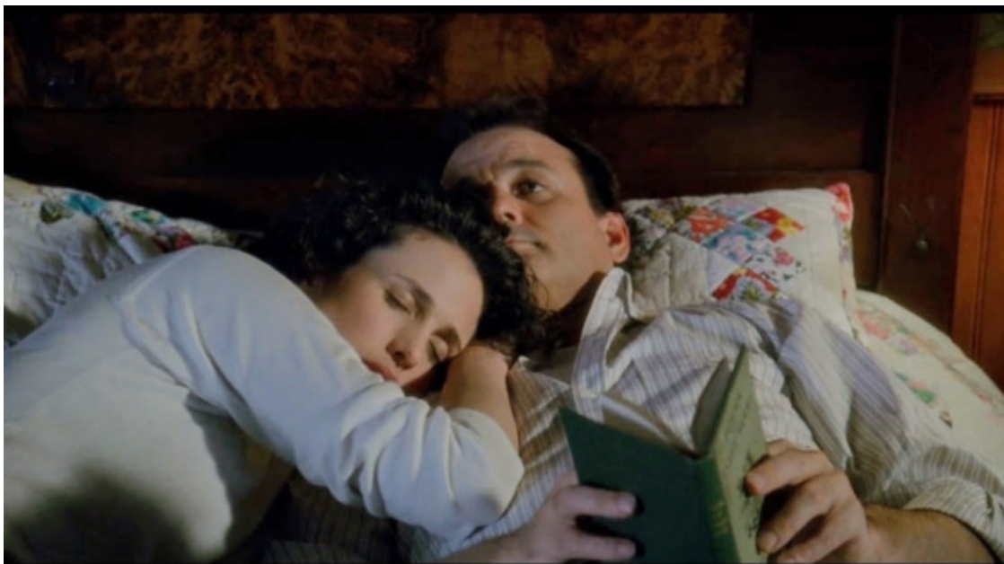
кадр из фильма «День сурка», США, 1993г.

11.11.2005 (из письма прихожанину, другу семьи)