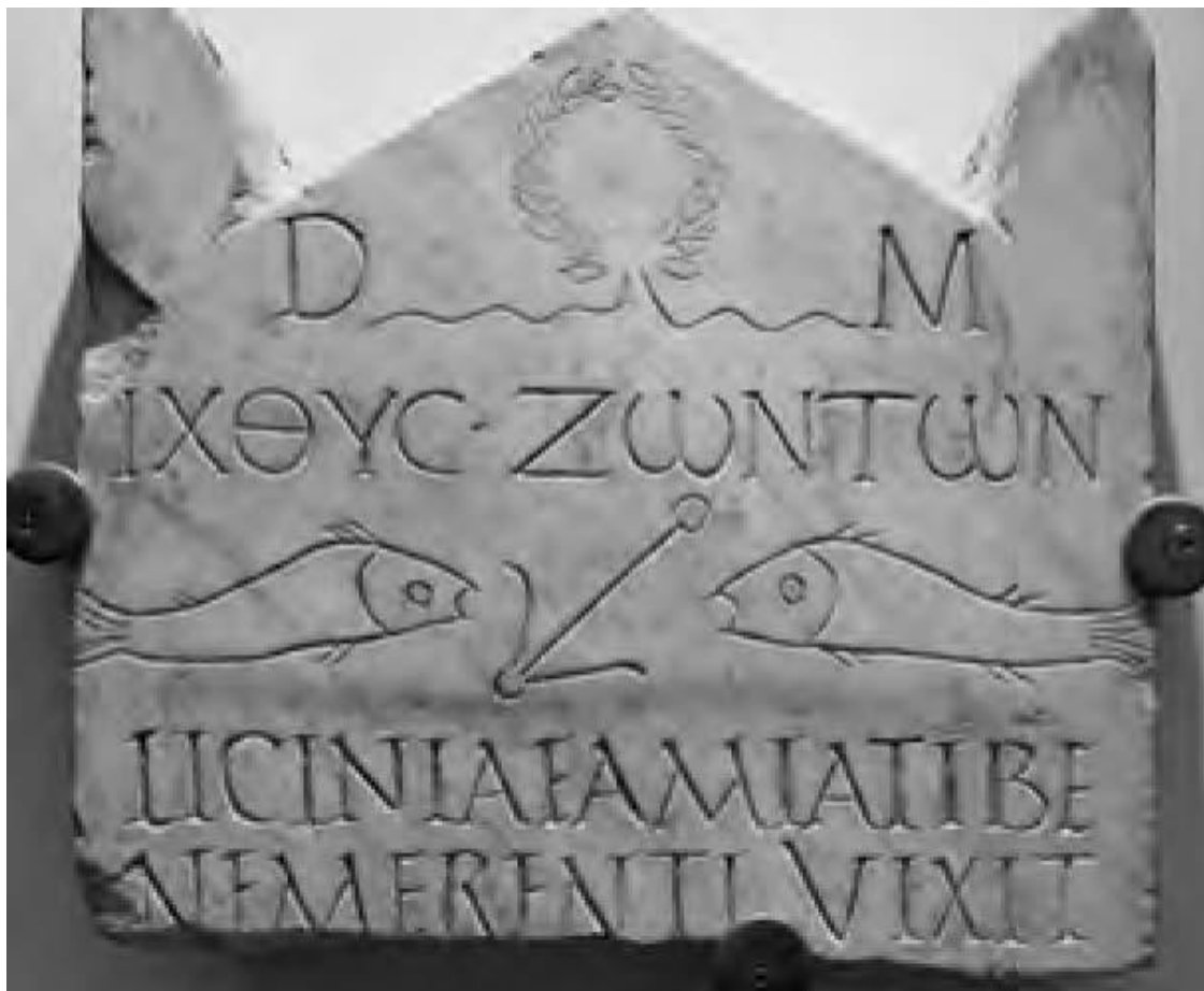
Одно из самых древних символических христианских изображений. Погребальная стела. III в.

Таким образом, мы в рамках Нового Завета видим соединение высочайшей, дерзновенной миссии – проповеди всему миру – и самого простого человеческого послушания, соединение преображающего мир новозаветного откровения и верности Закону. Ветхозаветные правила и новозаветные заповеди, молитва в Иерусалимском храме и Евхаристия – все это соединилось в земной жизни Спасителя и Его учеников.