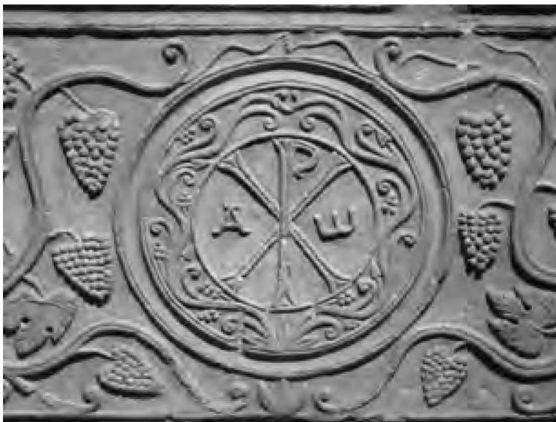
Монограмма имени Христа в окружении виноградных лоз. Саркофаг. VI в.

Христианское богослужение зарождается конечно же уже в апостольской общине: в этом ядре христианской Церкви мы видим зачатки того, что в дальнейшем развернется в богослужении в полной мере. В молитвенной жизни первых христиан уже можно увидеть основные элементы: учительную часть (именно такой характер носили собрания в синагогах, которые посещал Господь со Своими учениками) и, в той мере, в которой она могла присутствовать в рамках Ветхого Завета, сакральную часть (посещение Иерусалимского храма, жертвоприношения в нем; можно вспомнить из Евангелия, как Христос приходил в Храм, сначала, будучи Ребенком, со Своей Матерью и Иосифом, потом – с учениками). Кроме того, оказывается важным принцип послушания через исполнение Закона, свидетельствующий о необходимости обряда, о необходимости порядка . Что значит это послушание в богослужебной жизни? Скажем так: каким бы образованным и начитанным ни был человек, он никогда не должен себя чувствовать вольно по отношению к церковному обряду и богослужебной традиции. Ощущение того, что никто не может в ней распоряжаться, никто не может ее презирать, более всего нам дает Господь наш Иисус Христос. Как Человек, как член избранного народа, Мессия жил по правилам, несмотря на то, что Он был не просто человек, а Богочеловек, не иудей, а Всечеловек, новый Адам. Господь пришел, чтобы Ветхий Завет кончился, но сначала Он выполняет все, что по Ветхому Завету полагается. Творец Закона подчиняется Закону.