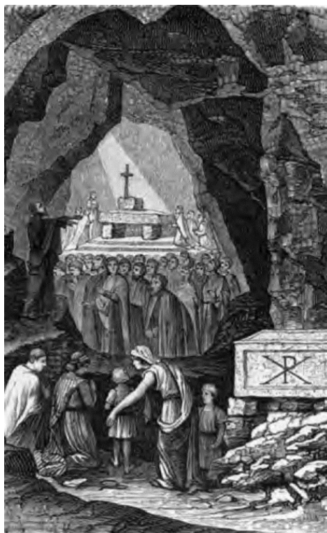
Раннехристианское богослужение в катакомбах святого Каллиста. Гравюра. XIX в.

Принцип послушания определенному порядку присутствует и в апостольской общине: в ней нет неуправляемого потока, несмотря на то что складывание традиций и форм богослужения еще впереди.