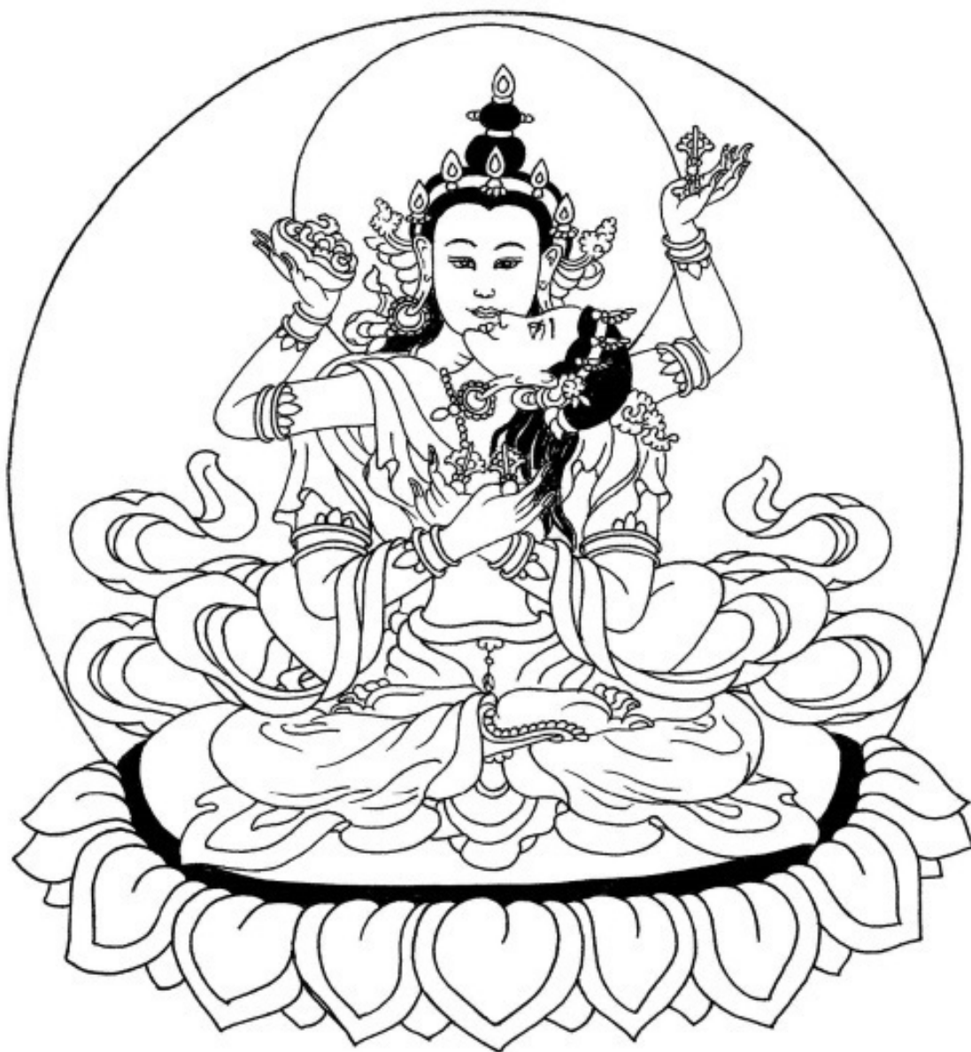
Будда Акшобхья в союзе с Будда-Лочаной

Потенциалом Просветления обладают все существа. К этой совершенной природе не нужно ничего добавлять – Будда советует, наоборот, удалить все мешающее, чтобы покоиться в изначальном состоянии ума.