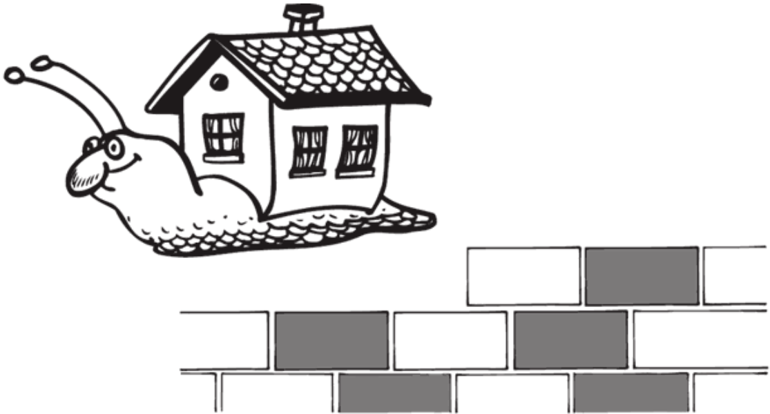
Рисунок домика, где я живу: