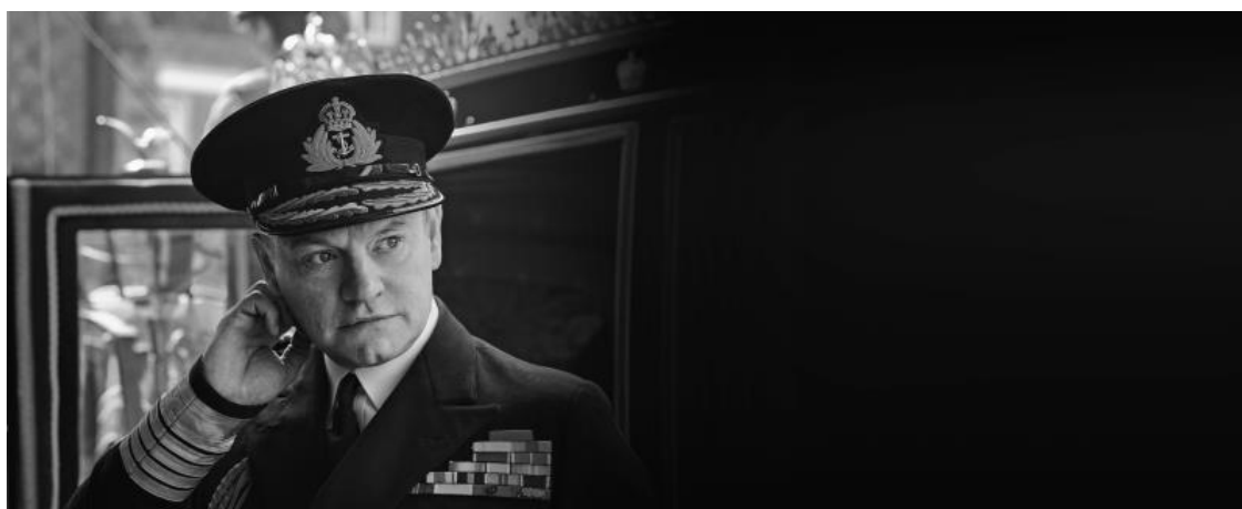
КОРОЛЬ ГЕОРГ VI (1895–1952) В ПЕРВОМ СЕЗОНЕ СЕРИАЛА ЕГО РОЛЬ ИСПОЛНЯЕТ ДЖАРЕД ХАРРИС.

Устроителем этой встречи стал кузен Георга VI лорд Луис Маунтбеттен по прозвищу Дики, который, как и король, в свое время был курсантом колледжа в Дартмуте. Судьба семьи Маунтбеттенов тесно переплелась с судьбой династии Виндзоров еще во времена правления королевы Виктории. Дики, как и Георг VI, был одним из ее правнуков, а его отец Луис-старший перед началом Первой мировой войны стал первым лордом Адмиралтейства. Однако, хотя после 46 лет безупречной службы на Королевском флоте он и занимал высокий пост, по происхождению Луис-старший был немцем.