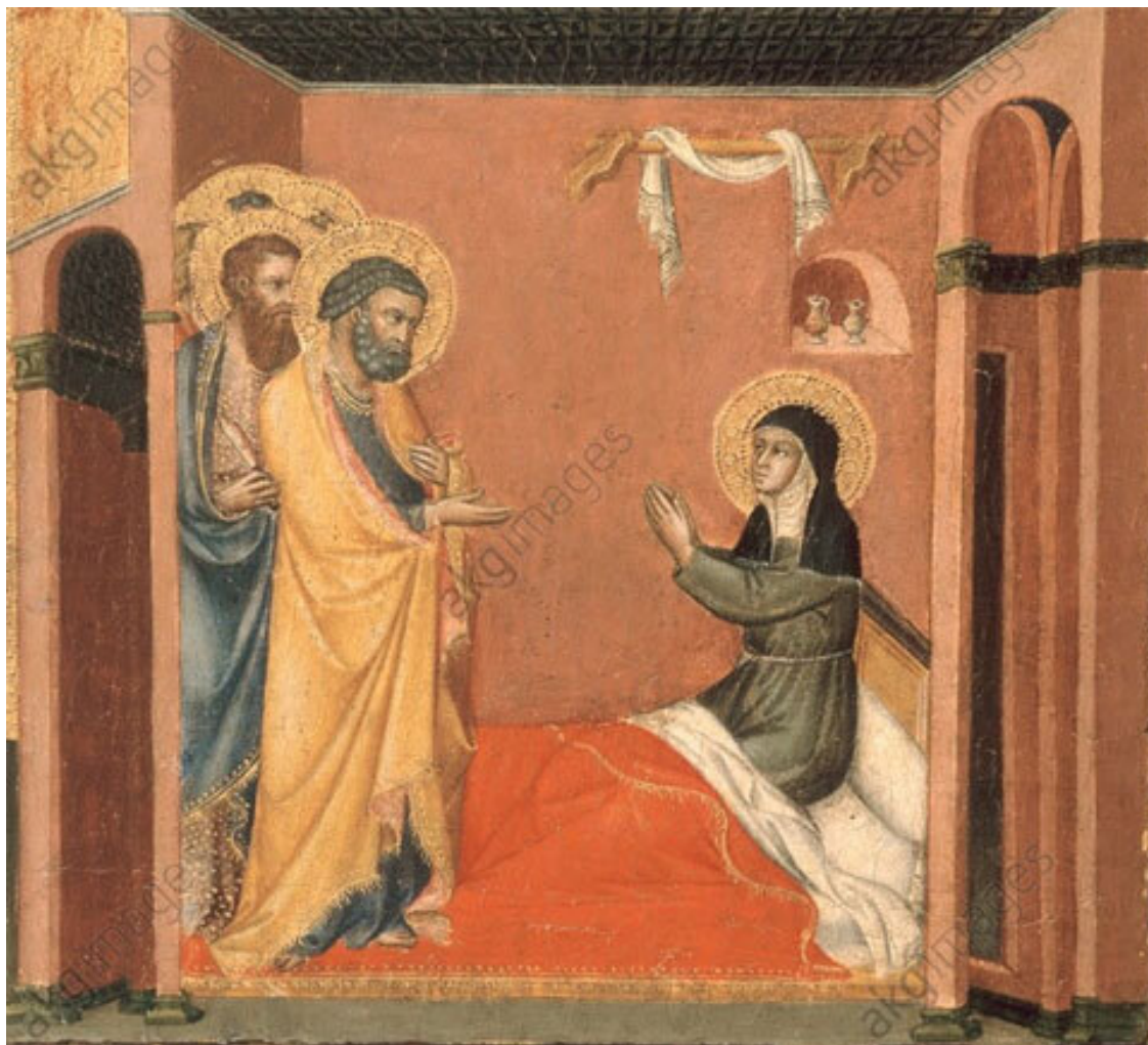
Бартоло ди Фреди. Исцеление св. Петронииллы св. апостолом Петром. Ок. 1380. Фрагмент росписи пределлы собора св. Франциска в Монтальчино

История неудавшегося сватовства Флакка к святой Петронилле имела и продолжение. У нее была сводная или молочная сестра, Феликола. Оставшись без невесты, мужчина решил переключить свое внимание на эту девушку, но она, как и сестра, ему отказала. В наказание убежденную христианку подвергли пыткам, а затем казнили.