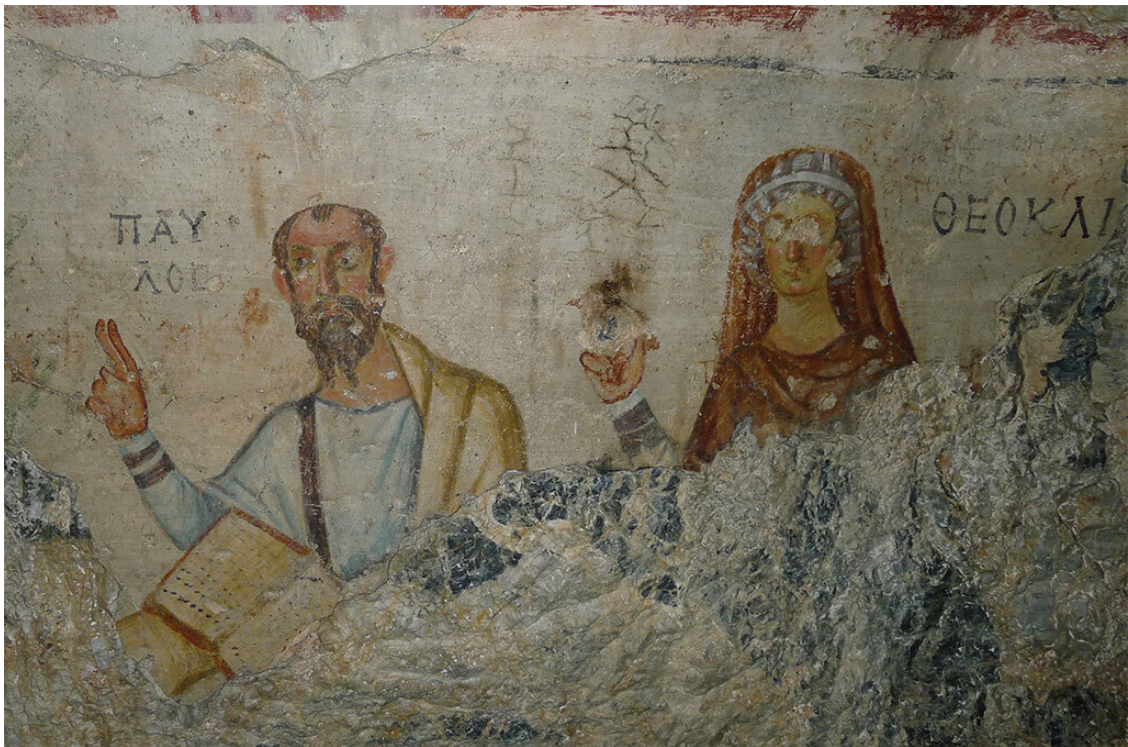
Святой апостол Павел и святая Фекла. Фреска из пещеры св. Павла и св. Феклы в Маалюле, Сирия. VI в.