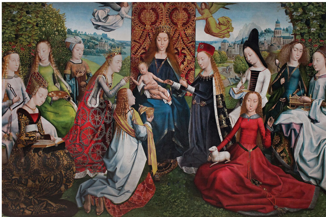
Мастер истории св. Люции. Дева Мария среди святых девственниц. Ок. 1488. Королевский музей изящных искусств, Брюссель

Некоторые святые жены изображаются с длинным развевающимся белым флагом с красным крестом. Он знаменует Воскресение Христова, то есть победу Иисуса Христа над смертью. Считается, что эта форма военного штандарта, которую называют лабарум, была введена императором Константином Великим после того, как накануне битвы у Мульвийского моста он увидел на небе знамение Креста. Флаг Воскресения провозглашает начало битвы против врага рода человеческого – сатаны, его держат в руках те святые, кого считают самыми активными и яростными участниками сражения.