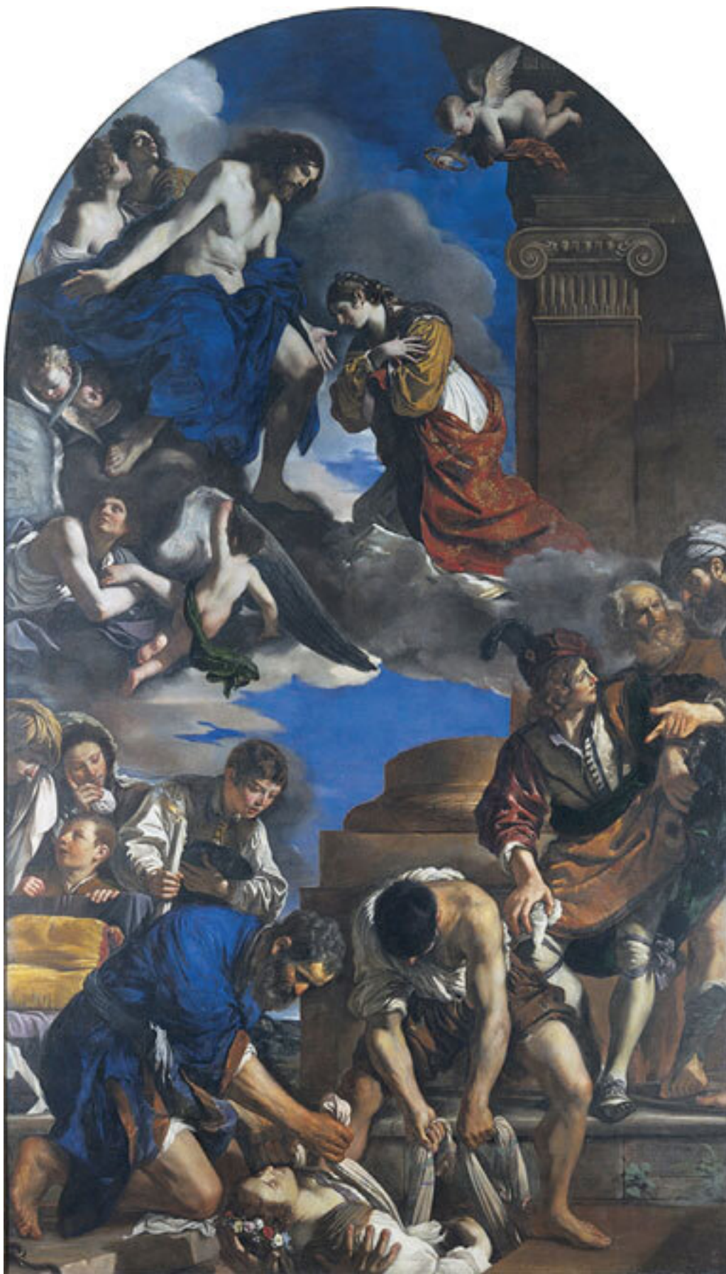
Гверчино. Погребение святой Петрониллы. 1621–1622. Капитолийский музей, Рим