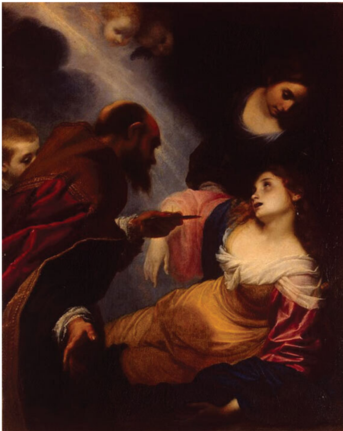
Симоне Пиньони. Мученичество святой Петрониллы. Государственный Эрмитаж, Санкт-Петербург.

Сцену погребения можно увидеть на картине Гверчино 7 . Могильщики опускают брненное тело девушки в подготовленную могилу, рядом стоит святой Петр и назидательным жестом указывает на это Флакку, представленному в виде юноши в наряде дворянина, одетого по моде середины XVI века. Одновременно на небе Петрониллу приветствует Иисус Христос, ее истинный Небесный Жених.