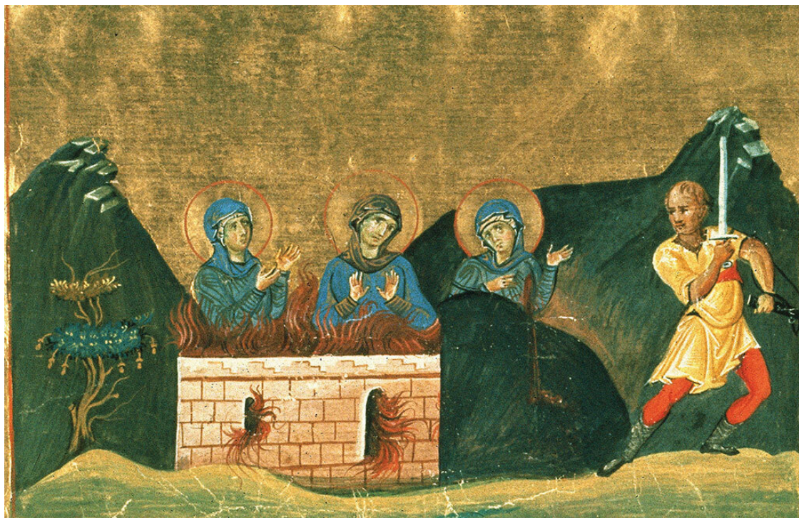
Мученичество святых Агапии, Ирины и Хионии. Миниатюра из Минология Василия II. 979–989 гг. Ватиканская библиотека, Рим

Как и было предсказано, Зинов вскоре скончался, а девушек схватили и отправили к императору Диоклетиану. Формально поводом для ареста послужило то, что в их доме нашли запрещенную книгу – Библию. Император пытался заставить Агапию, Хионию и Ирину отречься от Христа, но тщетно, и тогда приказал перевезти сестер в Македонию и отдал на суд правителю Дульцицию.