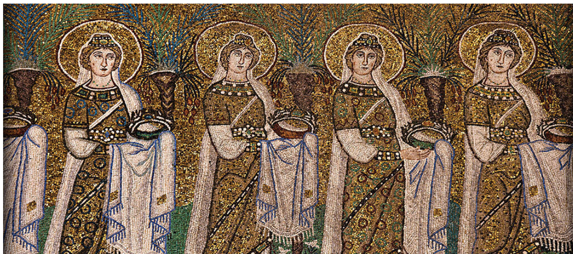
Шествие святых мучениц-девственниц. Фрагмент. Мозаика VI века. Базилика Сант-Аполлинаре-Нуово, Равенна

В Средние века официальная христианская догматика зачастую отказывала женщине в наличии умственных способностей и сомневалась в том, что у нее есть душа. Христианство сделало ее ответственной за грехопадение и, соответственно, соотнесло женскую природу с дьявольской. Только функция деторождения и удовлетворения физиологических потребностей мужчины заставляла средневековых богословов смириться с существованием женщины, но они постарались задать как можно более жесткие рамки ее жизни в христианском мире.