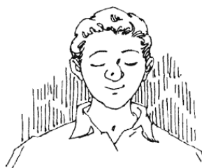
Ментальная стабильность достигается путем отстраненности

Помните: мир – это гигантская школа. Роль вещей и событий заключается в том, чтобы преподать нам урок. Все материальное по сути своей не имеет значения. Мы должны всего лишь использовать предметы и события для обучения и роста, не привязываясь к ним и не сосредоточиваясь на них. Усвоив урок, нужно забыть о предметах и событиях и двигаться дальше. Концентрации и отстраненности нужно учиться одновременно. Об этом постоянно говорил Свами Вивекананда. Умение забывать и отстраняться от прошлого жизненно важно для достижения успеха. Сказано же было: «Хотя иногда имеет смысл помнить, но чаще мудрее будет забыть» 1