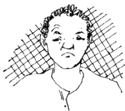
Ментальная напряженность вызвана чрезмерной сосредоточенностью