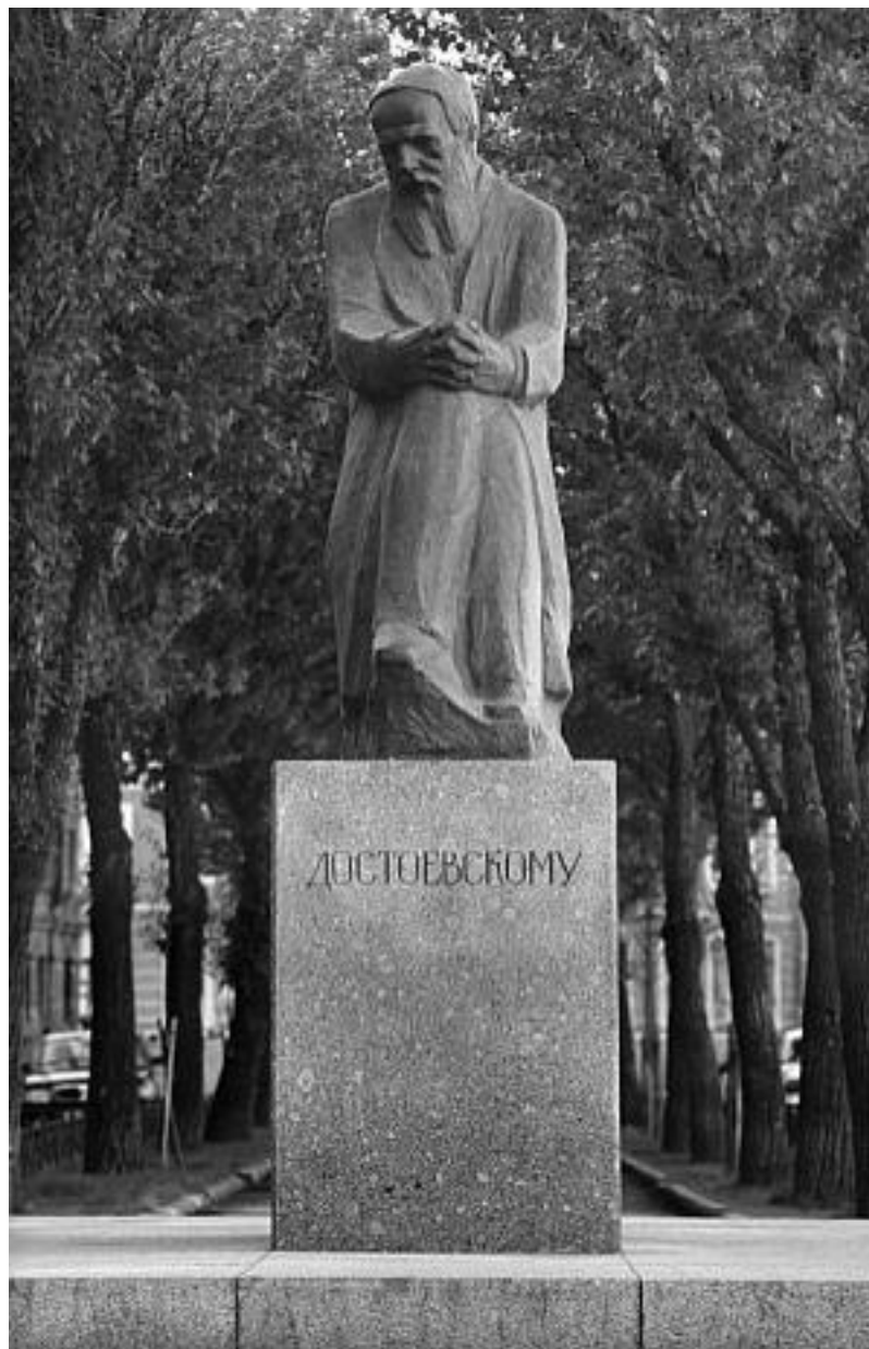
Начало Большой Московской улицы и памятник Ф.М. Достоевскому

Начинающаяся от Владимирской площади памятником Федору Михайловичу Достоевскому Большая Московская улица воспринимается как естественная иллюстрация городской среды, в которой могли развернуться события, описанные в произведениях писателя. Такова ее спокойная архитектура и таковы общественное положение и облик большей части жителей, ее населяющих: обыватели, мелкие чиновники, по большей части пребывающие в отставке.