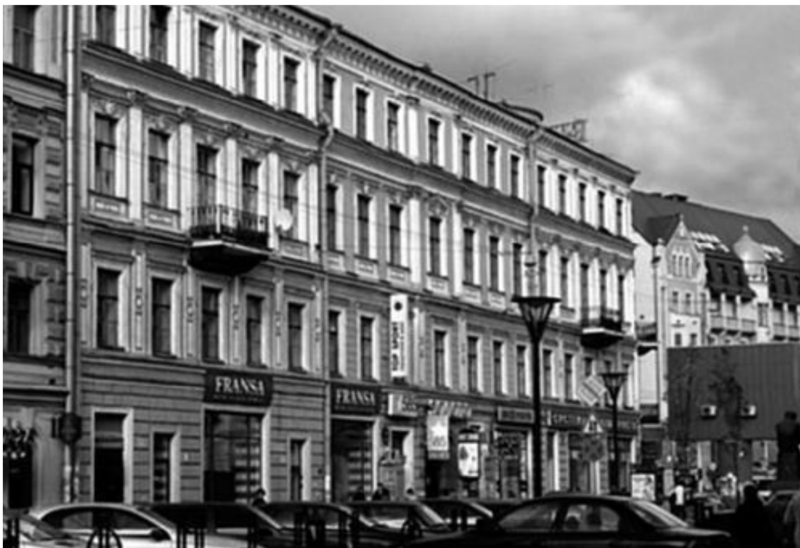
Дом № 1/3

Четвертого декабря 1876 г. на собрании выборных ремесленного сословия было решено для повышения доходности владения взять ссуду в Петербургском городском кредитном обществе, отремонтировать дома и сдать их в аренду.