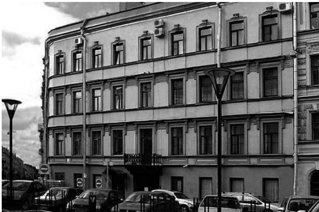
Дом № 5

же флигелями по обеим сторонам двора, два каменных трехэтажных надворных флигеля (в первом этаже одного из них располагалась конюшня на 14 стойл, кухонные и прачечные очаги) и двухэтажные службы по задней границе участка. Бернгард отметил в описи отделку лицевого фасада, «оштукатуренного с тягами», сандрики окон во втором и третьем этажах, «убранный зубчиками карниз». Архитектор особо отметил изготовленные из ясеневоего дерева двери и оконные рамы, заметив, что «древесина ясеня имеет желтовато-белый оттенок и часто идет на изготовление мебели и столярных изделий». Для обогрева помещений устроены различные типы очагов: в большинстве комнат голландские полуторные, английские, в девяти комнатах камин «израсчатые», барский очаг был один. Были устроены мозаичные полы и установлены мраморные подоконников, стены украшены богатой лепниной. Покои владельцев украшала большая медная ванна. Богатая отделка внутри лицевого дома оценена архитектором в 44 тыс., а наружная – в 60 тыс. руб.