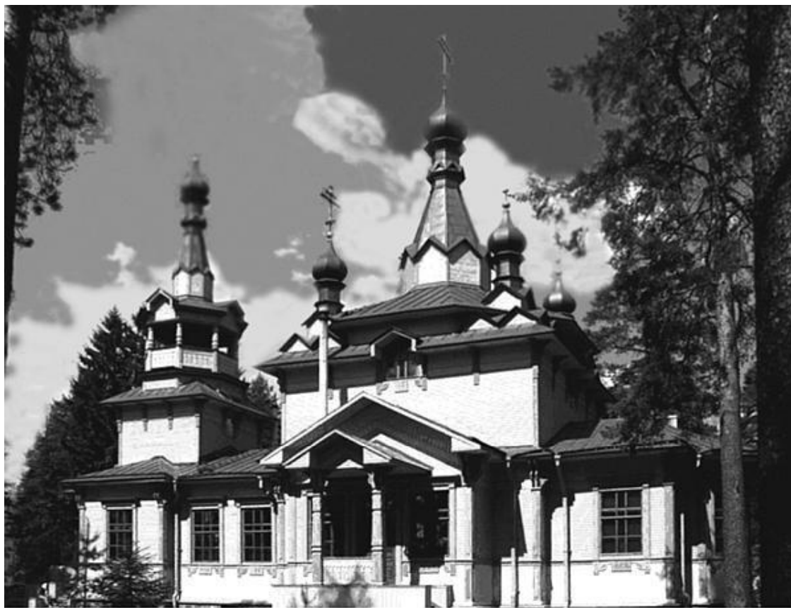
Церковь Преподобного Серафима Саровского. 2006 г.