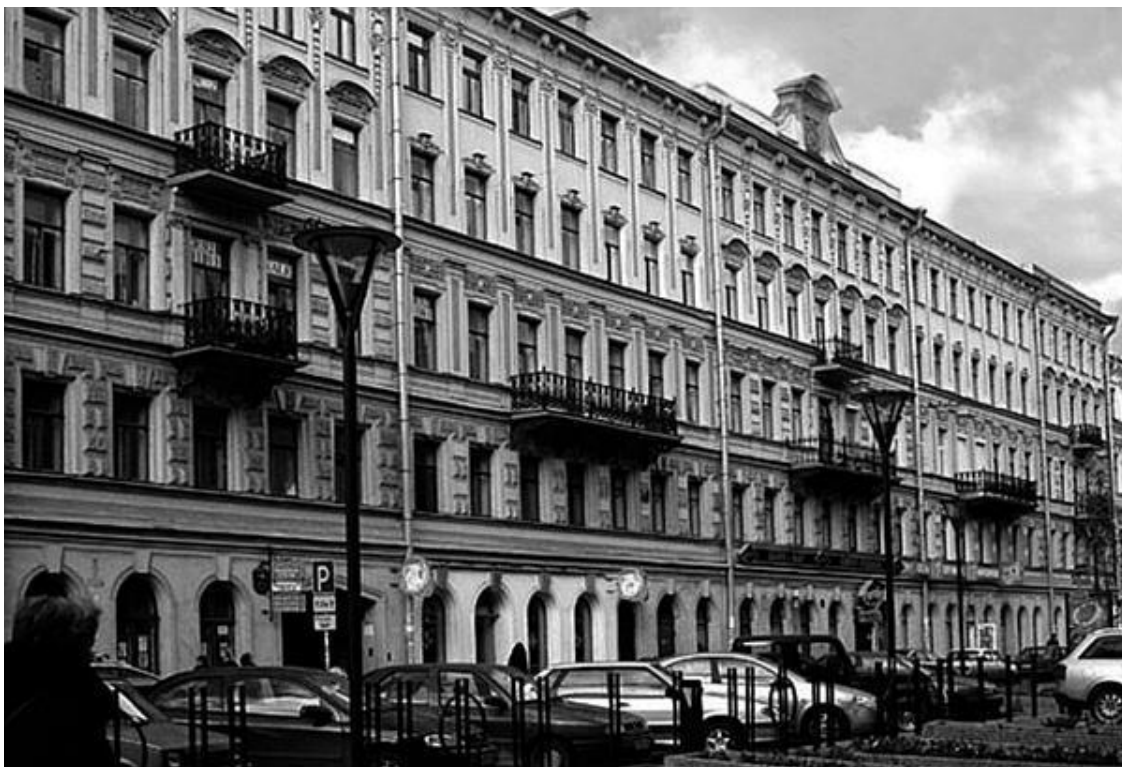
Дом № 3