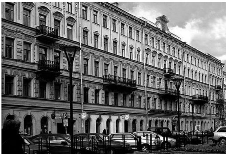
Дом № 3