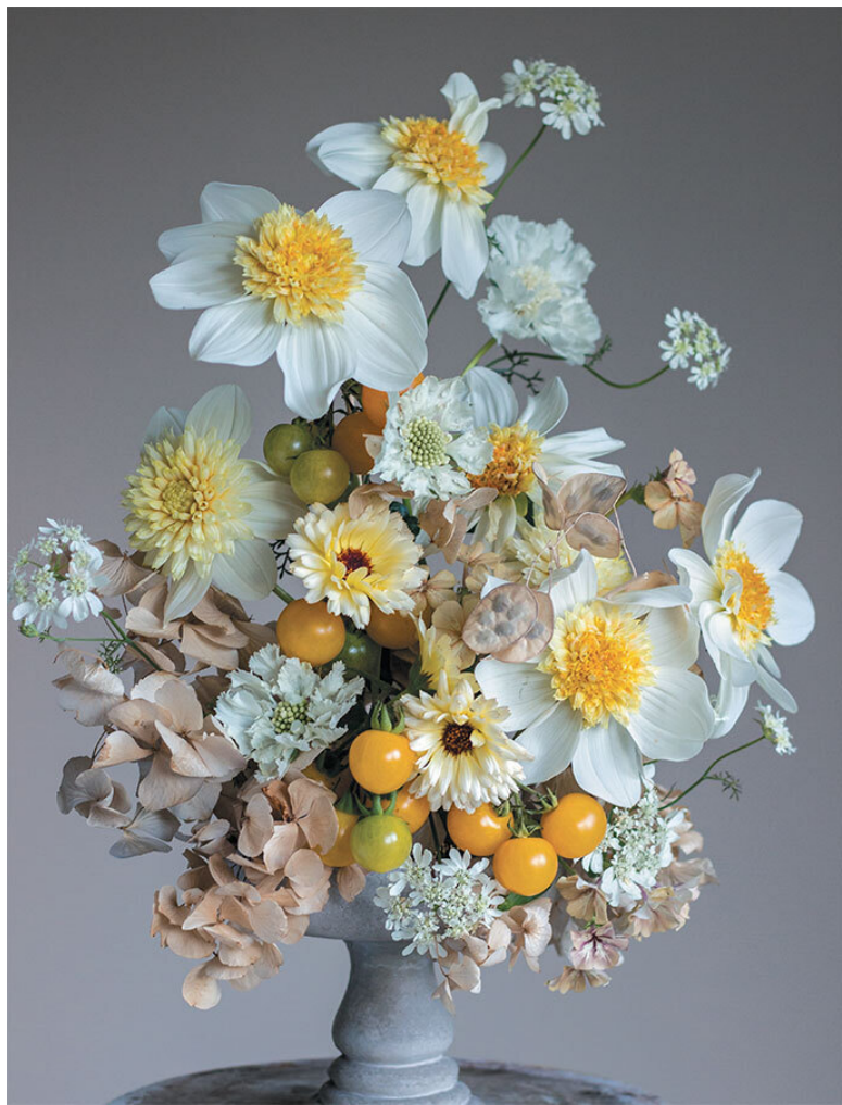
Причудливое сочетание георгинов Platinum Blonde с тома-