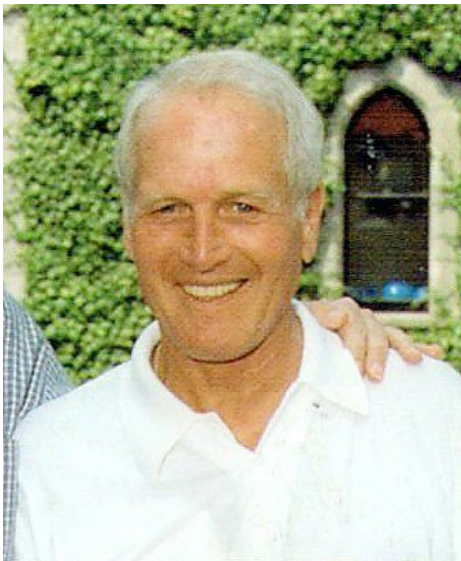
Фото Пола Ньюмана

Все эти годы, начиная с 1997, Барретстаун безвозмездно (даром) приглашал (и приглашает) детей с онкологическими заболеваниями из России и полностью оплачивал дорогу (до 2010 года) и пребывание в лагере в течение 10 дней. Ежегодно в Барретстаун отправляются свыше 40 больных детей и подростков из Москвы, Санкт-Петербурга, Клинцов (городок на границе с Чернобылем), а также сопровождающие их волонтеры и переводчики. Всего за эти годы в Барретстауне побывало свыше 400 детей из России, хотя за все эти годы (до 2010 года) Россия не потратила на их поездки ни копейки! Пребывание ребенка в лагере обходится в 3 500 евро за 10 дней. Деньги на работу лагеря, дорогу и пребывание детей и волонтеров – сопровождающих и переводчиков – собирает по всему миру Международный благотворительный фонд Барретстаун. Многие страны, посылающие своих детей за счет своей страны, также перечисляют благотворительные взносы на счет Международного фонда Барретстаун. Например, Испания, точнее, Испанская Ассоциация родителей, имеющих детей с онкологическими заболеваниями, ежегодно собирает 50 000 евро и, кроме того, оплачивает дорогу почти 100 больным детям и волонтерам-сопровождающим.