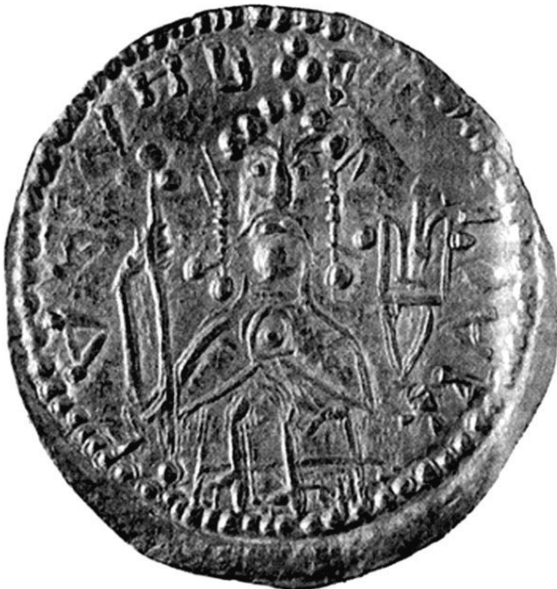
Владимир Старый, прижизненный портрет. (Золотая монета Владимира Святославича. Тип 1)