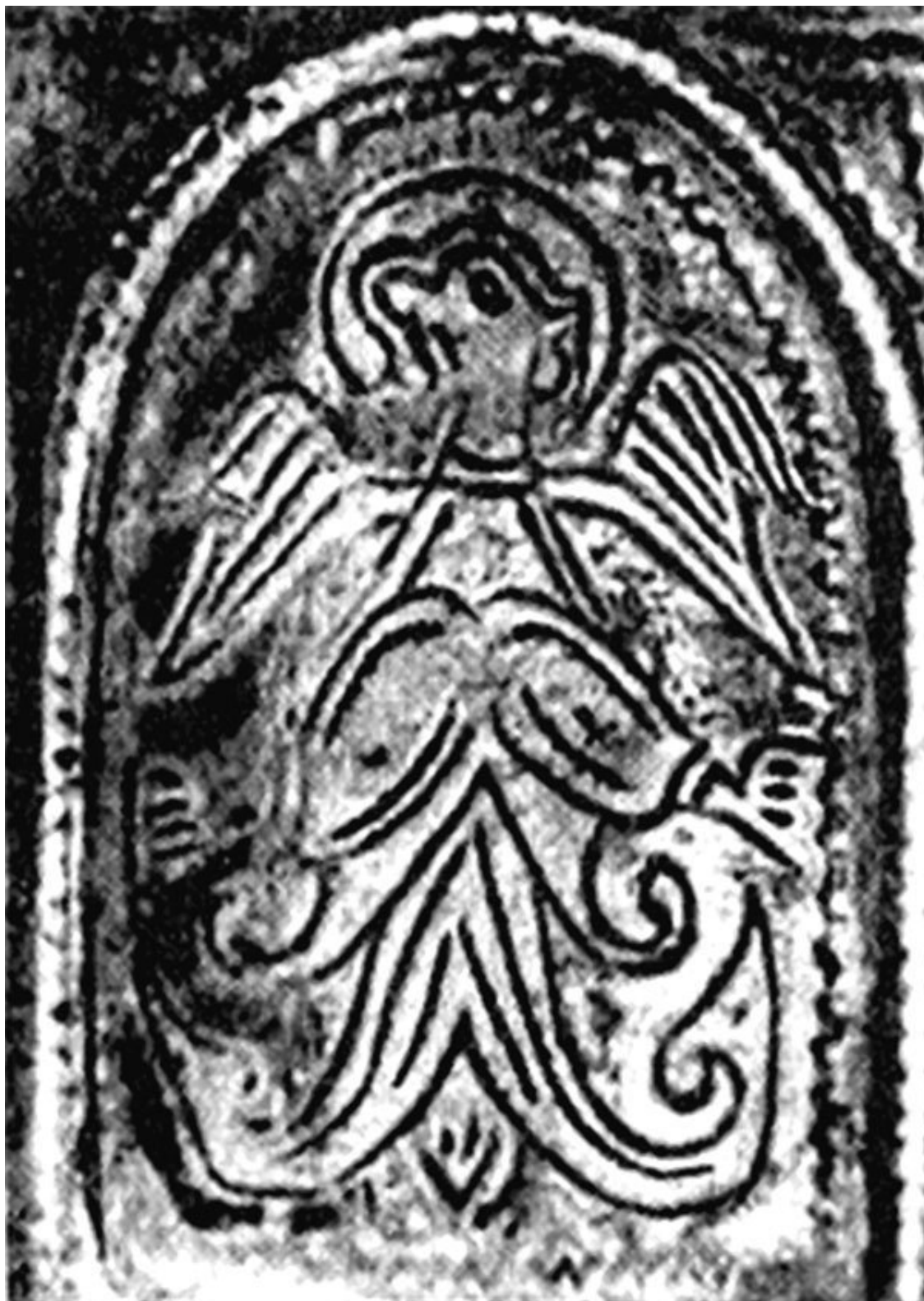
Дева (змееногая богиня Дева). Изображение на серебряном обруче (браслете) из Киева в составе клада 1903 г.