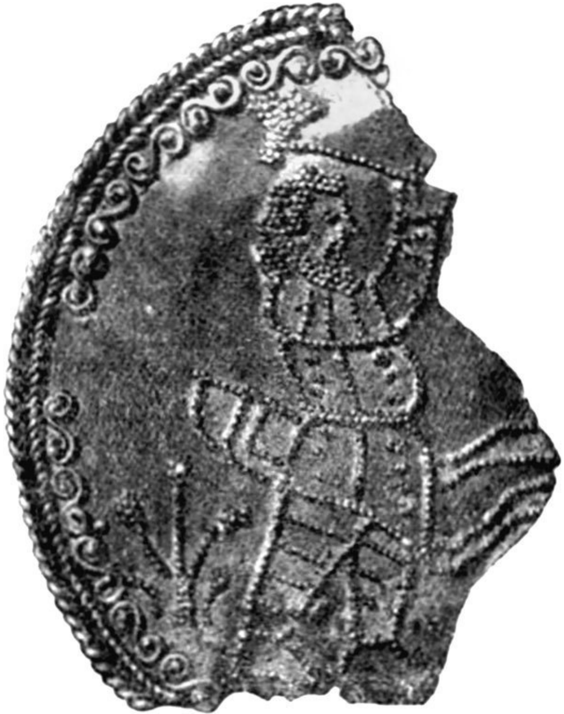
Геракл-Таргитай-Троян. Таргитай, поражающий чудовище топором