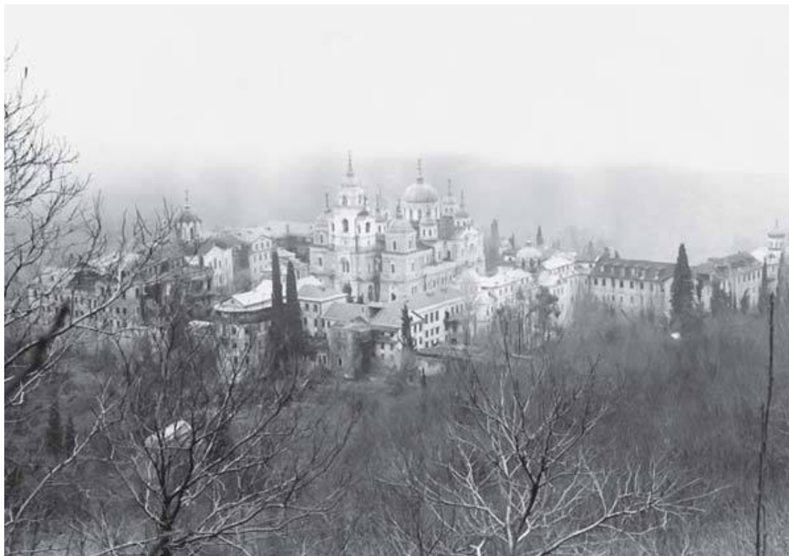
Андреевский скит. 1996

ект автономизации Афона. Учитывая многонациональный и общеправославный характер святогорского иночества, было предложено установить над афонской (по проекту – нейтральной) территорией протекторат шести православных государств: России, Греции, Румынии, Болгарии, Сербии, Черногории. Ведущая роль в подобном протекторате, вне сомнения, принадлежала бы самой России. Идея интернационализации Афона конференцией была одобрена: ее поддержала даже греческая сторона, искавшая в тот момент благорасположения Российской империи.