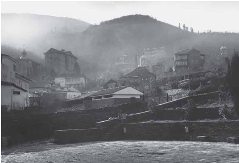
Купола трех русских храмов в окрестностях Карей. 1996

Грандиозность русского Афона являлась результатом искреннего влечения нации к знаменитой святыне, при этом его направленно поддерживало и царское правительство, веками стремившееся к Проливам. Символична встреча в начале 1914 года представителей Андреевского скита с Николаем II, выказавшим, после благочестивой беседы с иноками, интерес к стратегическим характеристикам одной бухты, приобретенной обителью.