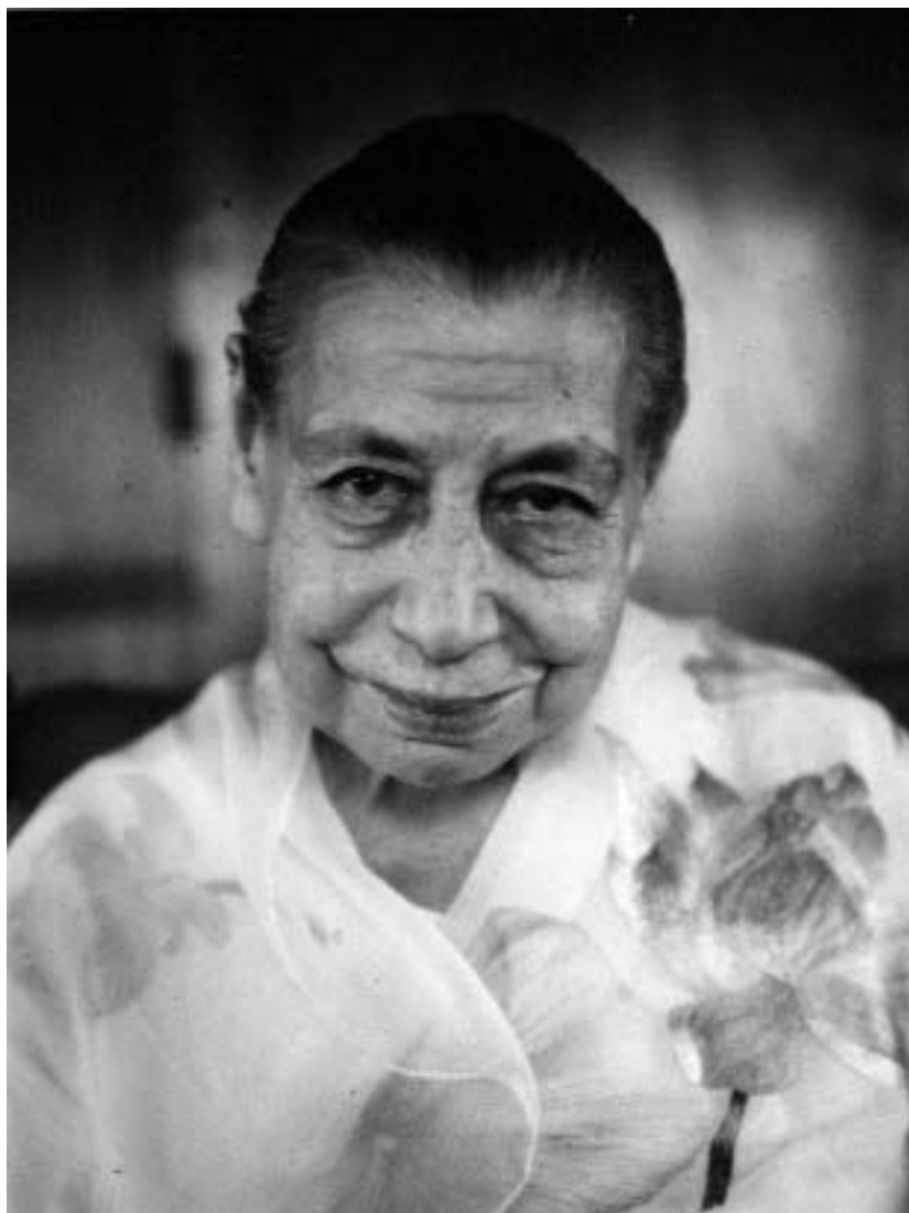
МАТЬ – 1968 г.