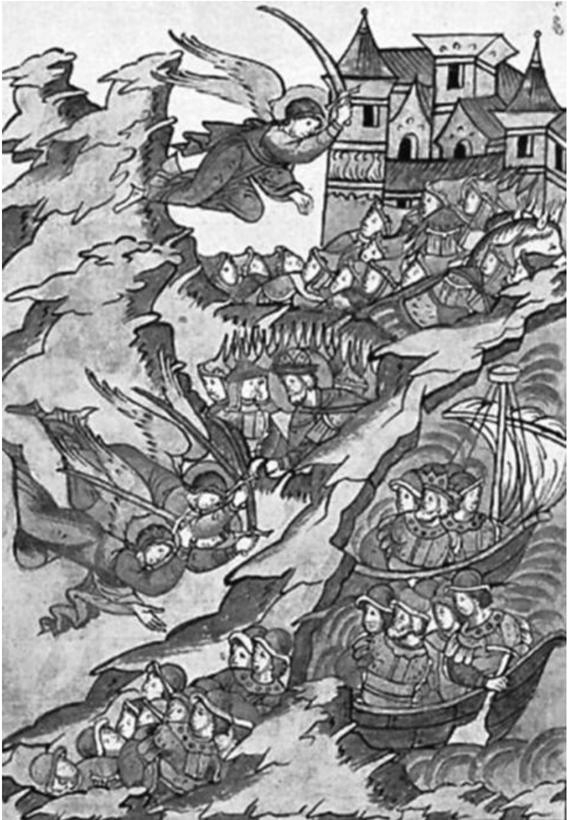
Невская битва. Войско Александра Невского сокрушает шведов. Миниатюра Лицевого Летописного Свода

Эта территория являлась наиболее удобным подступом к морю, а потому здесь никогда не прекращалась борьба русского народа с иноземными захватчиками. В XIII столетии дружина новгородского князя Александра Невского (1220–1263) разгромила шведское войско, которое