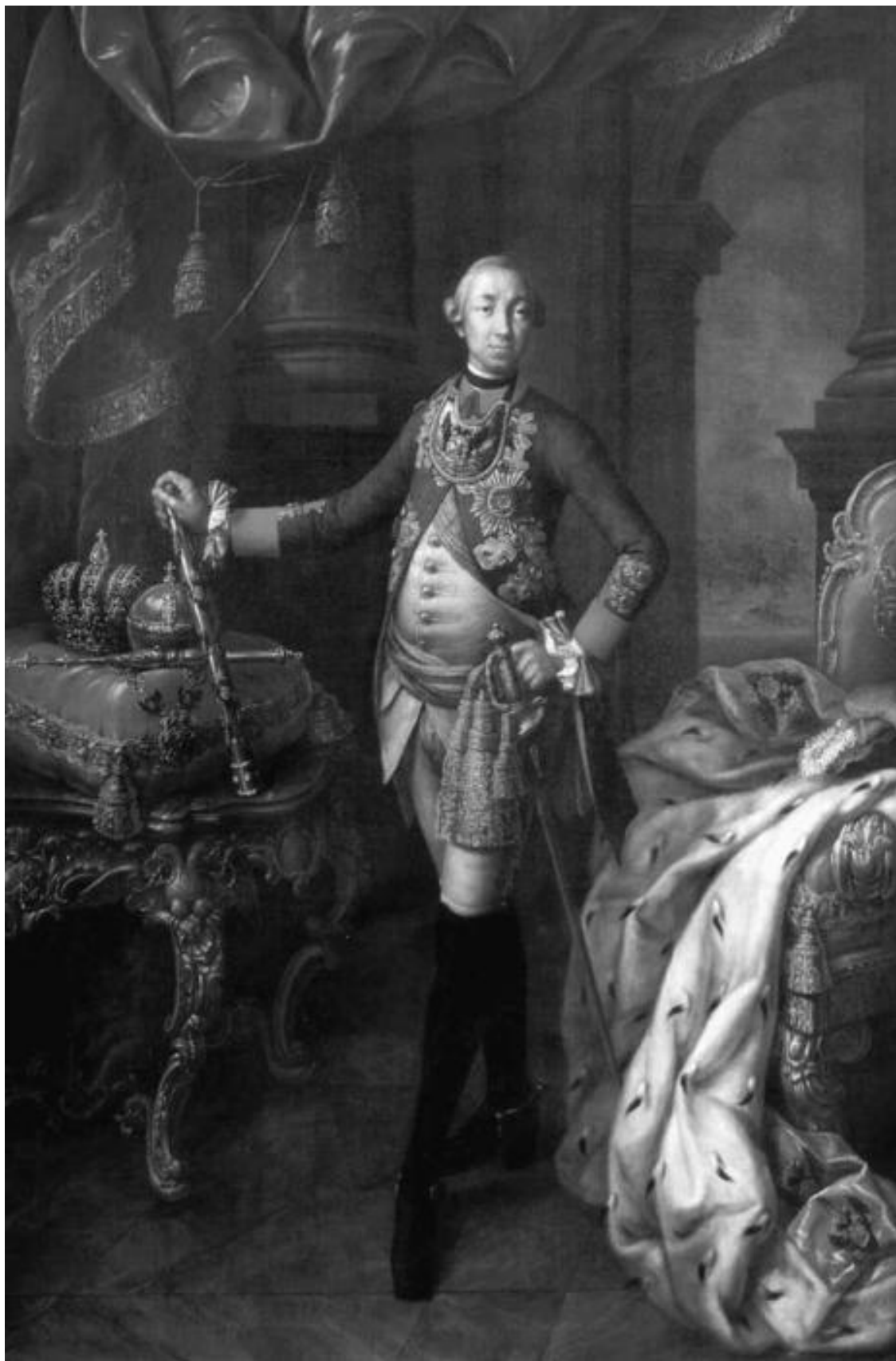
Портрет императора Петра III

При Петре I Фруктовый сад носил название Верхнего сада или Ягодного огорода. Здесь было множество теплиц, где произрастали редкие для северного климата растения: померан-