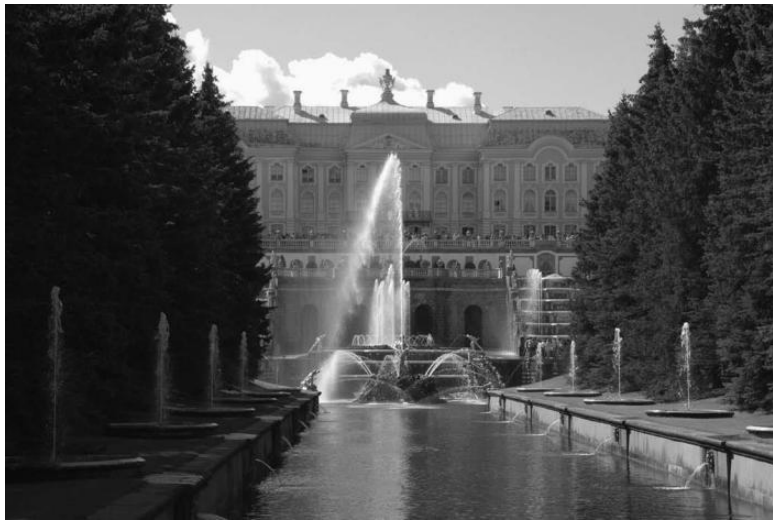
Вид на Большой дворец со стороны Большого канала

В настоящее время резиденция царя с Фруктовым садом располагается между Нижней и Верхней петергофскими дорогами. Ее западная граница проходит вдоль Портового канала, а восточная – вдоль долины Стрелки. Этот дворец состоит из трех частей. Центральную часть завершает треугольный фронто́н, к которому примыкают два флигеля. Изысканный вид всему строению придает шестиколонный портик, поддерживающий балкон.