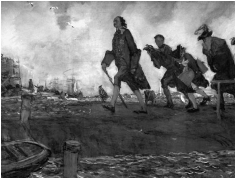
Петр I на строительстве Санкт-Петербурга. Художник В. Серов

Решив устроить в устье Невы новую столицу Российского государства, Петр специальным указом 1710 г. распорядился взять со всех губерний в Петербург «на вечное житье» людей, которые были искусными мастерами; при этом предпочтение отдавалось каменщикам. На пустынных северных берегах развернулось невиданное, поистине грандиозное строительство города.