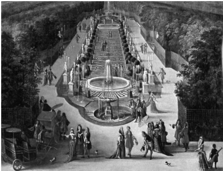
Версаль 1680-х гг.

Итак, русского царя увлекала мысль иметь свой «огород (то есть сад) лучше, чем у французского короля».