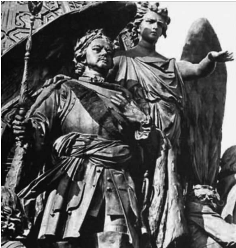
Петр I на памятнике Тысячелетия России в Новгороде. Скульптор М. Микешин