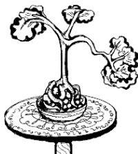
Рис. Классический бонсай на столике с подносом.

Классические композиции – это композиции из растений, которые растут на открытом воздухе, поэтому их чаще нужно выносить на свежий воздух. Чтобы это не было стрессом для растений, даже тогда, когда бонсай находится в помещении, ему нужно обеспечить достаточный доступ свежего воздуха и солнечного света.