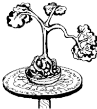
Рис. Классический бонсай на столике с подносом.

Классические композиции – это композиции из растений, которые растут на открытом воздухе, поэтому их чаще нужно выносить на свежий воздух. Чтобы это не было стрессом для растений, даже тогда, когда бонсай находится в помещении, ему нужно обеспечить достаточный доступ свежего воздуха и солнечного света.