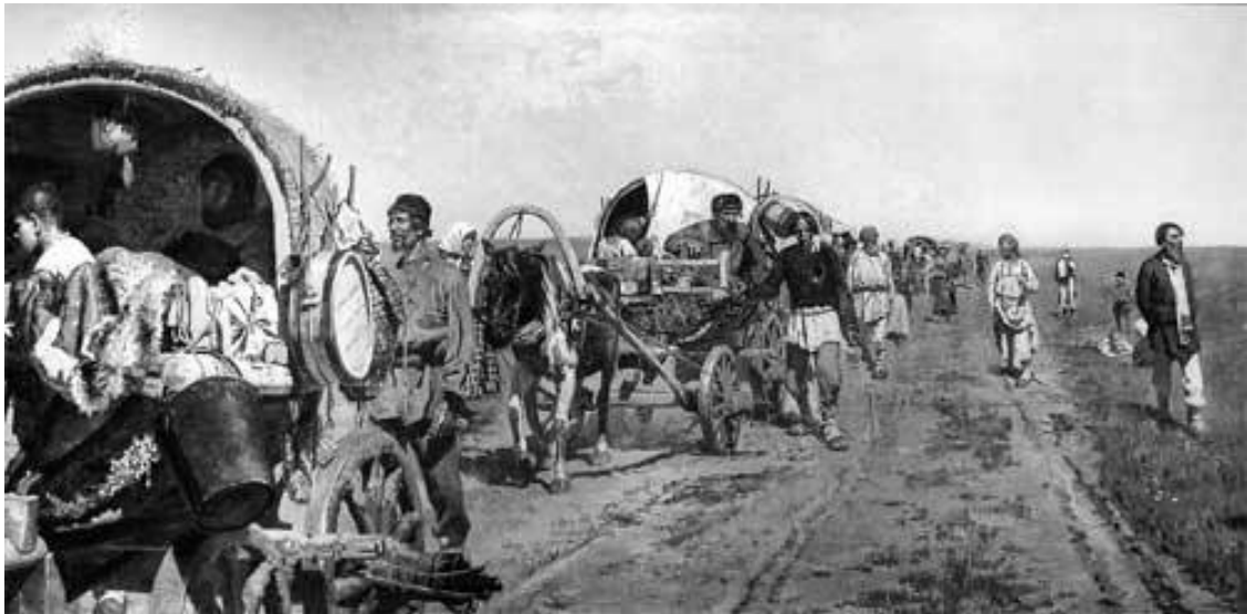
С. В. Иванов. На новые места. 1886 г.

На трактах ручейки переселенцев, выезжавших на большую дорогу из разных мест, сливались в целые караваны из сотни повозок и трех-четыре сотен семей. Вместе путь безопасней, да и есть кому помочь в случае нужды – всем миром легче защититься от дурного человека. Ночевали, как правило, не в гостиницах или на постоялых дворах – на это никаких крестьянских сбережений не хватило бы, – а прямо в поле, под телегой или у костра. Поэтому в путь старались отправиться с первыми теплыми днями – в конце марта, в апреле, чтобы снега и морозы не застали ни в пути, ни бездомными на новом месте, где еще надо было успеть обзавестись хоть каким-то жильем.