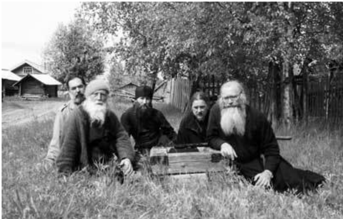
Батюшка вместе со своими духовными чадами рядом с колодецем Ефима Ивановича в Залесье

эмиры и степняки, буйные черкесы, крымские и сибирские татары, заключен мир с цинским императорским Китаем, путь русскому человеку на Восток был открыт. Перед переселенцами лежали десять миллионов квадратных километров земли, ждавшей первопроходца и хозяина. Поэтому в конце XIX – начале XX века счет русским переселенцам шел уже тоже не на тысячи, а на миллионы.