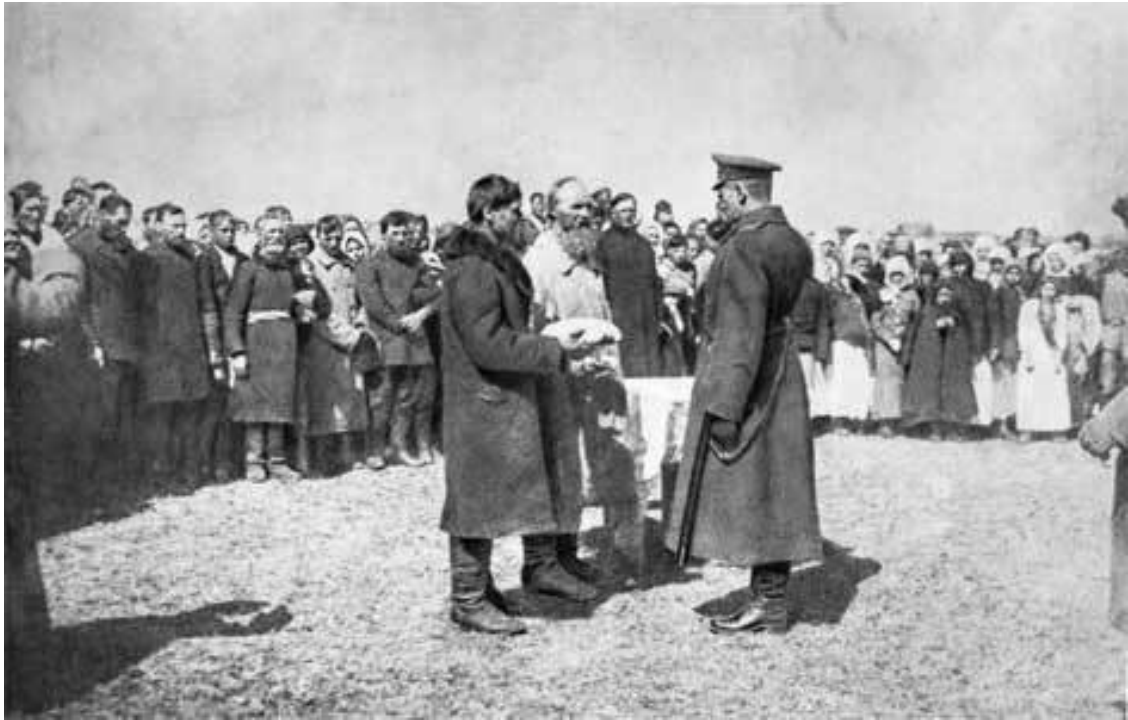
Встреча А. В. Колчака с крестьянами. 1919 г.

На попытки неповиновения, а тем более пропаганды большевистских идей Колчак ответил «белым террором», жестоко подавляя мятежи и возмущения руками белочехов и казаков и применяя к непокорным расстрельные приговоры на месте, без суда и следствия. Как средство воздействия на население широко применялись порки плетью или шомполами. Так, в Екатеринбургской губернии с двухмиллионным населением был выпорот каждый десятый житель, включая женщин и детей.