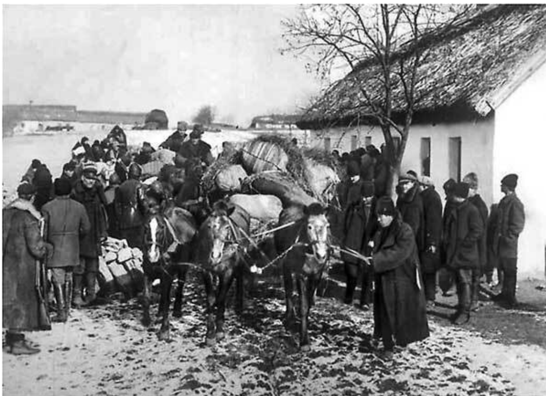
Выселение кулака из родного села

Сколько этих ограбленных людей, лишенных запаса продуктов, фуража для лошадей, сельхозинвентаря и даже теплых вещей, в результате смогли выжить в суровых условиях севера Томской области или Нарыма, куда их отправляли под конвоем, сейчас трудно предположить. Наступивший повсеместно под видом «классовой борьбы» уголовный беспредел лучше всего выразил один из сибирских советских работников, напутствуя активистов перед раскулачиванием словами: «Все законы аннулированы!» 16