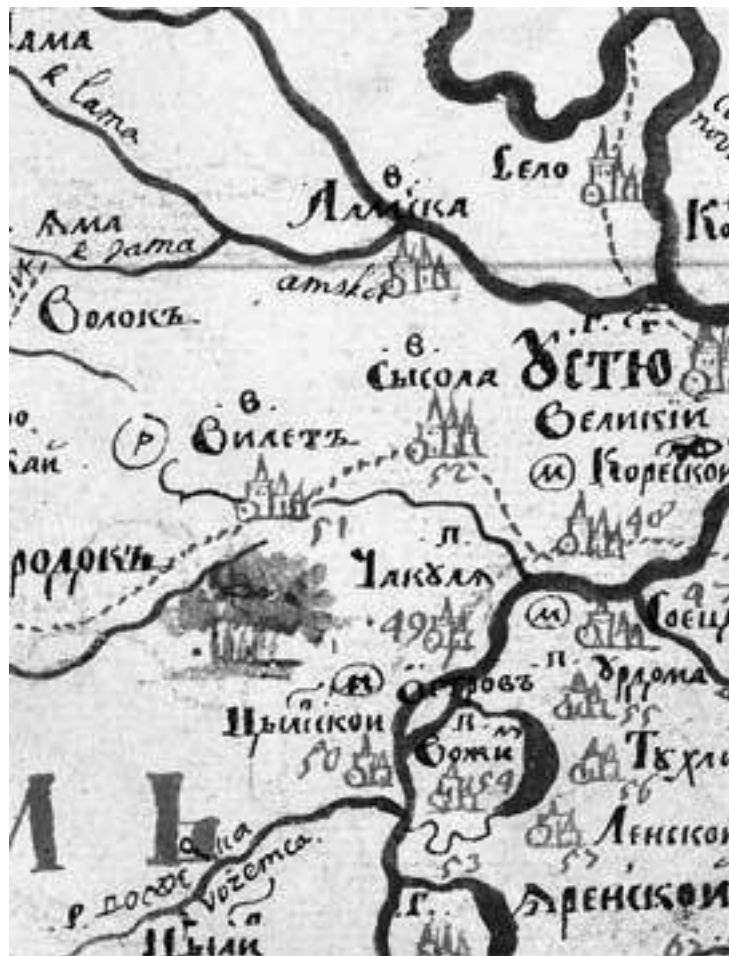
Вилеготская волость на карте Перми Великой. Фрагмент карты из «Чертежной книги Сибири», составленной тобольским сыном боярским Семеном Ремезовым. 1701 г.