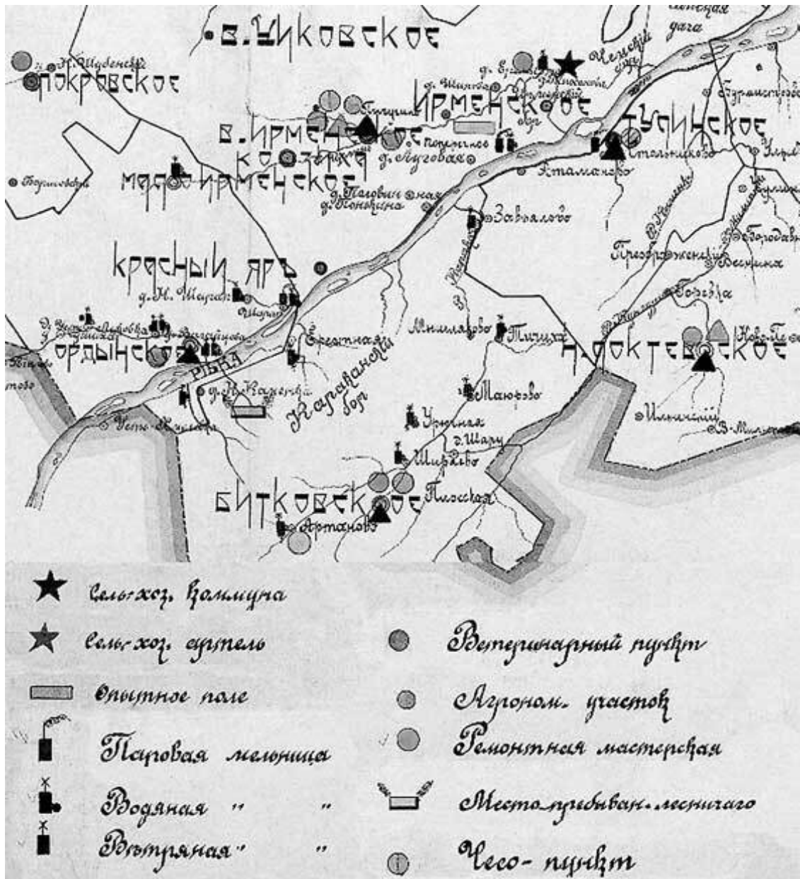
Окрестности Шубинки (Мало-Ирменки) – родные места о. Наума. Карта 1920 г.

Но даже если у переселенца находились необходимые для обустройства деньги, это еще не означало его прав на общие блага. Прежде чем стать полноправным членом деревенского общества, он должен был получить «приписку» на общем сельском сходе, выносившем о ново-прибывшем свой «приемный приговор». Лишь при таком условии новый житель села допускался до «мира» – делался частью сельского общества. А без этого он не мог получить своей доли при разделе необходимых жизненных ресурсов, который проводился на общем собрании всех жителей. На нем распределялись среди семей и дворов пахотные земли, покосы, лес для строительства, рыбные ловли – словом, все, без чего человек не мог жить на земле сам. Не принятый в общество не имел в нем и права голоса. Все, на что он мог рассчитывать, – это всю жизнь перебиваться работой «в чужих людях».