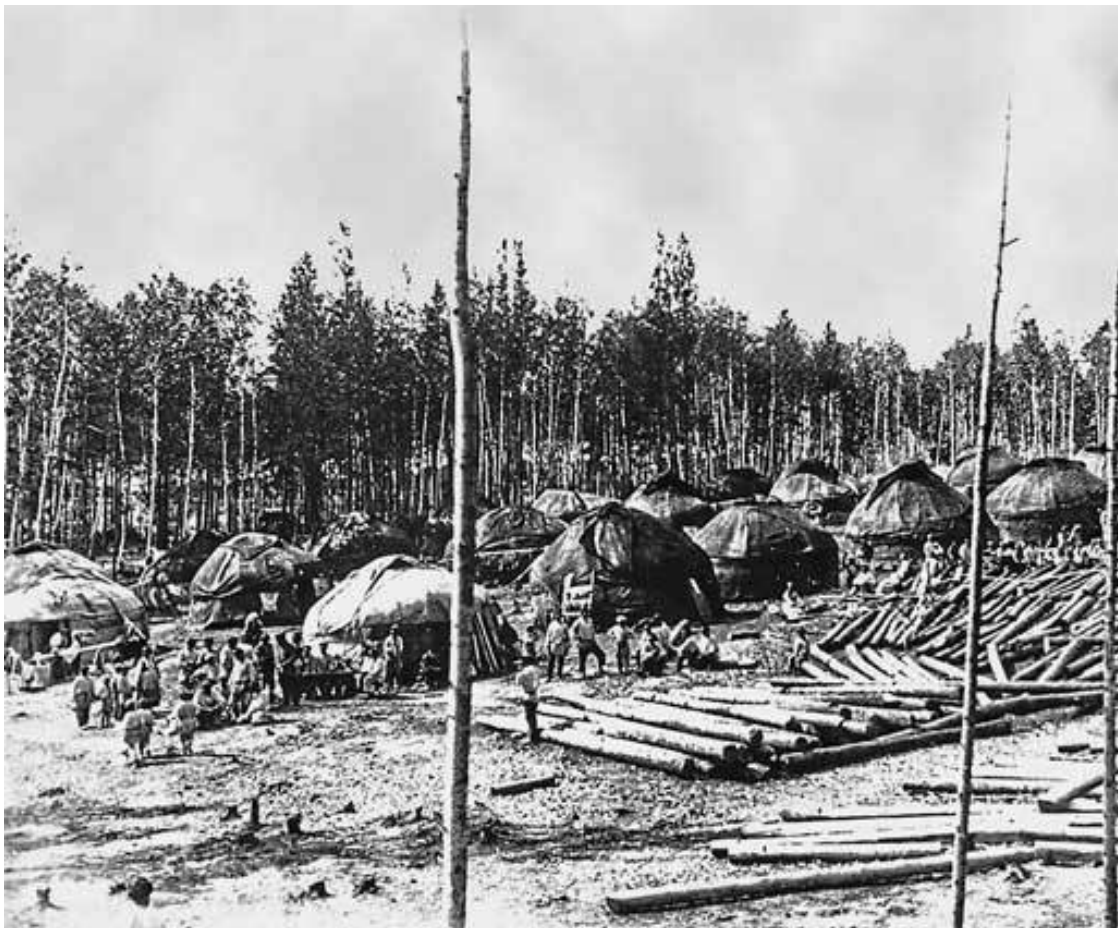
Переселенцы обустраиваются на новом месте

Первым же делом, которым занялись новые поселенцы сразу после того, как мало-мальски наладили собственный быт, было строительство храма в Мало-Ирменке. До этого церкви здесь не было, и малочисленные здешние жители на богослужение ездили в соседнее село Ордынское. Новоселы же жить без собственного храма не могли, а потому вновь принялись рубить лес и возить его через Обь, в чем им помогал благочестивый купец Кузьмин, выделявший средства на постройку. Вскоре в селе уже стоял небольшой, но ладный деревянный храм в честь святого Архангела Михаила, которого в здешних местах особенно почитали, посвящая ему церкви чуть не в каждой второй деревне.