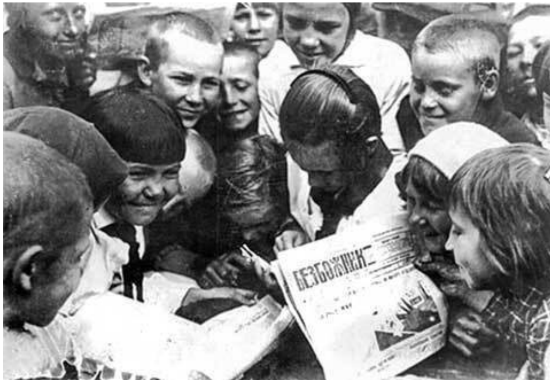
Дети читают газету «Безбожник». 1920-е гг.

в «избе» сельские собрания. В их обязанности входило доведение до населения информации о политической обстановке и решениях партии, организация различных кружков и чтение вслух для неграмотных сельчан. Короче говоря, избач того времени был тем, кого впоследствии в Стране Советов стали называть громоздким словом «культпросветработник».