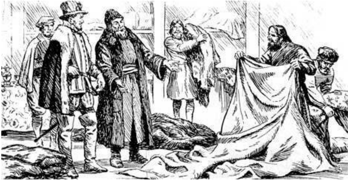
Английский купец в России

Началась эта зарубежная торговля вилегодцев в августе 1553 года, когда в устье Северной Двины вошел английский корабль «Эдуард Бонавентура» под командованием Ричарда Ченселора. Это был один из трех кораблей сэра Хью Уиллоби, отправленных королем Эдуардом VI на поиски северного пути в Китай и Индию, – и единственный, которому повезло сохраниться в этом опасном походе. Британцы были весьма удивлены, узнав, что вместо Китая оказались в Московии, однако быстро оценили выгоды своего открытия.