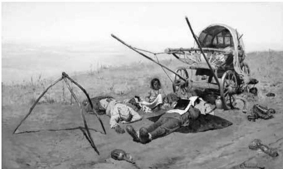
С. В. Иванов. В дороге. Смерть переселенца. 1889 г.

Лишь в последние предреволюционные годы переселенец из Центральной России добирался в Сибирь с относительным комфортом – по железной дороге, в специально оборудованном «столыпинском» вагоне, где было отгорожено отдельное пространство для людей и отдельное – для крестьянской скотины. По сравнению с дорожным бытом переселенцев еще каких-то нескольких лет до начала реформы государственного освоения Сибири такой способ перемещения действительно был верхом удобства.