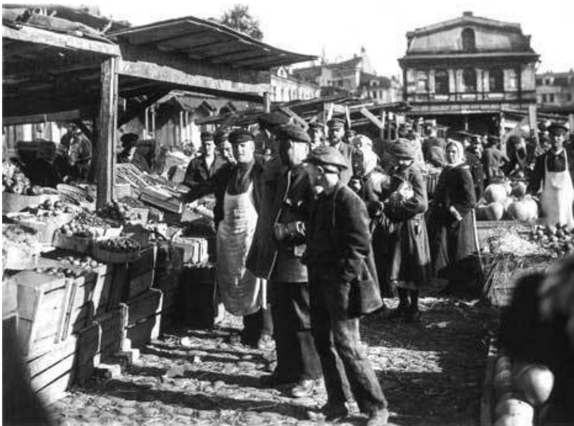
Во времена НЭПа на рынках вновь появились продукты

Но если в хозяйственном отношении на селе все менялось в лучшую сторону, то в духовном состоянии крестьянского общества изменения становились хуже год от года. Войну с верой и Церковью новая власть продолжала вести с удвоенной силой. Духовенство в ее глазах стояло наравне с классом эксплуататоров, «недобитыми» белогвардейцами и прочими прислужниками «проклятого царизма». Самое главное, что такое восприятие «классового врага» активно внедрялось в сознание рядового жителя села.