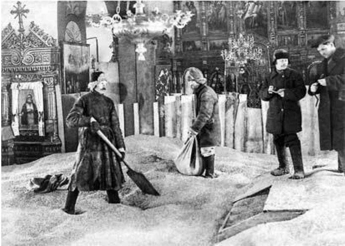
Зернохранилище в церкви. 1920 г.

Власть ответила на недостаток хлеба «продразверсткой» – попросту грабежом, когда вооруженные отряды красноармейцев отнимали у крестьян остатки зерна. В Ордынске был закрыт базар, запрещена частная торговля. Деньги обесценились, в некоторых местах дело доходило до каннибализма. С невероятным цинизмом власть большевиков и лично В. И. Ленин использовали страшный голод для того, чтобы развязать кампанию по грабежу и закрытию храмов и монастырей, подвергая репрессиям духовенство. Недовольство и возмущение действиями советской власти росли и ширились повсеместно, в том числе и в Сибири. Но во всей России с падением Белого движения больше уже не осталось силы, способной объединить народ на борьбу с новой властью.