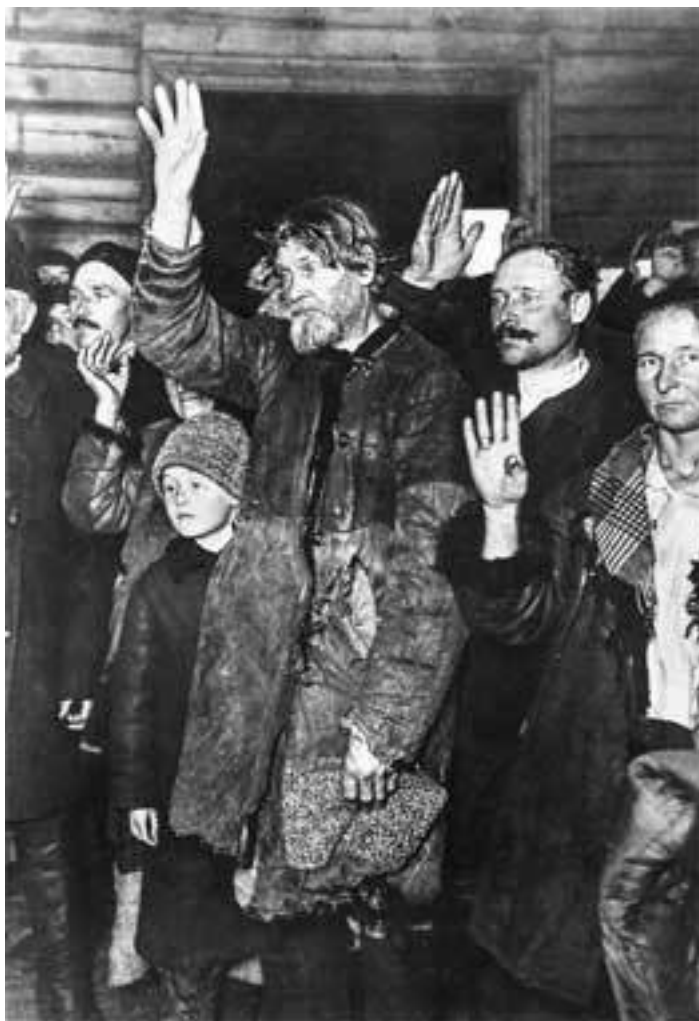
«Счастливые» крестьяне голосуют за колхоз

Сама идея такого образа ведения хозяйства настолько противоречила ценностям крепкого сибирского крестьянина, что идея колхозов встретила отпор даже у представителей сельсоветов и сельских коммунистов. Например, в селе Сушиха секретарь местной партийной ячейки и член партийного бюро открыто высказывали, что «никакого толку от всех этих батраков не будет, куда хошь их соединяй. Батраки все – пьяницы и лодыри, даже в партию из них некого принять». А в селе Верх-Ирмень, соседнем с Мало-Ирменкой, в котором жили Байбородины, члены местной партиячейки, насчитывавшей двенадцать членов партии и двенадцать кандидатов, заявили, что «лучше из партии, чем в коммуну» 18 .