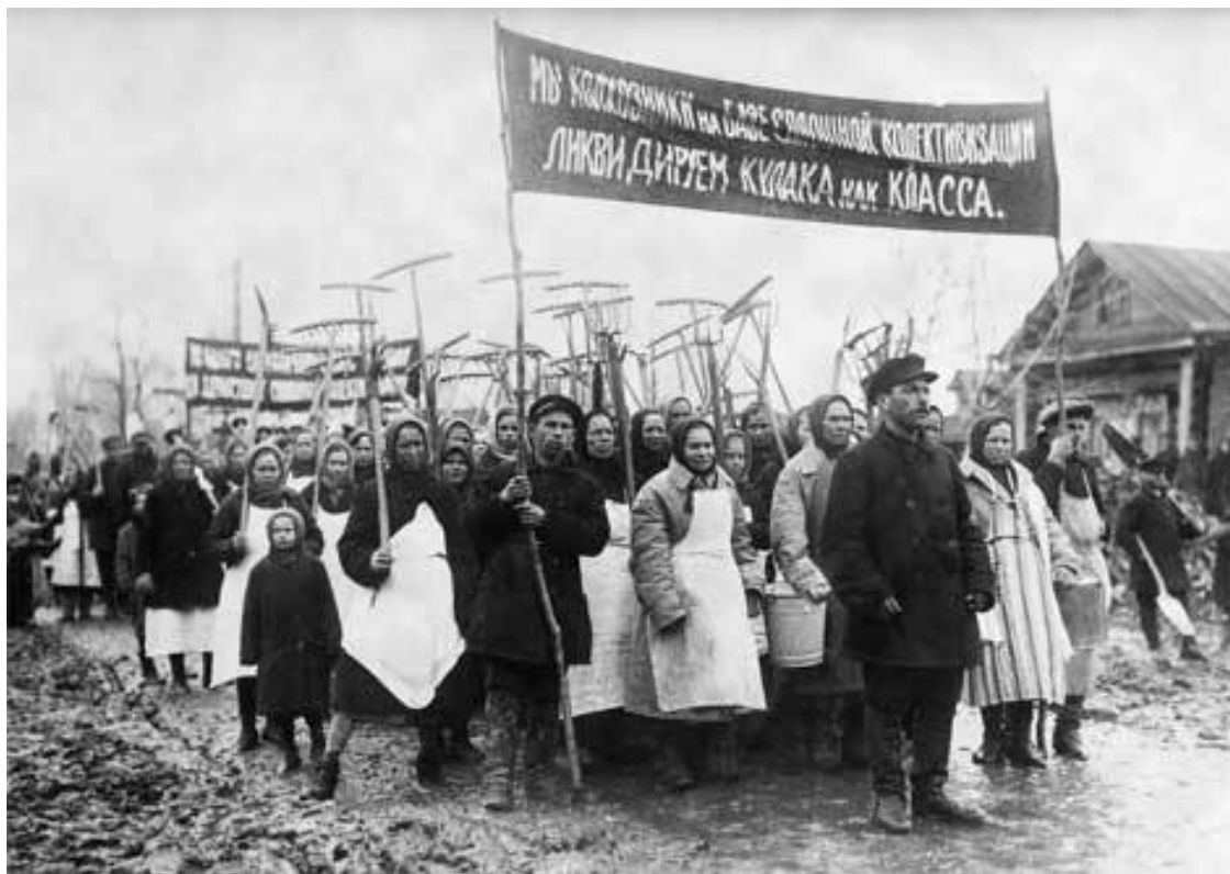
Демонстрация сельской бедноты за «раскулачивание». 1931 г.

После сдачи этих нормативов у крестьянина зачастую не оставалось зерна ни на прокорм своей семьи, ни даже на посевную (а как раз перед посевной 1928 года началась кампания по сдаче хлеба). Попытки возмущения некоторых хозяев, пробовавших открыто отказаться от сдачи хлеба, были пресечены с предписанной жесткостью, так что оставшиеся были испуганы настолько, что Ордынский район даже оказался среди перевыполнивших план по поставкам зерновых государству. Что же до возмущавшихся, то наказание в отношении них носило показательно-устрашающий характер: некоторые хозяева были расстреляны, некоторые посажены в тюрьмы или отправлены на каторжные работы, остальные сосланы вместе с семьями на самый север Сибирского края. При этом все без исключения, конечно, были обобраны до нитки, так что оставшимся в живых в пору было идти по миру побираться.