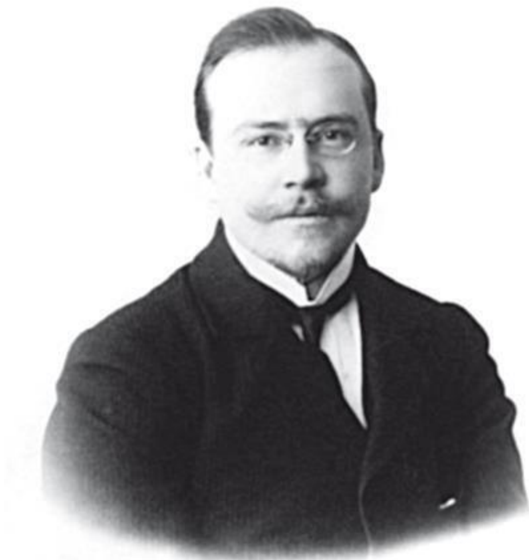
Д. Б. Шостакович, отец Дмитрия