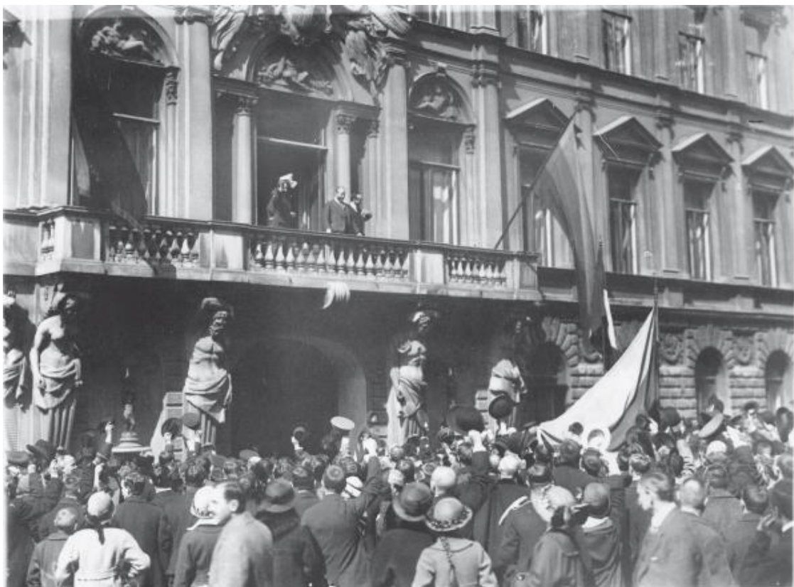
Итальянский посол и члены посольства приветствуют толпу народа, собравшуюся перед посольством (Морская ул., 43) по случаю объявления Италией войны Австро-Венгрии. 27 августа 1916 г. (ЦГАКФФД СПб)

Моя вторая сестра руководила классом мальчиков. Они сидели перед нею на ступенях укромной, но светлой лестницы; так как классов было много, то они размещались, где и как могли» 14 .