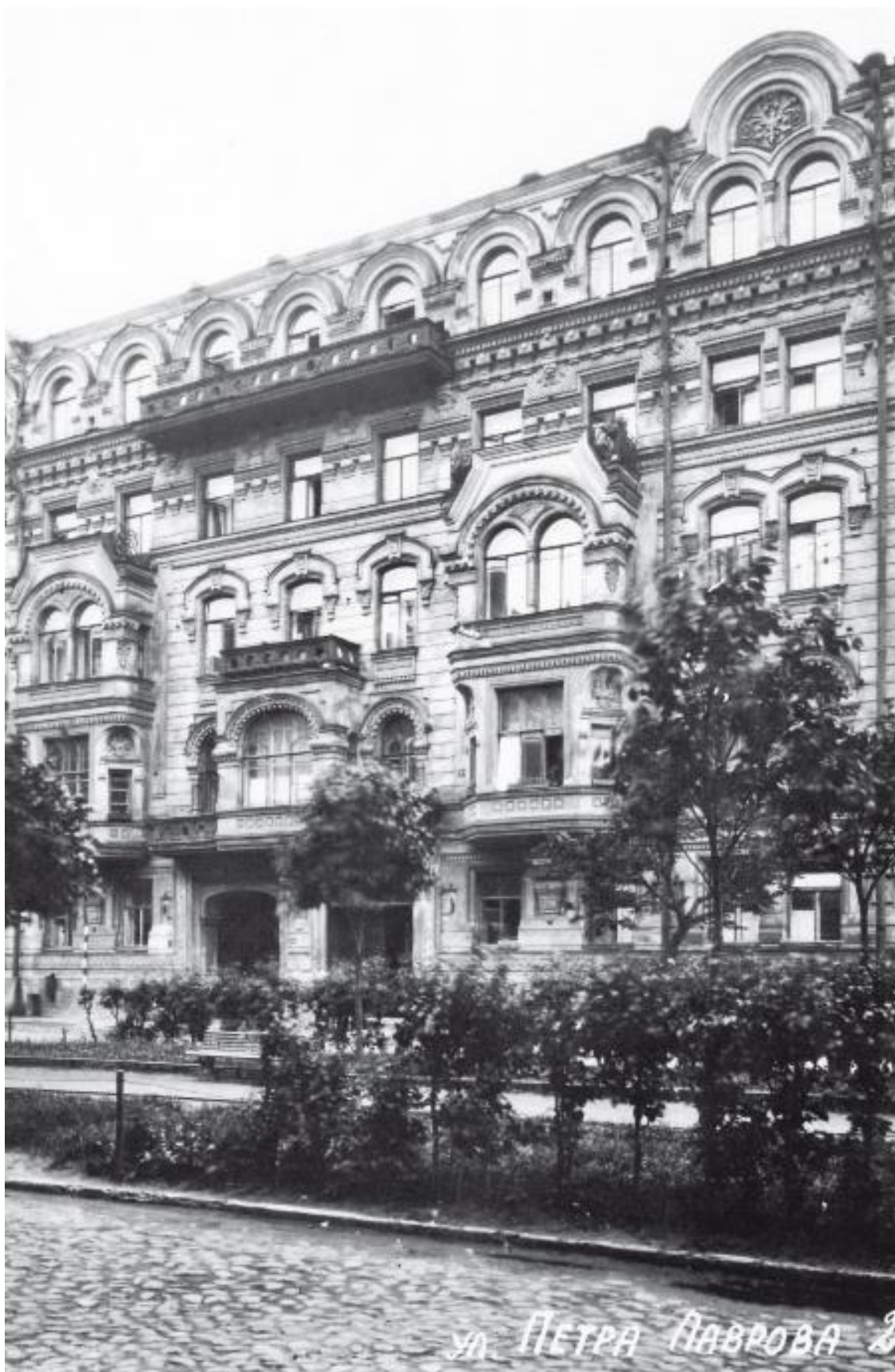
Улица Петра Лаврова. до реконструкции!

В 1917 году двери этого дома открывает Владимир Ильич, а за восемьдесят пять лет до этого то же самое делал Пушкин, три месяца проживший в доме Алымовых, стоявшем на