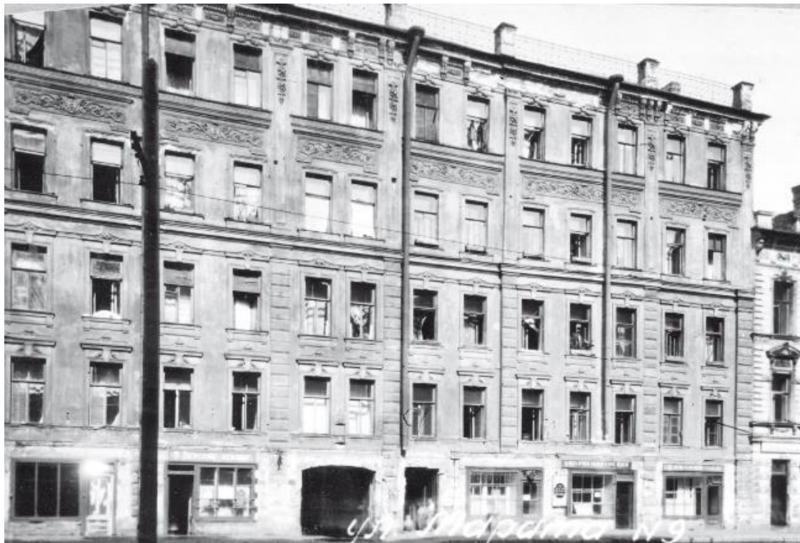
Дом № 9 по улице Марата, где с 1914 по 1934 годы жила семья Шостаковичей

палочку, невозможно передать. Могу только сказать, что иногда бывает трудно пережить даже великое счастье... Все прошло блестяще – великолепный оркестр, превосходное исполнение... Но самый большой успех выпал на Митину долю. По окончании симфонии Митю вызывали еще и еще. Когда наш юный композитор, казавшийся совсем мальчиком, появился на эстраде, бурные восторги публики перешли в овацию...» 10