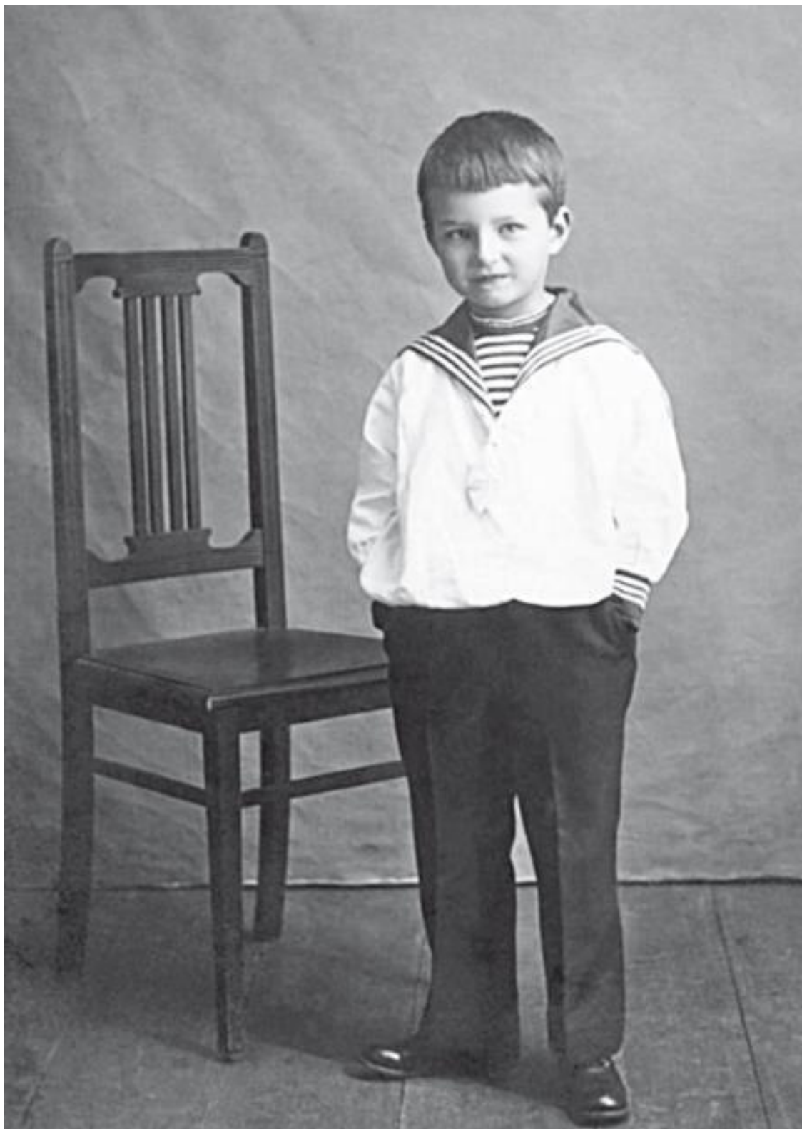
Митя Шостакович, 1914

«29 марта 1933 г., Ленинград. Вчера встал с постели. Перенес ангину и воспаление среднего уха. Вчера у меня неожиданно собралось большое общество. Были все превосходные люди. Все пришли «на огонек» без предупреждения, угощать было абсолютно нечем, но время провели славно. Часа в два ночи раздался густой храп. Это Нина заснула, тем самым намекнув гостям, что пора и домой. Пишу понемногу концерт для фортепиано с оркестром и выражаю