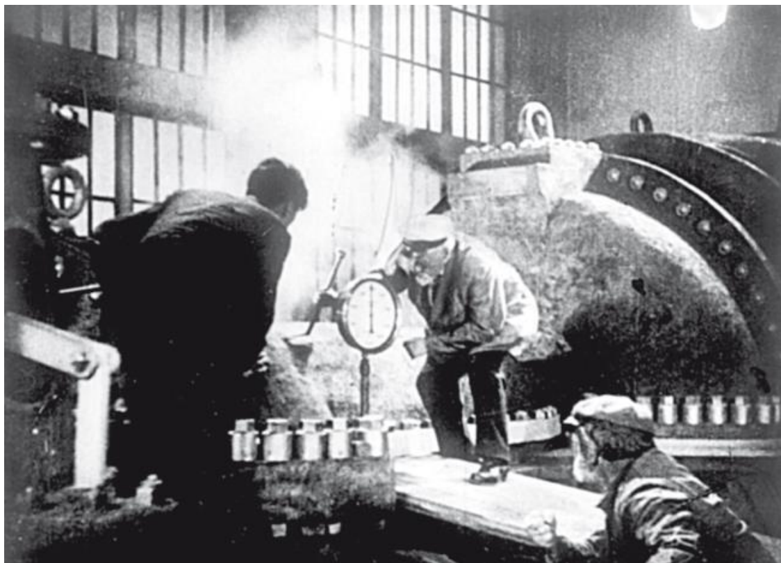
Кадр из кинофильма "Встречный" (музыка Дмитрия Шостаковича)

Сергей Юткевич покинул квартиру на Марата, 9, в 1934 году, вслед за Дмитрием Шостаковичем, который давно надеялся на улучшение жилищных условий, и наконец это произошло: «Октябрь 1932 г., Ленинград. Вчера состоялось очередное заседание правления ленинградского Союза композиторов. На заседании было постановлено задействовать перед ЦИК СССР о награждении меня к пятидесятилетию Октябрьской революции орденом Трудового знамени. Мотивировка такова: я честно работал за время моей сознательной жизни с партией и рабочим классом, несмотря на мою тяжелую прошедшую жизнь (тяжелое в высшей степени материальное положение и тому подобное), я не утратил веры в победу Октябрьской революции и проникался все большим и большим энтузиазмом в деле создания советской музыкальной культуры. <...> В общем, говорили так много хороших слов, что я чуть не расплакался, будучи по природе человеком нервным. Говорили даже о моих скверных квартирных условиях, я же убежал, дома всплакнул немножко, потом стал трезво рассуждать: получу или не получу...» 3