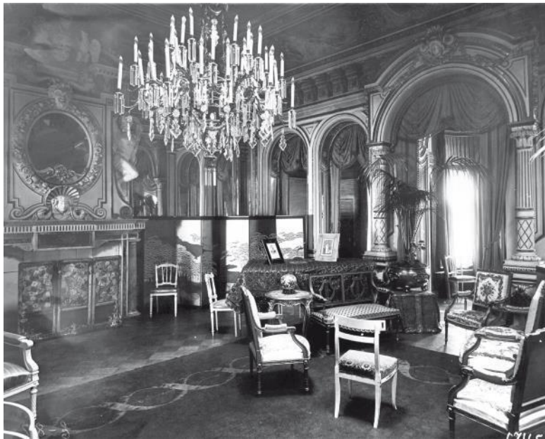
Часть Большого зала

Мог ли предположить Огюст Монферран, строивший в 1830–1840-х этот и соседний дом (№ 45), параллельно с возведением Исаакиевского собора, что залы, спроектированные для привычных нужд аристократов – балов, званых вечеров, светских приемов, – будут использоваться по назначению только первыми хозяевами особняков – владельцем сибирских чугуноплавильных заводов Павлом Демидовым и