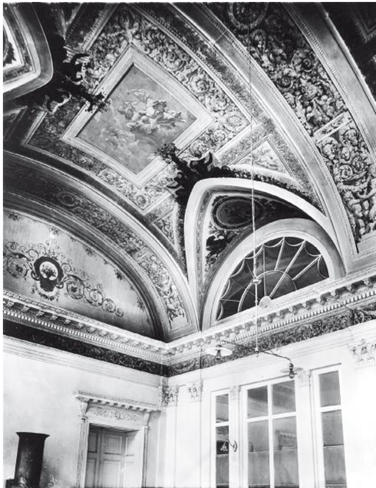
Орнамент в Обеденном зале