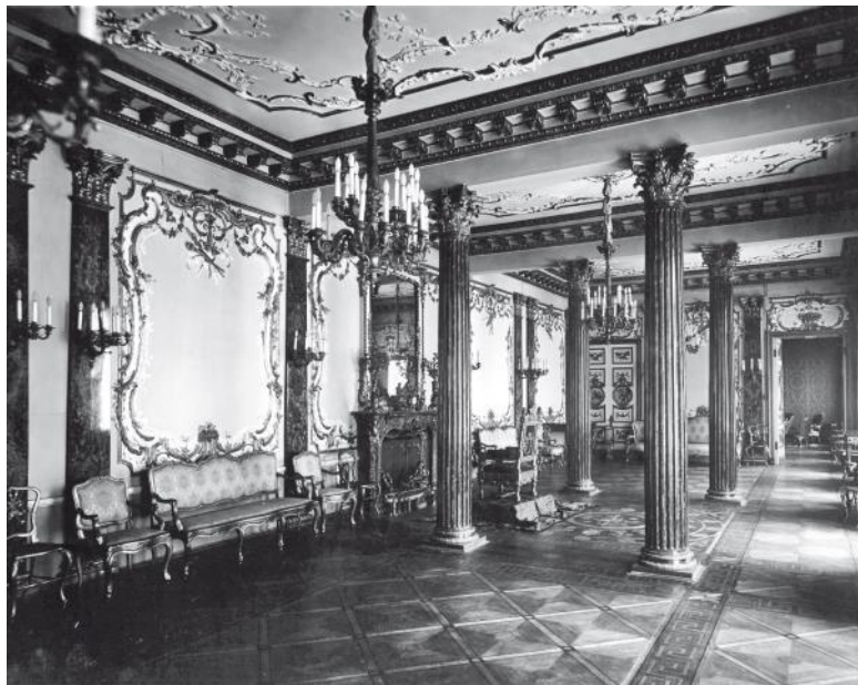
Вид части колонного зала