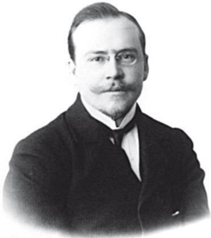
Д. Б. Шостакович, отец Дмитрия