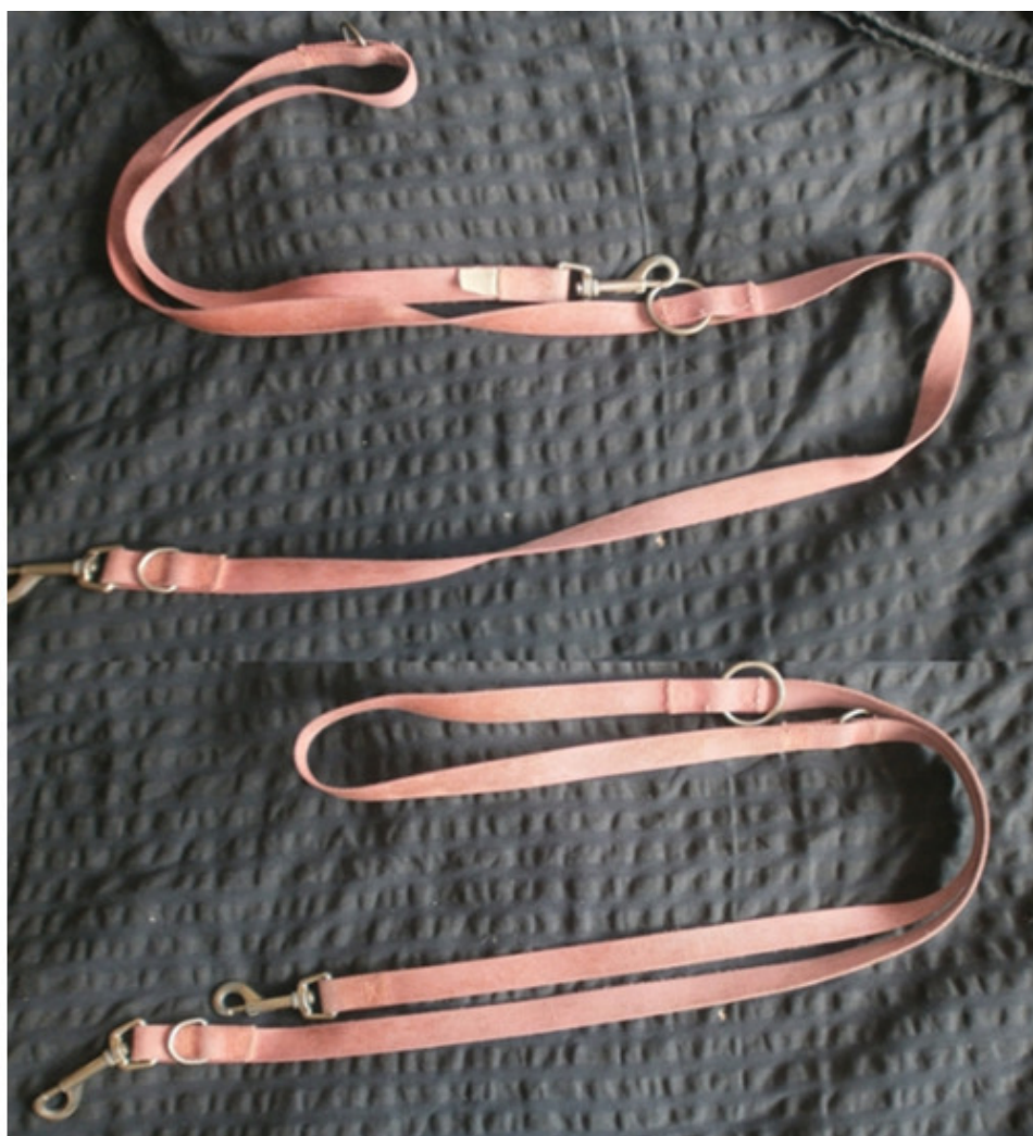
Наш поводок, @rgladel

Как и в случае с вопросом о том, следует ли использовать ошейник или шлейку, решение о выборе подходящего поводка в конечном итоге остается за вами. В этой главе вы узнаете, какие существуют типы поводков и что их отличает. Нет ничего плохого в том, чтобы попробовать несколько разных поводков и только потом решить, какой из них вам подходит. При покупке шлейки убедитесь, что лопатки могут свободно двигаться, а подмышки ничего не натирает. Область груди должна иметь широкую набивку. Покупайте шлейку сразу после переезда щенка в новый дом, если у вас нет возможности проверить посадку детали заранее.