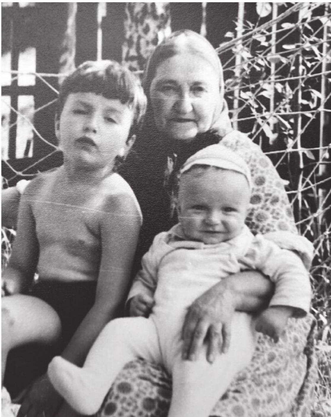
С бабушкой и братом