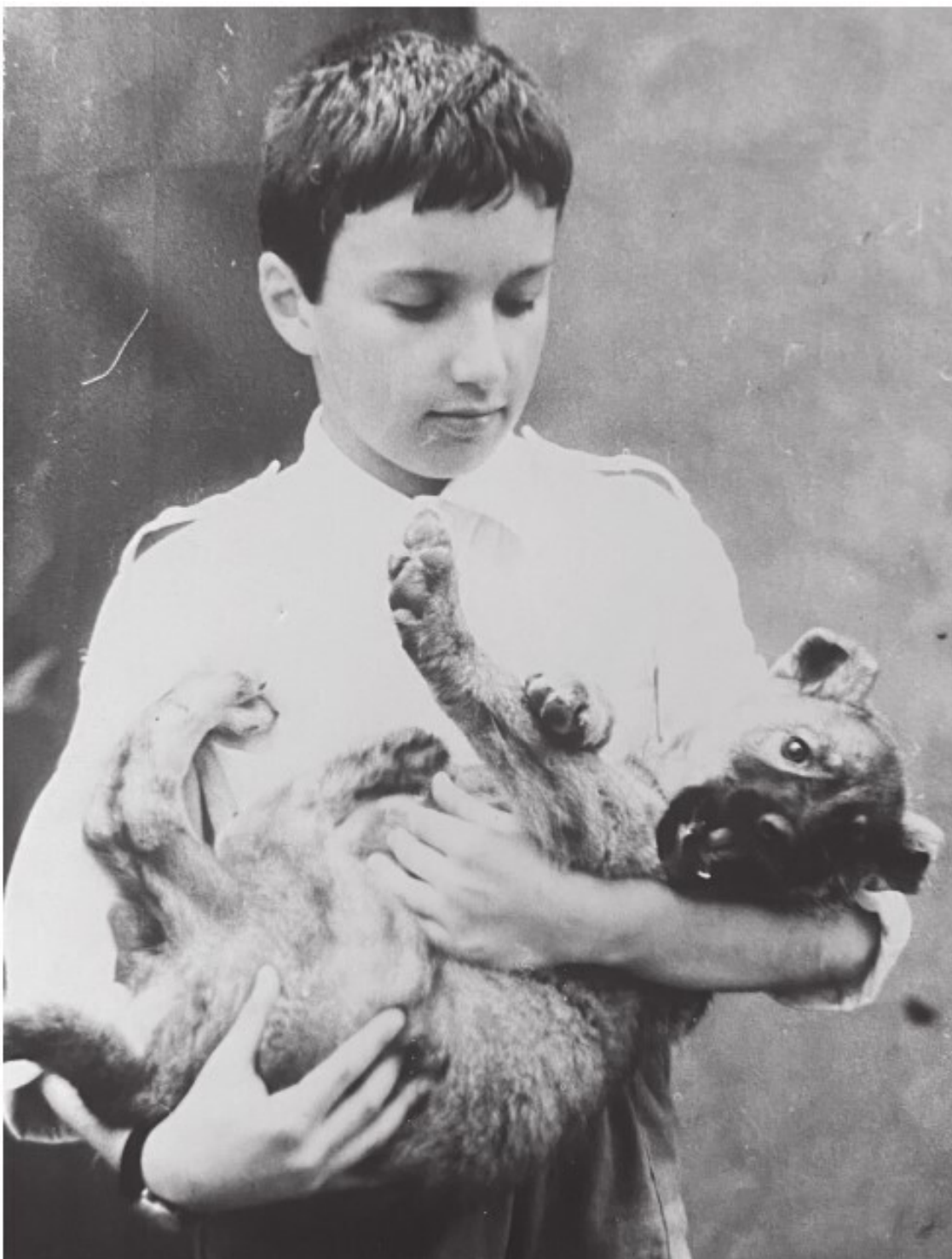
С щенком алабая

«Долго ещё будет выть эта собака? Заснуть, видно, сегодня не получится, – подумал я и попытался ещё раз проанализировать ситуацию. – Ясно было только одно: дела мои – дрянь».