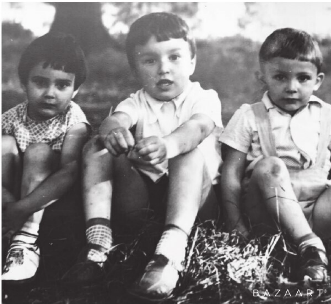
С двоюродными братом и сестрой

И представьте себе моё удивление, когда вечером мать привела домой моего младшего брата – я уже даже было успел смириться в мыслях с тем, что всё, ему хана. Расспросили его – так и вышло, действительно этот мужик его в садик отвел.