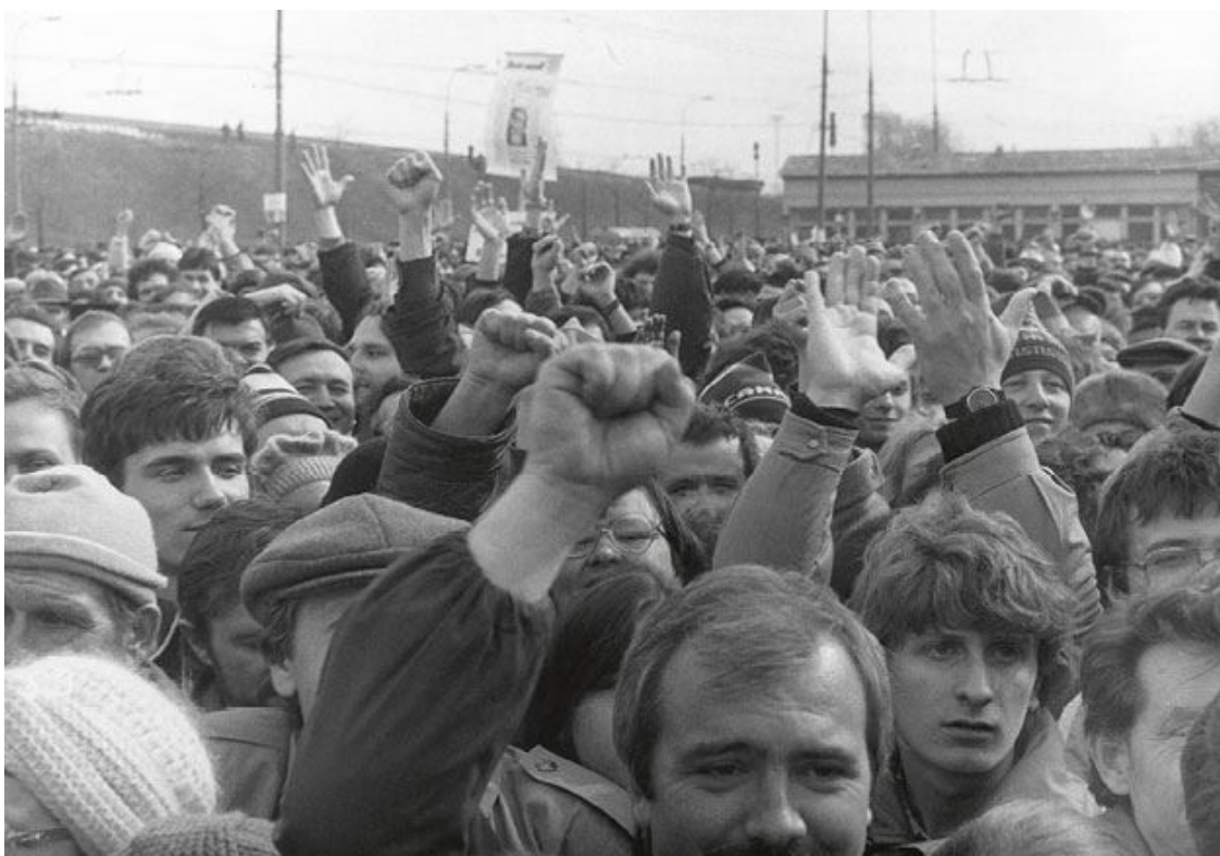
Митинг в поддержку кандидата в народные депутаты Бориса Ельцина и других демократических депутатов. 25 марта 1989 года. Москва