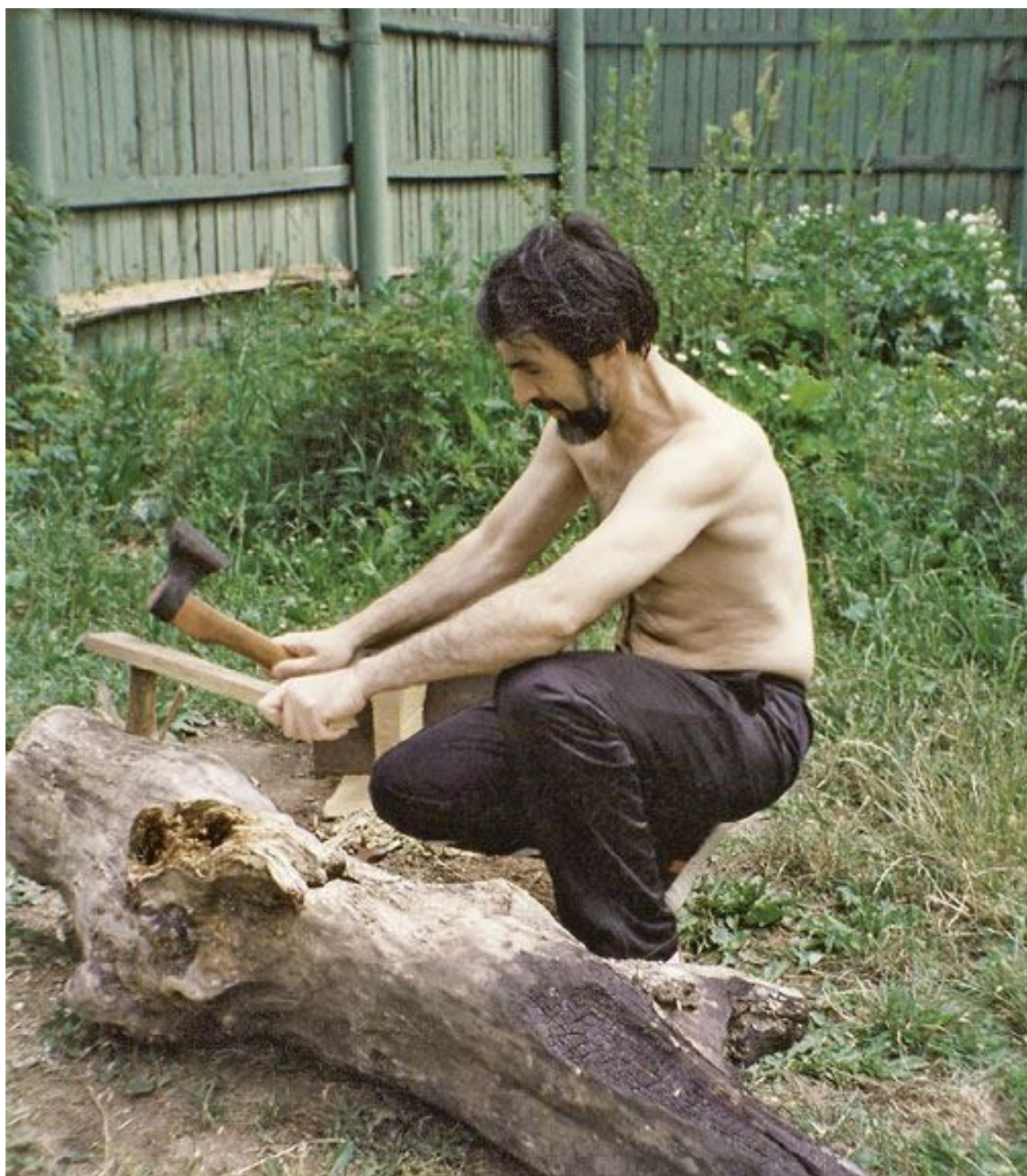
В свободное от политики время, очень редкое в те годы. На даче в Подмосковье