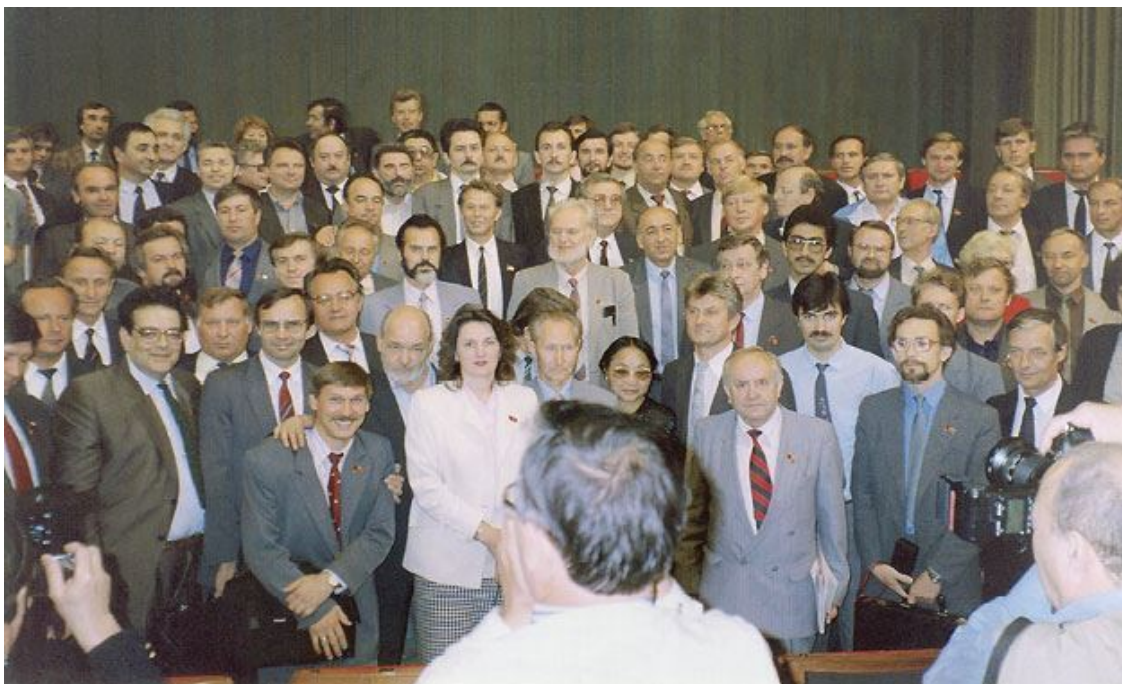
Первая в СССР легальная оппозиция – Межрегиональная депутатская группа, которую создали народные депутаты СССР