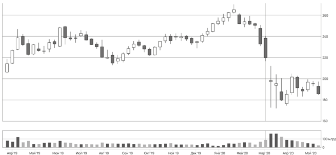
Рисунок 1. График акций с низкой волатильностью

ником пассивного дохода я бы не стала. Какой же это пассивный доход, если ты постоянно совершаешь сделки и при этом находишься в стрессе?