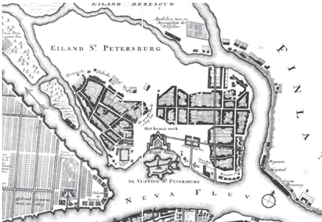
Фрагмент карты Санкт-Петербурга 1717 года.

он велик для него и для его людей и как посланник в нем поместится – об этом предоставляют заботиться ему самому».