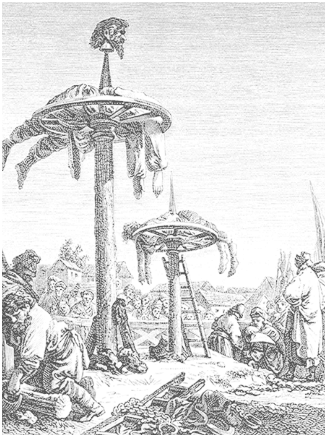
Казнь колесованием. Со старинной гравюры.