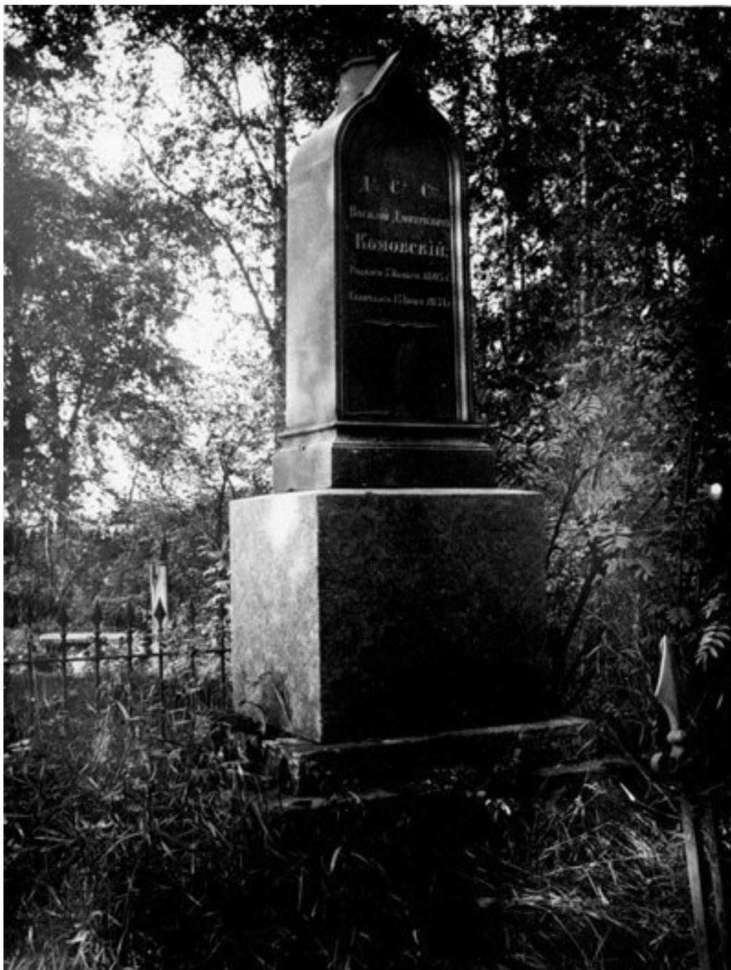
Надгробие Комовского на Митрофаниевском кладбище

Поблизости от магометанских в эпидемию 1831 г. было основано холерное кладбище на Волковом поле. От этого некрополя, где, в частности, был похоронен известный театральный декоратор и садовод Пьетро Гонзага (1751–1831), не осталось и следа.