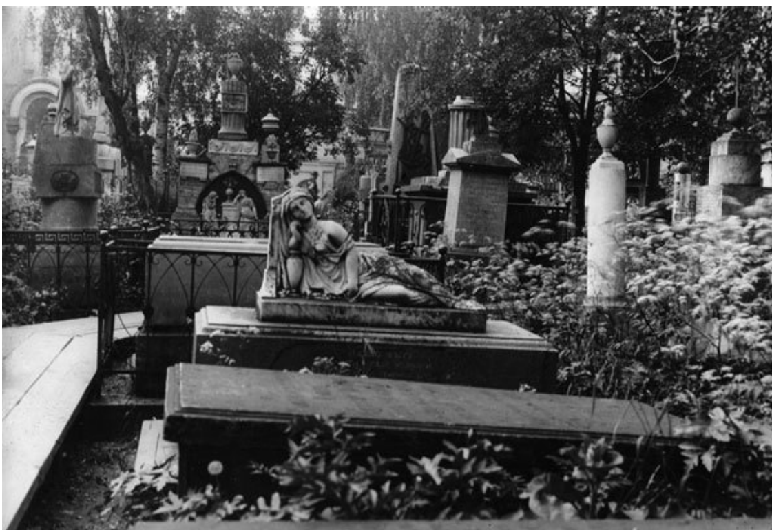
Лазаревское кладбище Александро-Невской лавры

Лазаревское кладбище не было приходским. На нем хоронили лишь знатных особ, по повелению, а часто и в личном присутствии Петра I. Так, в 1719 г. здесь был похоронен гене-