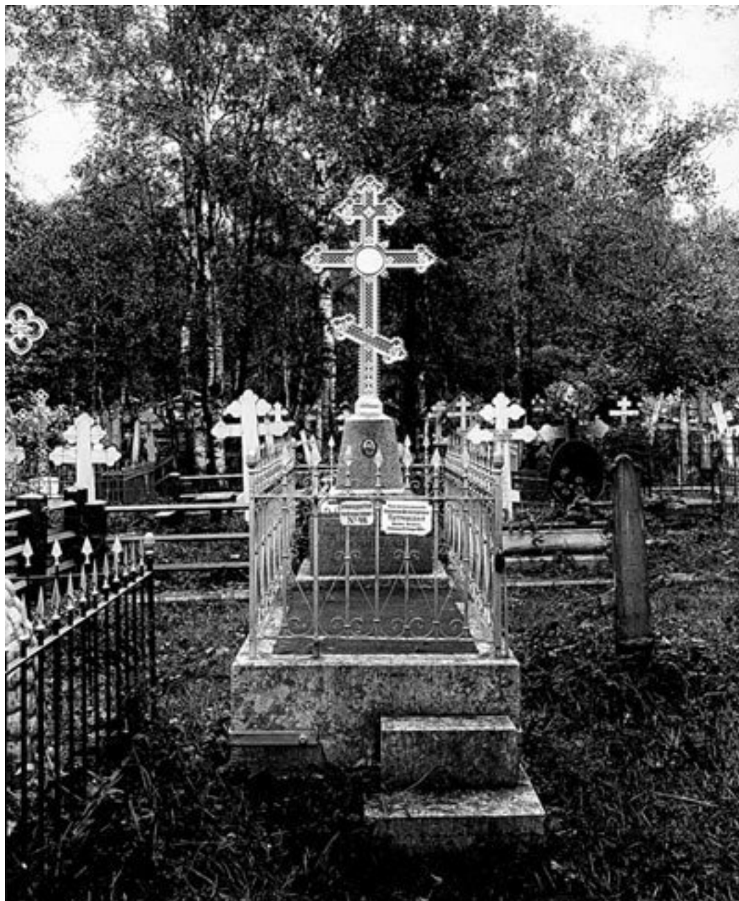
Надгробие на Волковском православном кладбище

Кладбище у Волковой деревни было учреждено взамен закрытого Ямского. Место для него назначили на левом берегу Черной речки, в устье которой находился Невский монастырь. В начале XIX в. был прорыт Обводный канал, разорвавший эту речку; нижняя ее часть стала называться Монастыркой, а верхняя – Волковкой. Волковское кладбище было открыто к концу лета 1756 г. в том же году здесь похоронили почти девятьсот человек. К 1880-м гг. протяженность кладбищенских дорожек – «мостков» (их мостили от сырости досками) – достигала двенадцати верст, а численность погребенных приближалась к шестистам тысячам.