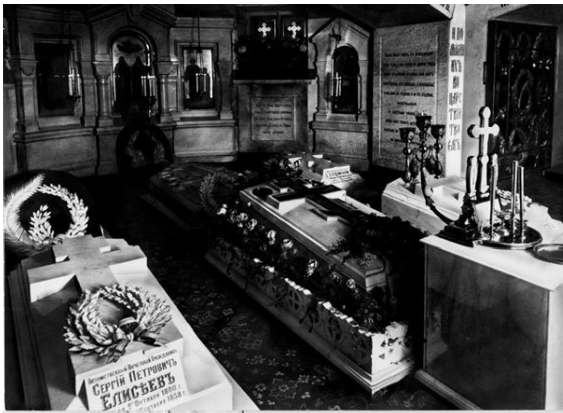
Церковь-усыпальница Елисеевых возле Большеохтинского кладбища

В 1776 г., после того как хоронить при церкви было запрещено, в двух верстах от нее, на берегу реки Красной, устроили новое кладбище, получившее название Красненькое . Здесь стояла деревянная часовня Казанской Божией Матери с особо почитаемой у местных жителей иконой. В XIX в. на Красненьком хоронили главным образом обитателей Нарвской заставы – рабочей окраины Петербурга.