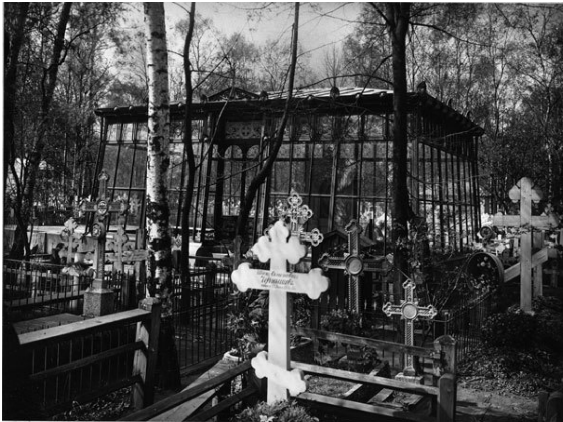
Волковское православное кладбище

вам-усыпальницам и Лазаревскому кладбищу прибавились Тихвинское (1823) и Никольское (1863) кладбища, Духовская (1821) и Исидоровская (1891) церкви-усыпальницы. В лаврском некрополе за два века его существования было погребено свыше двенадцати тысяч человек. Это значительно меньше, чем на других крупных исторических кладбищах Петербурга, но надо помнить, что здесь, помимо лиц духовного звания, хоронили только самых знатных и состоятельных людей.