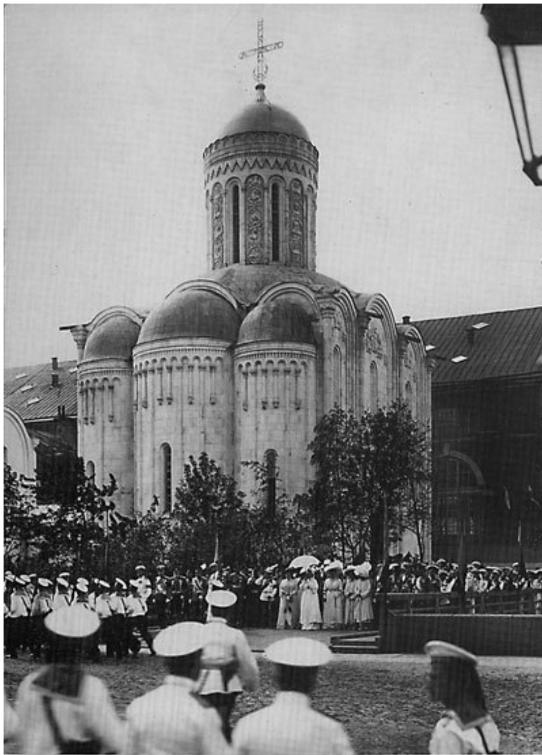
Храм Христа Спасителя («Спас на водах»)

Памятником русским морякам, погибшим в войне 1904–1905 гг., стал храм Христа Спасителя («Спас на водах»), воздвигнутый в 1911 г. на набережной Невы по проекту архитектора М. М. Перетятковича. Храм как бы объединил в себе походные судовые церкви погибших кораблей и стал «символом братской могилы для погибших без погребения героев-моряков» 93 . На его стенах укрепили памятные доски с именами всех, кто погиб в морских сражениях Русско-японской войны. Стройный и легкий силуэт храма напоминал Дмитриевский собор во Вла-