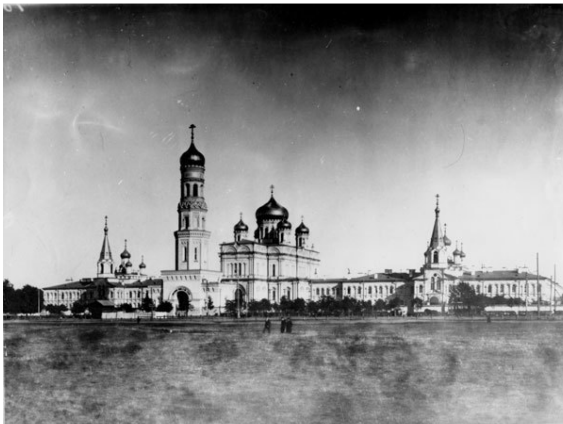
Воскресенский Новодевичий монастырь

Ряд кладбищ располагался вблизи Шлиссельбургского тракта. Здесь к середине прошлого века некогда тихие селения превратились в оживленную промышленную окраину, прозванную «русским Манчестером».