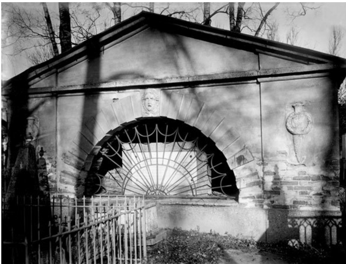
Склеп М. Руска на Волковском лютеранском кладбище

По мере развития Волковских и Смоленских кладбищ, ставших основными для всего города, были окончательно закрыты старые кладбища при приходских церквях. В 1756 г. вновь поступило распоряжение старые кладбища «засыпать землей и песком и утрамбовать на поларшина» 87 . К концу столетия некоторые участки старых кладбищ (Сампсониевского, Вознесенского) продали в частное владение.