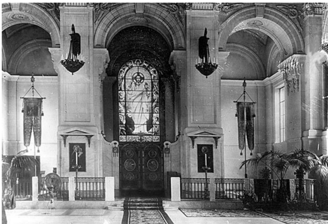
Великокняжеская усыпальница в Петропавловской крепости. Интерьер