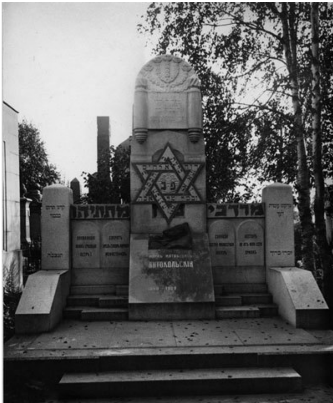
Надгробие М. М. Антокольского на Еврейском кладбище

В 1799 г. около церкви Рождества Иоанна Предтечи на Каменном острове по повелению Павла I было устроено небольшое кладбище рыцарей Мальтийского ордена , гроссмейстером которого он был. 18 августа 1807 г. прах погребенных здесь рыцарей тайно, ночью, перезахоронили на Смоленском кладбище. О дальнейшей судьбе этого захоронения ничего не известно 88 .