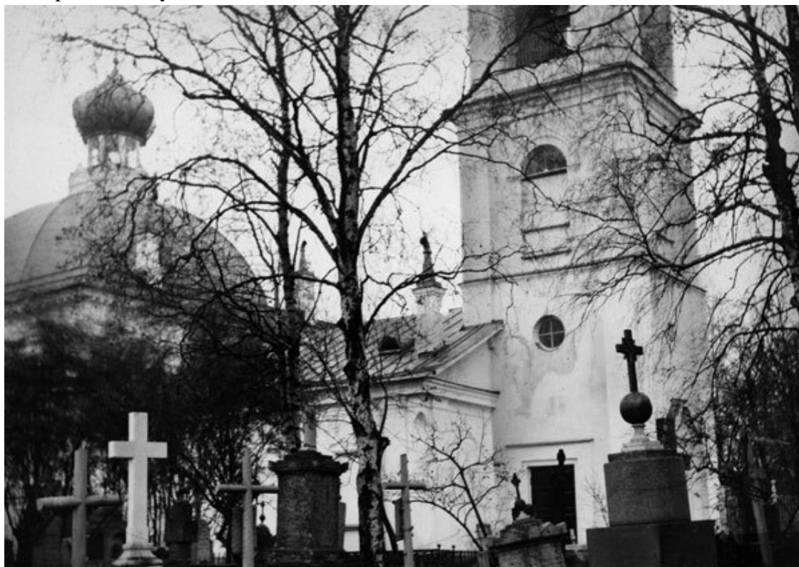
Спасо-Преображенское (Фарфоровское) кладбище

В начале XVIII в. на левом берегу Невы, у Шлиссельбургского тракта возникла слобода, где жили рабочие казенных кирпичных заводов. Первая деревянная церковь появилась в слободе в 1711 г., а двадцать лет спустя ее сменил каменный Преображенский храм. При Елизавете Петровне здесь была основана Невская порцелиновая мануфактура, переименованная в 1765 г. в Императорский фарфоровый завод, изделия которого получили мировую известность. С самого основания при Преображенской церкви существовало приходское кладбище с деревянной часовней Спаса Нерукотворного. Кладбище называли Спасо-Преображенским , или Фарфоровским . Хоронили на нем не только работников завода, но и столичных жителей и окрестных помещиков. Сохранялось здесь немало памятников конца XVIII-начала XIX вв., представлявших значительную художественную и историческую ценность. Лишь немногие из них, перенесенные в музейные некрополи Александро-Невской лавры, уцелели. Остальные погибли при полном уничтожении кладбища в 1930-е гг.