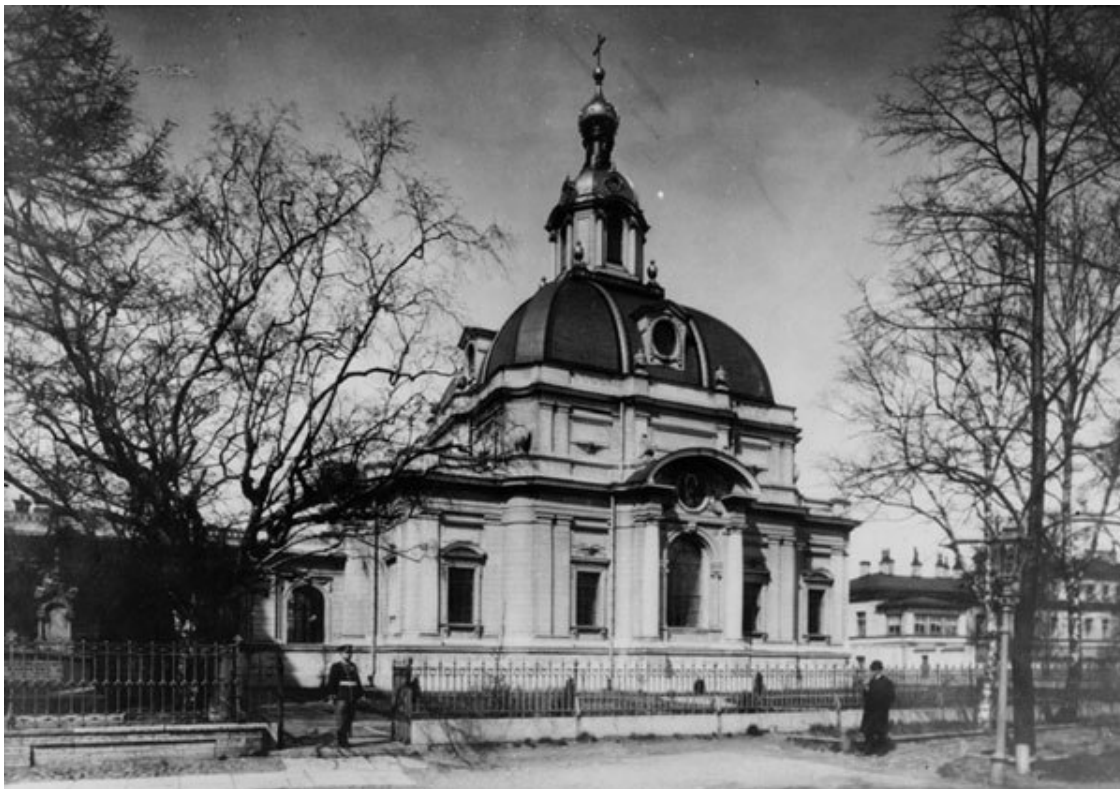
Великокняжеская усыпальница в Петропавловской крепости

На Преображенском кладбище хоронили жертв «кровавого воскресенья» 9 января 1905 г. После открытия в 1931 г. памятника на братских могилах кладбище назвали «Памяти жертв 9 января».