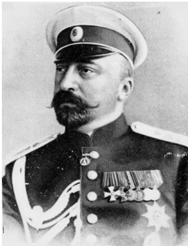
Великий князь Николай Михайлович

Многие ценные материалы исследователь некрополей может найти в периодической печати. Это и описания отдельных памятников, и краткие справки о некоторых кладбищах, и заметки о текущих событиях кладбищенского быта, и многочисленные некрологи. В газетах 1909-1920-х гг. довольно часто сообщали и о различных актах вандализма, разрушении кладбищенских памятников. Много материалов о петербургских некрополях помещали журналы «Иллюстрация», «Русский художественный листок», «Нива», «Родина», «Живописное обозрение», «Исторический вестник», «Зодчий», «Известия С.-Петербургской городской думы». 36