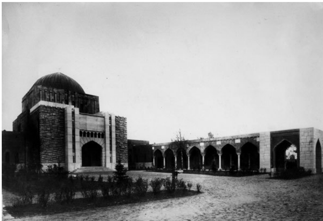
Дом омовения и отпевания на Еврейском кладбище

Среди петербургских кладбищ XVIII в. есть такие, о существовании которых известно лишь по отдельным упоминаниям. Близ Сампсониевской церкви находилось основанное в 1738 г. греческое кладбище , время упразднения которого неизвестно. Карповское кладбище на Аптекарском острове, около впадения р. Карповки в Малую Невку, собирались устроить в 1738 г. Однако часовня на нем была возведена лишь в 1794 г., и позже кладбище приписали к Петропавловскому собору. В начале XX в. это место стало застраиваться жилыми домами.