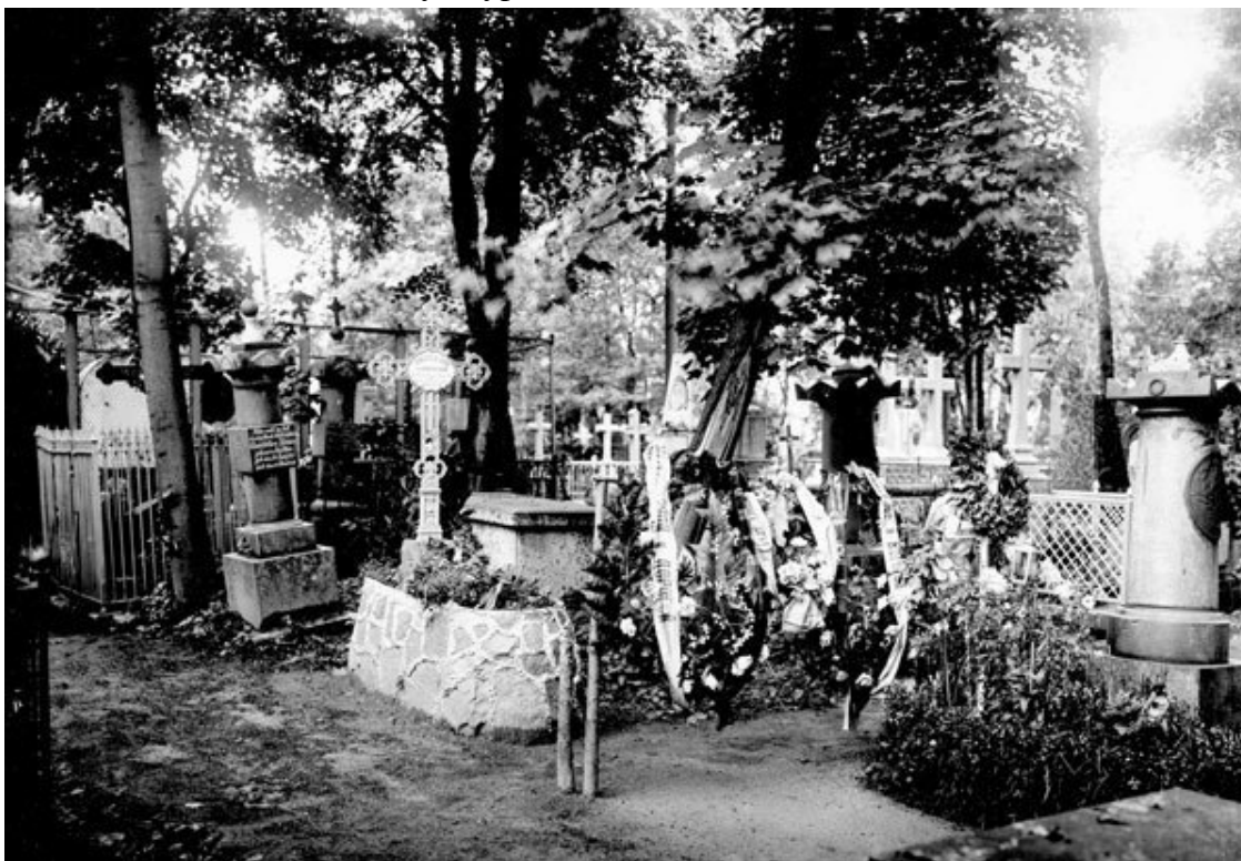
Волковское лютеранское кладбище

В 1772 г. на другом берегу р. Волковки появилось лютеранское кладбище, приписанное к Петропавловской кирхе на Невском проспекте. Тут же была и католическая дорожка. Как и на Смоленском, на Волковском лютеранском кладбище похоронено немало выдающихся людей: военных деятелей, путешественников, ученых, литераторов, творчество которых стало неотъемлемой частью отечественной культуры.