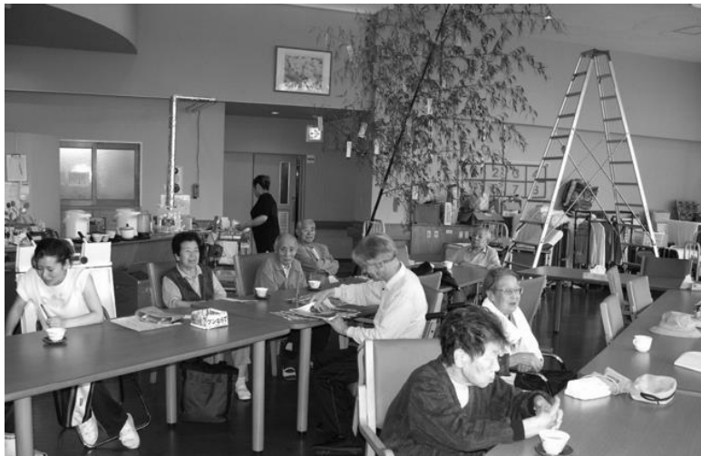
Рис. 0.3. Частный центр дневного пребывания для пожилых людей с деменцией