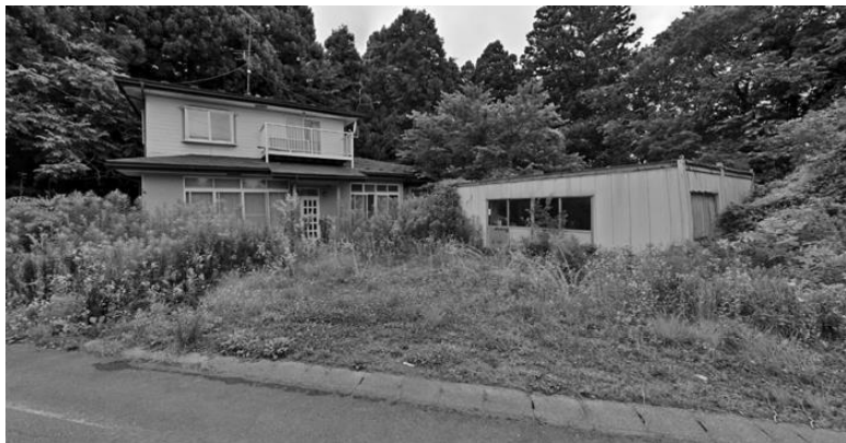
Рис. 0.2. Нежилой дом в Дзёнаи, 2021 г. В этом доме в середине 1990-х годов жили глава поселения и его жена.

ся. Несколько лет назад, прогуливаясь по деревне, я подсчитал, что не менее 40 % домов выглядят нежилыми: в них задернуты шторы и нет почти никаких следов присутствия людей. С помощью приложения Google Maps, одного из лучших изобретений для полевых исследований за последнюю четверть века, я оценил состояние одного из домов, в которых бывал в 1990-е годы (см. снимок экрана на рисунке 0.2). Здесь жил глава местного самоуправления. Помню, что в здании справа он держал уток. Как минимум последние десять лет дом выглядит заброшенным.