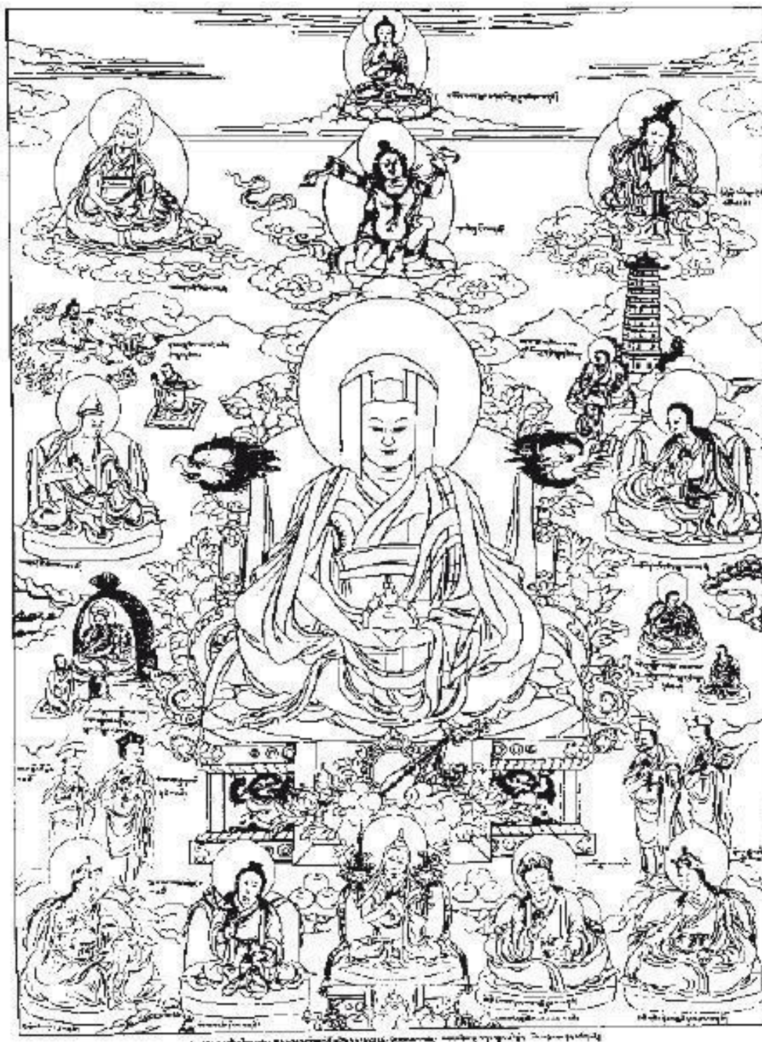
Гампопа (1079–1153), традиция кагью

Сначала мы подвергаем аналитическому исследованию тело и приходим к выводу, что оно состоит из различных компонентов – кожи, крови, костей, плоти, органов. Если мы мысленно разделим эти компоненты, отделяя друг от друга кожу, кости, кровь и остальное и раскладывая их в разные стороны, то едва ли у нас возникнет идея, что тело – это только кожа. Точно так же мы не сможем утверждать, что тело – это исключительно кровь. Ни один из этих компонентов сам по себе не может считаться телом. О них нельзя даже сказать, что они обла-