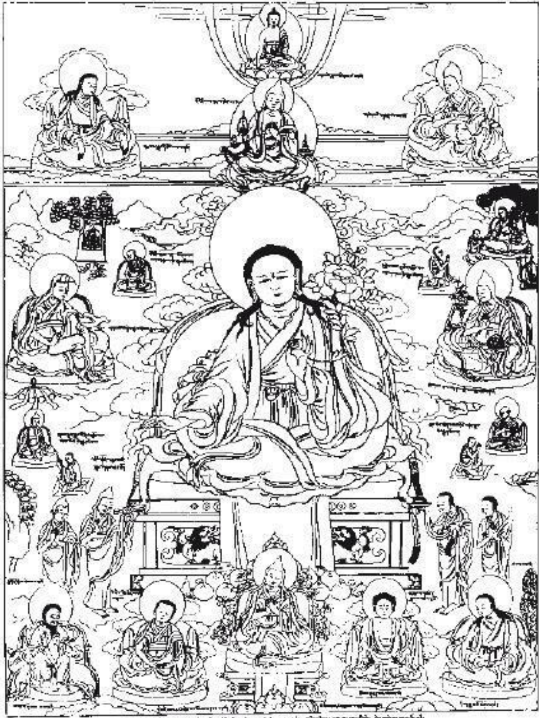
Дромтонпа (1004–1064), линия кадам

Не стоит думать, что нёнд्रो – это простенькая практика для начинающих, что она менее важна по сравнению с практиками махамудры или дзогчен. В действительности предварительные практики выполняют в самом начале именно потому, что они исключительно важны, потому что они являются основой для всех других практик. Если бы мы сразу же приступили к так называемым основным практикам, не получив подготовку, которую дают практики нёнд्रो, от наших основных практик не было бы никакого толку. Наш ум был бы совершенно не готов к таким практикам, мы были бы не в состоянии контролировать его. Тогда наша практика стала