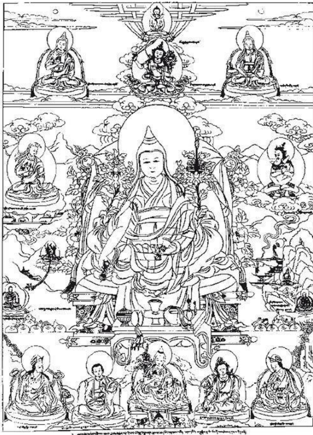
Джамьянг Кхьенце Вангпо (1820–1892)