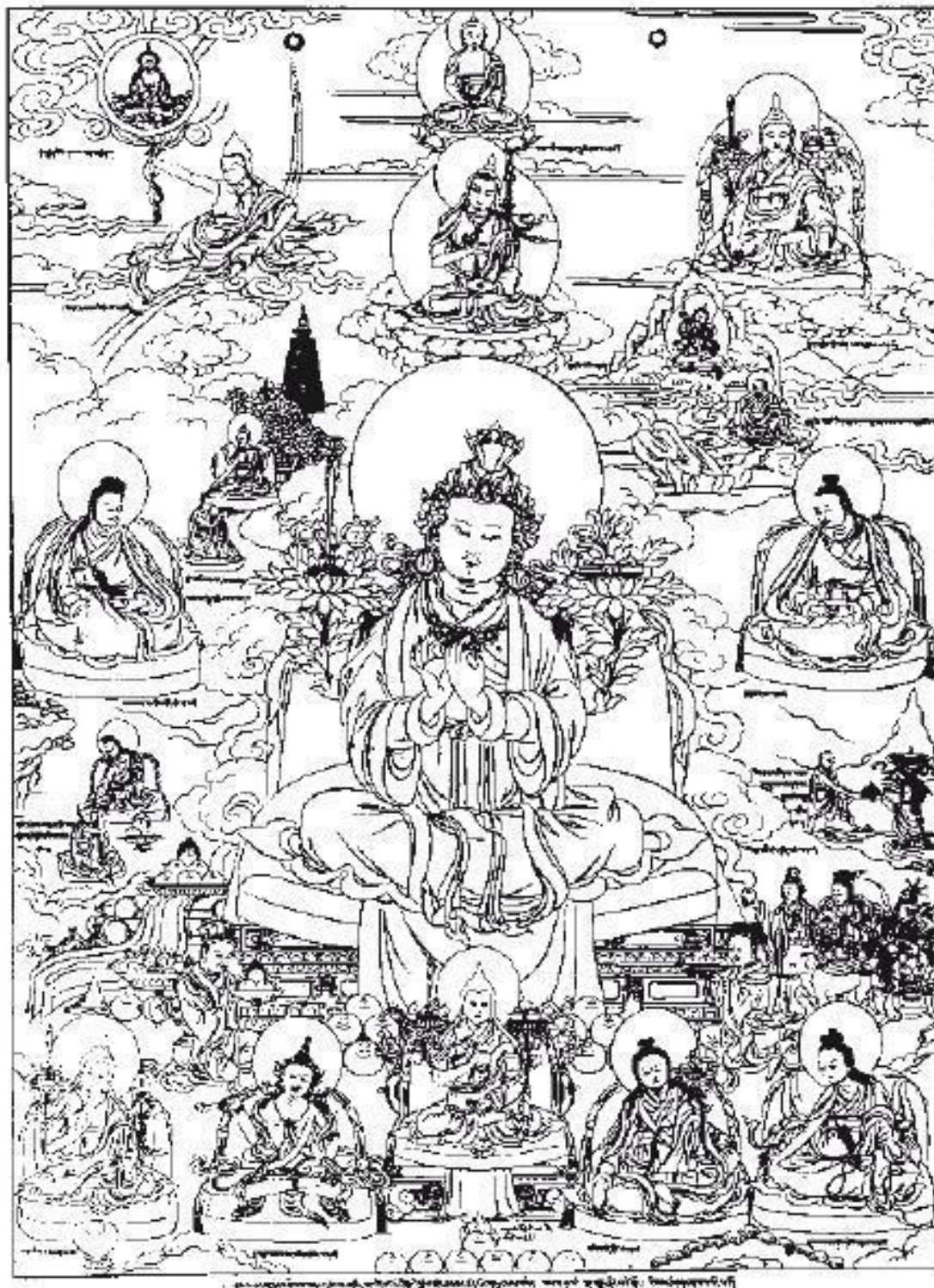
Царь Трисонг Децен (790–844)