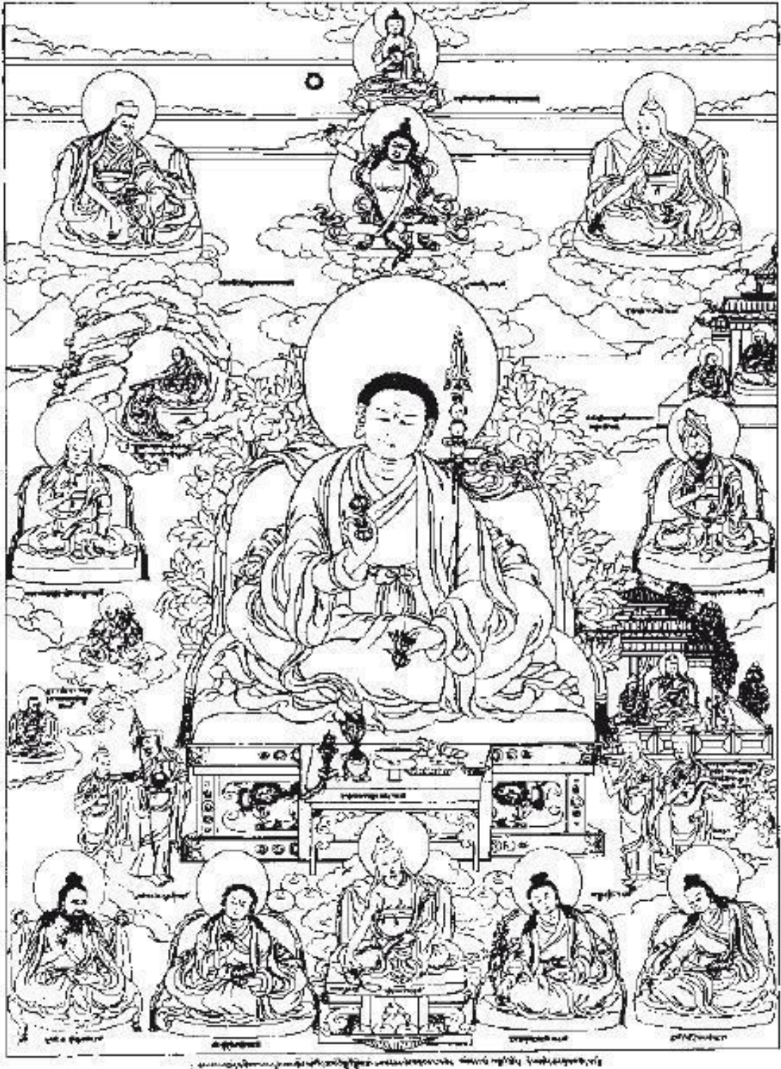
Джецун Драгпа Гьялцен (1147–1216), традиция сакья

Безмерная любящая доброта – это пожелание, чтобы другие существа были счастливы, чтобы они обрели причины для счастья. Все живые существа стремятся к счастью, но мало кто из них действительно его обретает. Таким образом, пожелание, чтобы живые существа были счастливы и обрели причины для счастья, называется «любящая доброта». Любящая доброта обладает неисчислимыми благими качествами. Если в нашем сердце присутствует любящая доброта, то мы обретаем способностью естественным образом приносить живым существам благо.