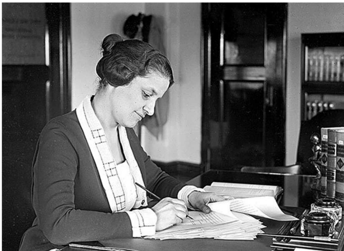
Мейбл Уокер Виллебрандт в Министерстве юстиции, ок. 1921 года