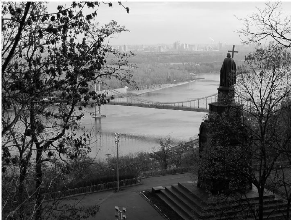
Рис. 1.1. Статуя Великого князя и святого Владимира (1853), принявшего православие в 988 году, смотрит на левый берег Днепра и бескрайнюю степь Евразии.

На эту обширную равнину, покрытую лесом, накладывалась плотная сеть рек и озер. Поскольку заметных возвышенностей здесь нет (самая высокая точка к западу от Урала не превышает 350 метров, в Сибири – 200 метров), Евразия является идеальным местом для региональной и международной транзитной торговли, а также для передвижений народов. В то время, когда территория империи была наибольшей, в ней насчитывалось 13 рек протяженностью свыше 2000 километров и столько же рек длиной около 1000 км, включая шесть крупных речных систем.