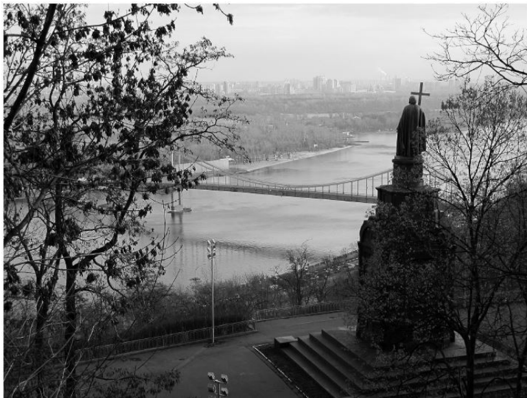
Рис. 1.1. Статуя Великого князя и святого Владимира (1853), принявшего православие в 988 году, смотрит на ле-

шенностей здесь нет (самая высокая точка к западу от Урала не превышает 350 метров, в Сибири – 200 метров), Евразия является идеальным местом для региональной и международной транзитной торговли, а также для передвижений народов. В то время, когда территория империи была наибольшей, в ней насчитывалось 13 рек протяженностью свыше 2000 километров и столько же рек длиной около 1000 км, включая шесть крупных речных систем.