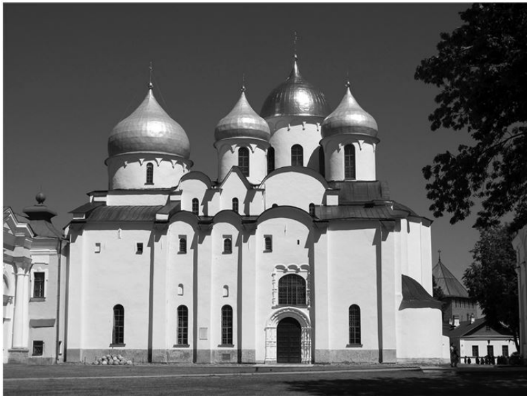
Рис. 2.1. Новгородский Софийский собор, построенный в 1045–1050-х годах греческими мастерами, отражает статус города как второй княжеской резиденции Киевской Руси и крупного балтийского торгового порта; в XI веке Новгород отказался от княжеского контроля и стал республикой.

Покровительство со стороны монголов было одним из четырех факторов, которые, согласно знаменитому историку В. О. Ключевскому, способствовали становлению Москвы как региональной державы. Перечислим остальные три: пе-