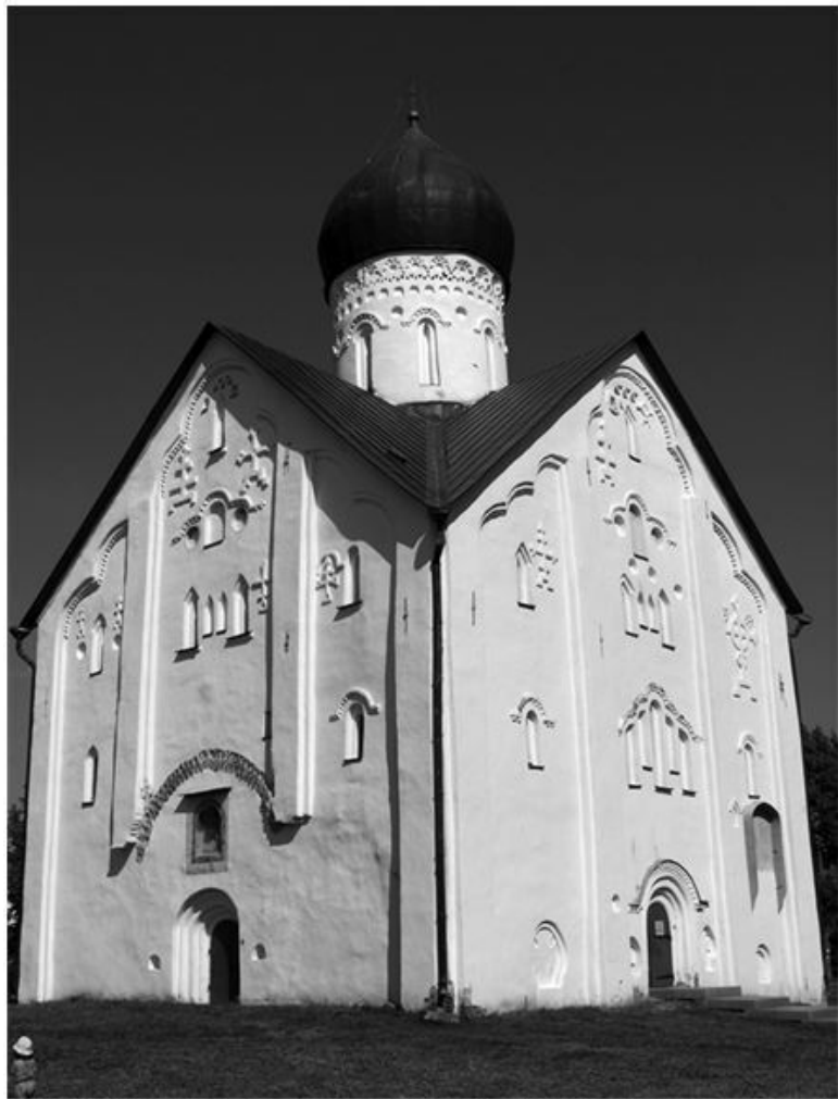
Рис. 2.2. Церковь Спаса Преображения на Ильине в Нов-