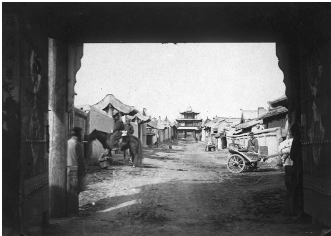
Ил. 2. Уличная сцена в Майнмачене (1885 или 1886), китайской торговой слободе, расположенной непосредственно на другой стороне границы от Кяхты. Более полутора сотен лет эта торговая система доминировала на границе в двустороннем обмене чаем, мехами и другими товарами

Необходимость урегулирования торговли обоими государствами была очевидной. После подписания Кяхтинского договора Пекин и Санкт-Петербург создали новую систему торговли – так называемый Кяхтинский торг. Эта система, в отличие от китайской торговли с западными странами (Кантонская система), способствовала возникновению новой формы официальной караванной торговли на двух, официально признанных, участках фронта, постепенно заменив неформальную российскую караванную торговлю с китайской столицей 38 .