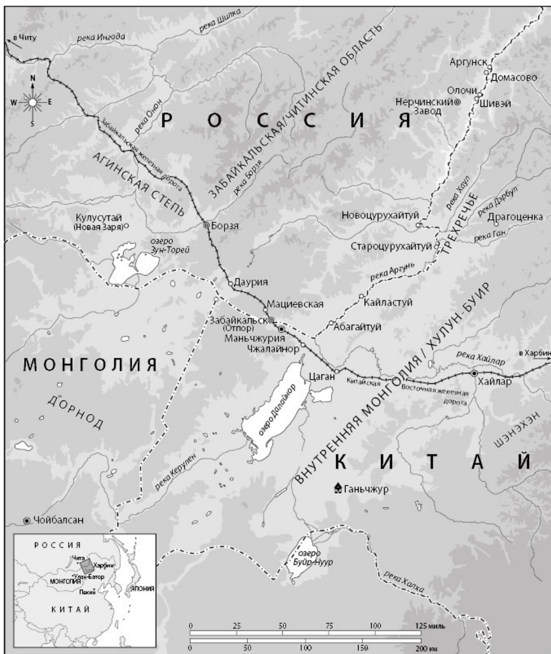
Карта 2. Сводная карта Аргунского пограничья, на которой указаны наиболее значимые населенные пункты с XIII века до настоящего времени (Cox Cartographic Ltd)

Расположенная в самом сердце обширного фронта Внутренней Азии река Аргунь маркирует 944 километра границы между Россией и Китаем. Эта территория является самым старым пограничным участком между двумя державами, пережившим все изменения. Более того, эта территория представляет собой два разных вида границ. Река пересекает местность, где сельские русские, китайские и автохтонные миры замысловато переплелись. Всего в нескольких минутах езды, однако, располагается железнодорожный город, который представляет собой совершенно иную социальную ткань, а вместе с тем и новую форму границы. Все эти разные сферы, географически сведенные к Аргунскому бассейну, наделяют его уникаль-