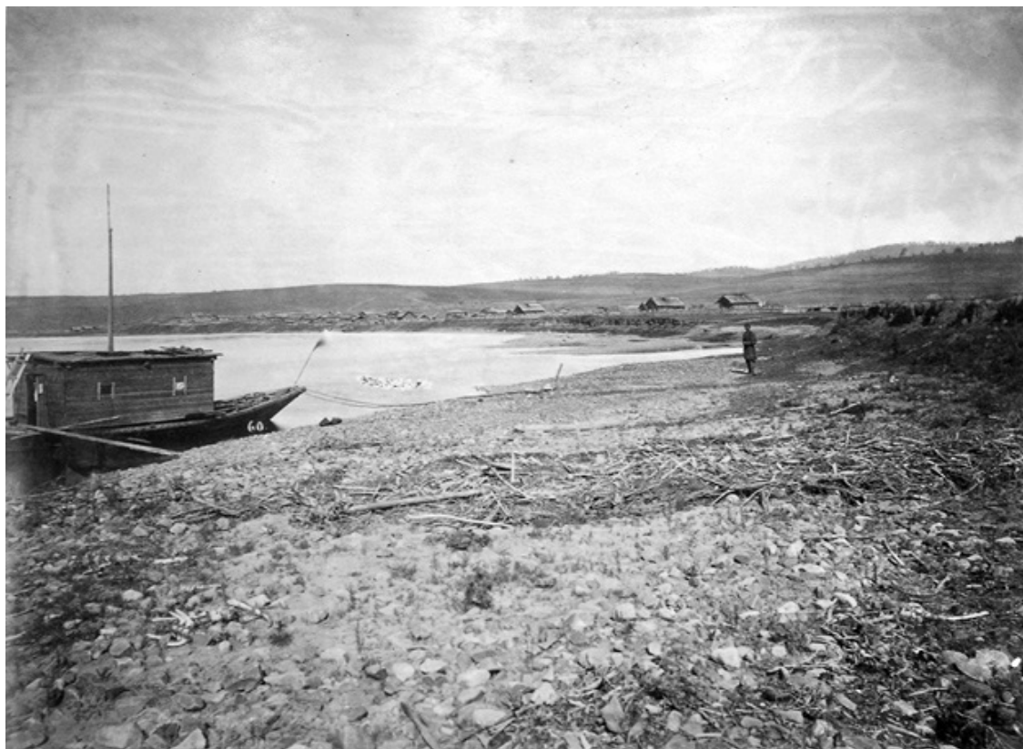
Ил. 1. Казацкая станица в низовье Аргуни, конец XIX века. Люди, животные и товары переправлялись по реке на баржах