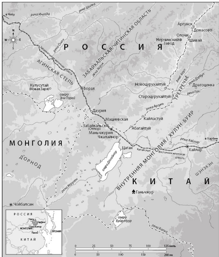
Карта 2. Сводная карта Аргунского пограничья, на которой указаны наиболее значимые населенные пункты с XIII века до настоящего времени (Cox Cartographic Ltd)