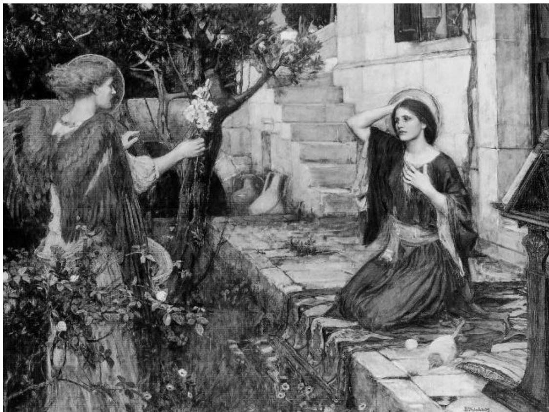
Благовещение. Джон Уильям Уотерхаус. 1914 г.

Она думает только о девстве, потому что дала обет девства, а тут говорится, что Она родит ребенка, и пока еще не объясняется, как это произойдет.