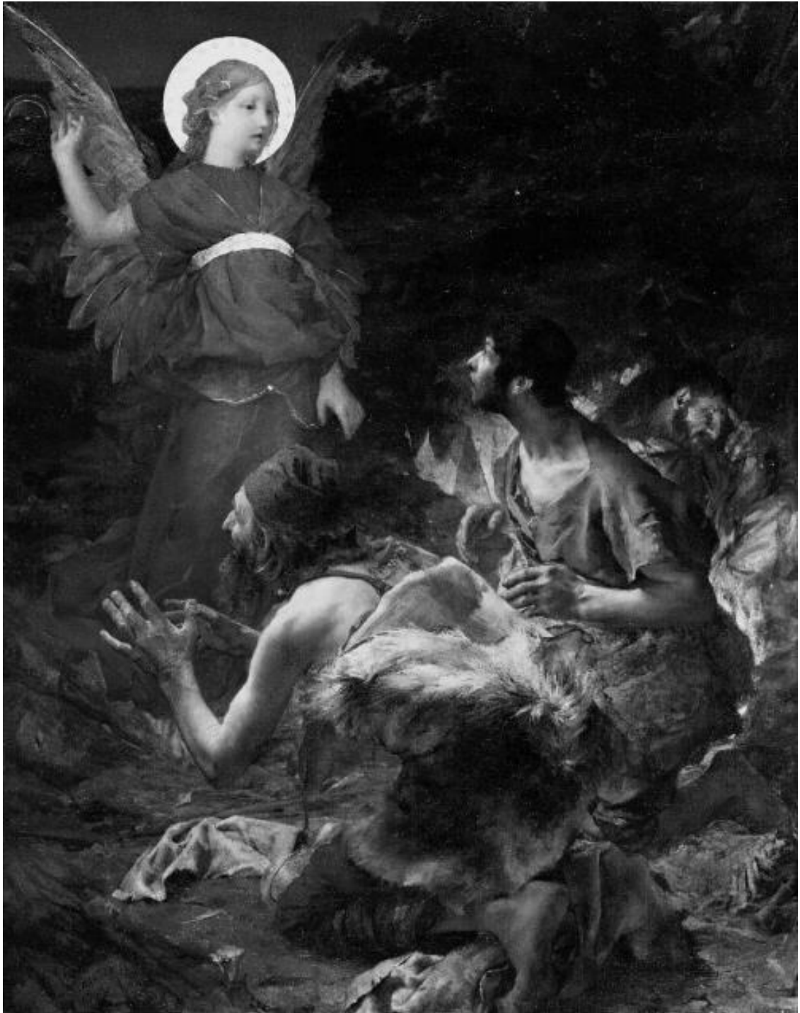
Благовещение пастухам. Жюль Бастьен-Лепаж. 1875 г.

Итак, пастухи узнали о чуде рождения Христова от ангелов. Но волхвы, о которых рассказывает евангелист Матфей, тоже были посвящены ангелом в тайну рождения Христова. Ангел в виде Вифлеемской звезды двигался по небу, указывая им направление. Волхвы два года добирались до места, где к их приходу родился Христос. Об этом мы узнаём из уточнения в Евангелии от Матфея: Ирод выведал время появления звезды, а потом приказал избить всех младенцев от двух лет и ниже (см. Мф. 2,16). Он не понимал, то ли Этот Младенец уже родился, когда они два года назад впервые увидели звезду, то ли Он родился к их приходу в Иерусалим. Поэтому, чтобы не ошибиться, Ирод приказал избить всех младенцев от двух лет и ниже.