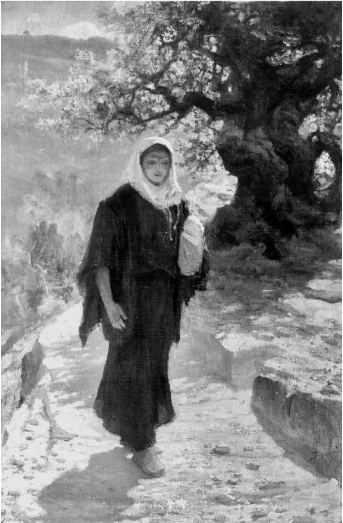
Мария пошла в нагорную страну. Василий Polenov. 1890 г.

Исполнение от Духа Святого – это, наверное, самое чудесное, что может происходить в жизни каждого верующего человека. Дух Святой – это Дух Божественной любви, действующий