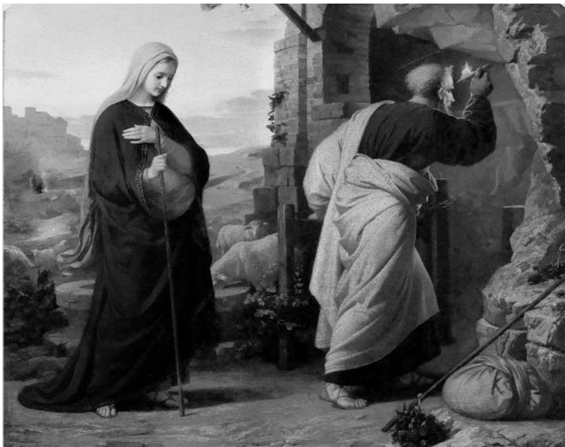
Вечер перед рождением Христа. Михаэль Ризер. 1869 г.

ездить в Золотую Орду. Когда они там находились, от них требовали, чтобы они поклонились идолу.