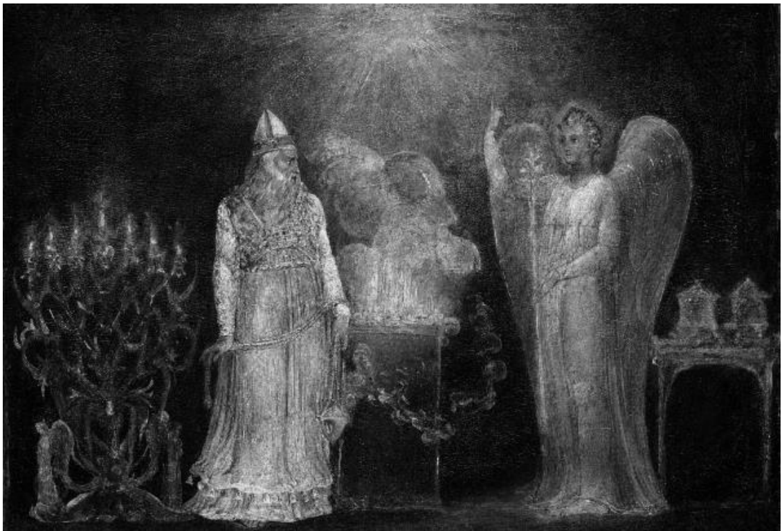
Ангел появляется перед Захарией. Уильям Блейк. 1799 или 1800 г.

В I веке Иосиф Флавий, который был священником в Иерусалимском храме и служил в нем, написал две огромные книги: «Иудейские древности» и «Иудейская война». В «Иудейской войне» он описал Храм, каким он его запомнил. Это было удивительное сооружение. Вокруг Храма располагались жилища для священнослужителей и их жен и детей (поэтому не надо удивляться, что, по преданию, Дева Мария жила при Храме). Он описывает даже Мамврийский дуб, который, как считается, стоит от сотворения мира в Хевроне. Иосиф Флавий подтверждает, что и в I веке все полагали, что Мамврийский дуб ведет исчисление от сотворения мира.