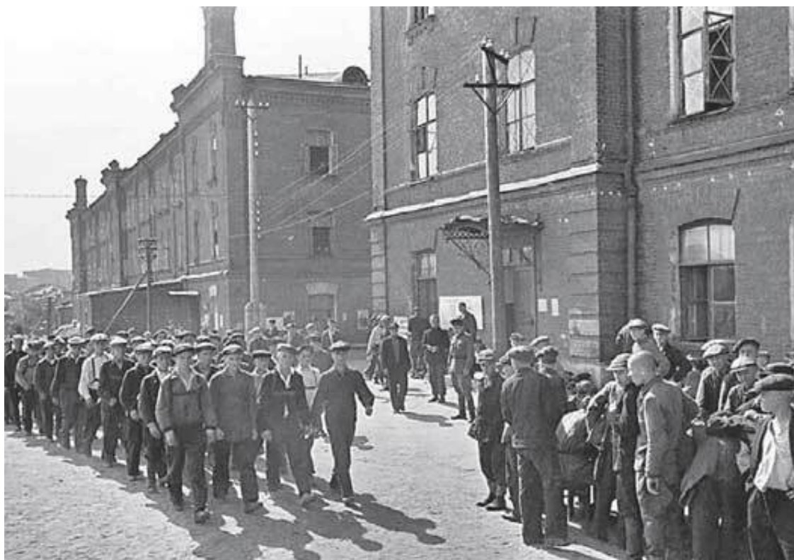
3. Московские ополченцы уходят на фронт 23 июня 1941 г.