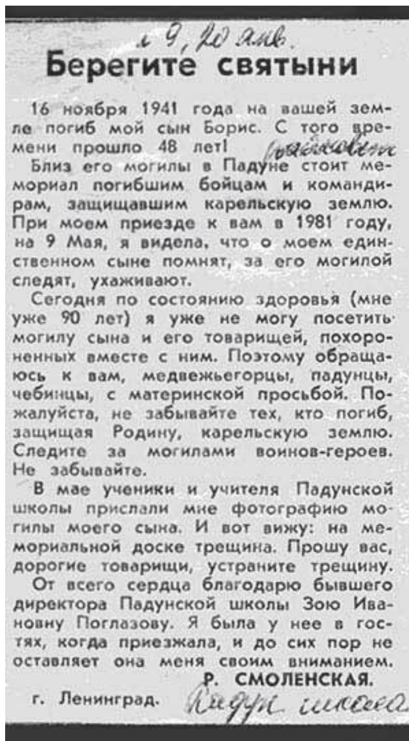
1. Письмо матери Бориса Смоленского