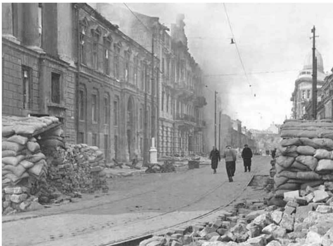
2. Одесса. Осень 1941 г.