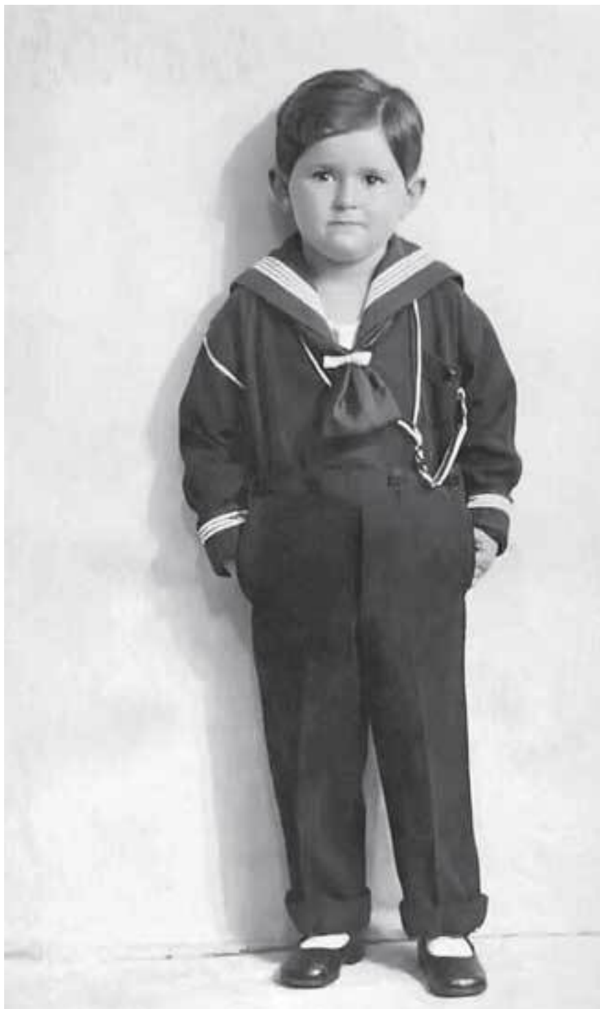
1. Жорик Вайнштейн, 1924 г.