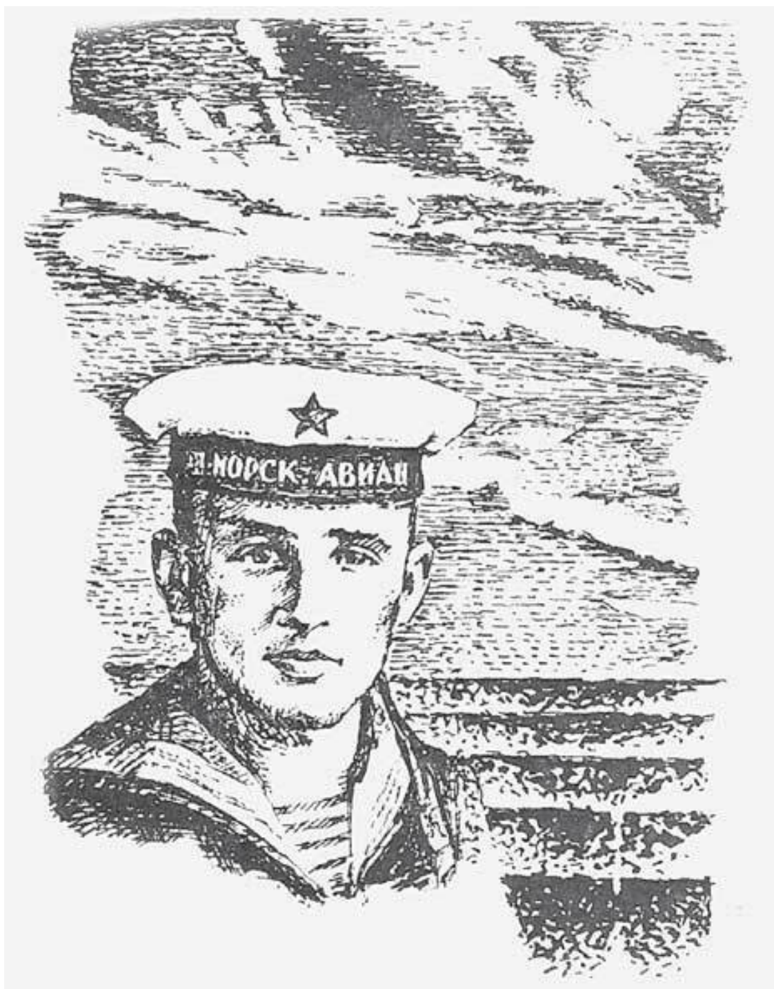
3. Рисунок из книги стихов «Возвращени изданной в Киеве в 1984 г.