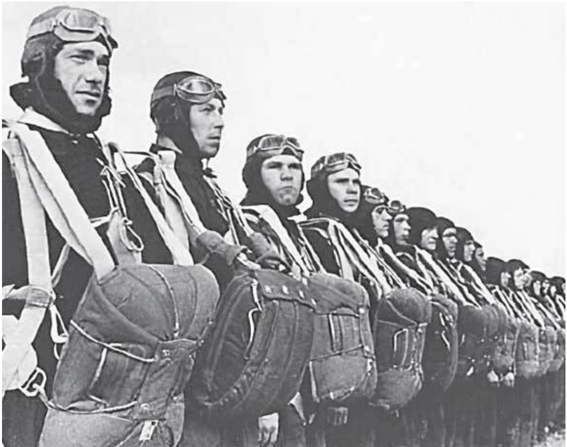
1. Парашютно-десантная рота авиации Черноморского флота, 1941 г.

Только глаз одних не позабыли, У которых смех на самом дне. Счастье мы ладонями ловили. Не поймали. Нет. 1938–1940