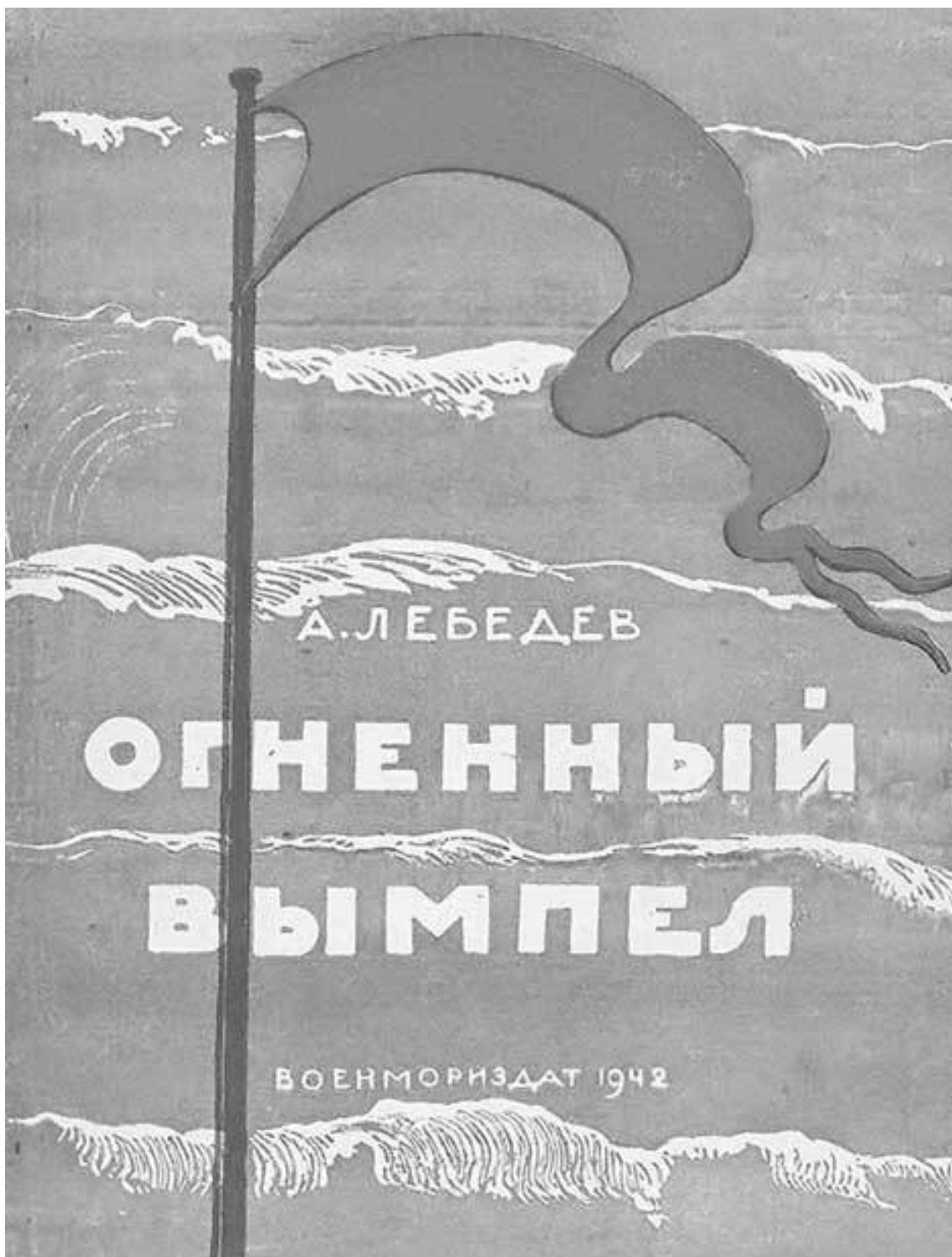
1. Обложка книги стихов Алексея Лебедева «Огненный вымпел»