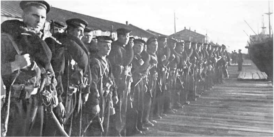
4. Бойцы морской пехоты в Одессе. Октябрь 1941 г.