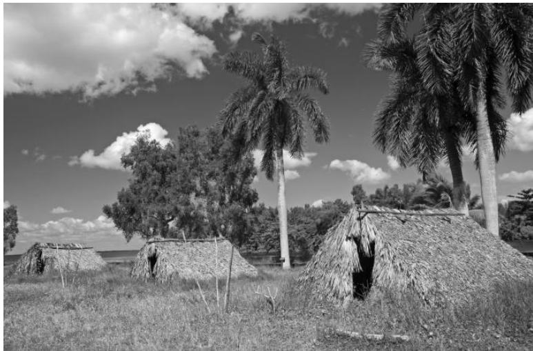
Реконструкция деревни племени таино на полуострове Сапато, Куба

Таино не были людоедами, в отличие от других народов этого региона.