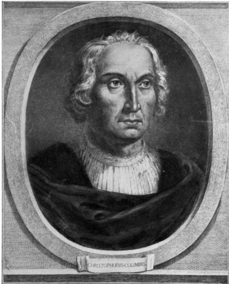
Алирандо Каприоли. Христофор Колумб. Конец XVI века