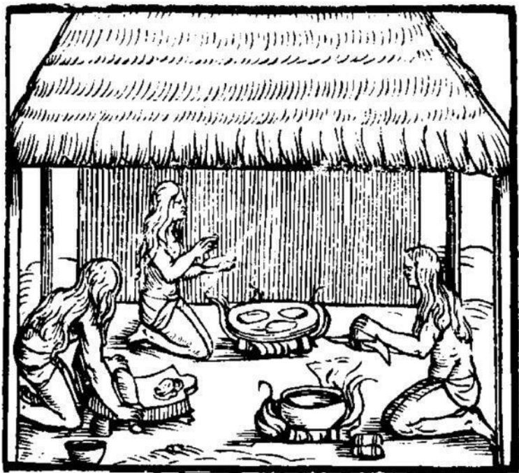
Иллюстрация из Historia del Mondo Nuovo Джироламо Бенцони. Женщины племени таино готовят лепешки из маниока. 1565

Последние были оттеснены на запад острова таино. Плюс стали выделять еще и жителей средней части острова, которых называли сибонеи (siboney) и часто путали с гуавахатабеи, так как они тоже враждовали с таино.