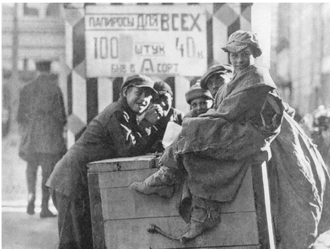
Беспорядочники. Москва, 1920-е годы 18

«В высшей степени нравственная личность, мой хороший знакомый, кажется, друг детей... Но вы можете не дружить с детьми – этого от вас милиция не потребует». Бендер имеет в виду общество «Друг детей», созданное по инициативе Надежды Крупской в 1924 году, куда обязывали вступать советских служащих и, соответственно, платить членские взносы. Члены общества имели право на ношение специальных нагрудных значков, на многих из которых был изображен Ленин, «друг детей», обладатель первого членского билета общества. Беспорядочность в «Двенадцати стульях» – проблема, о которой принято рассуждать, а не пытаться ее решить. В этом смысле сбор денег под предлогом заботы о детях, предпринятый Остапом, не столько проявление цинизма, сколько сатирическое отражение громких благотворительных кампаний тех лет.