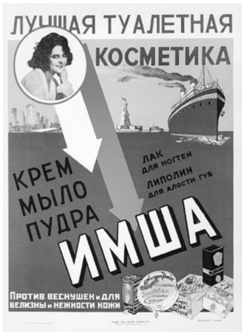
Рекламный плакат «Лучшая туалетная косметика “Имша”». 1925 год 13