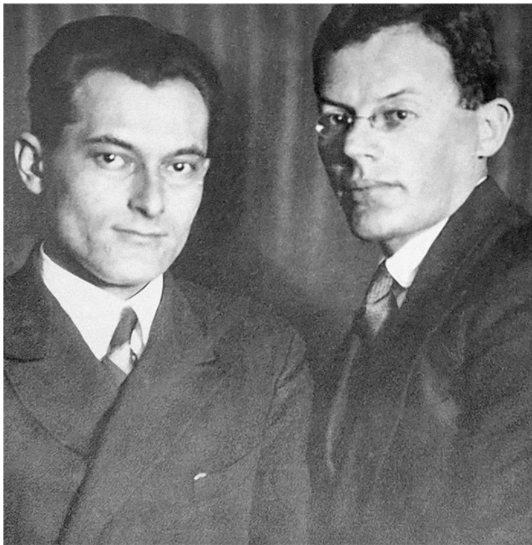
Евгений Петров и Илья Ильф. 1930-е годы. 1