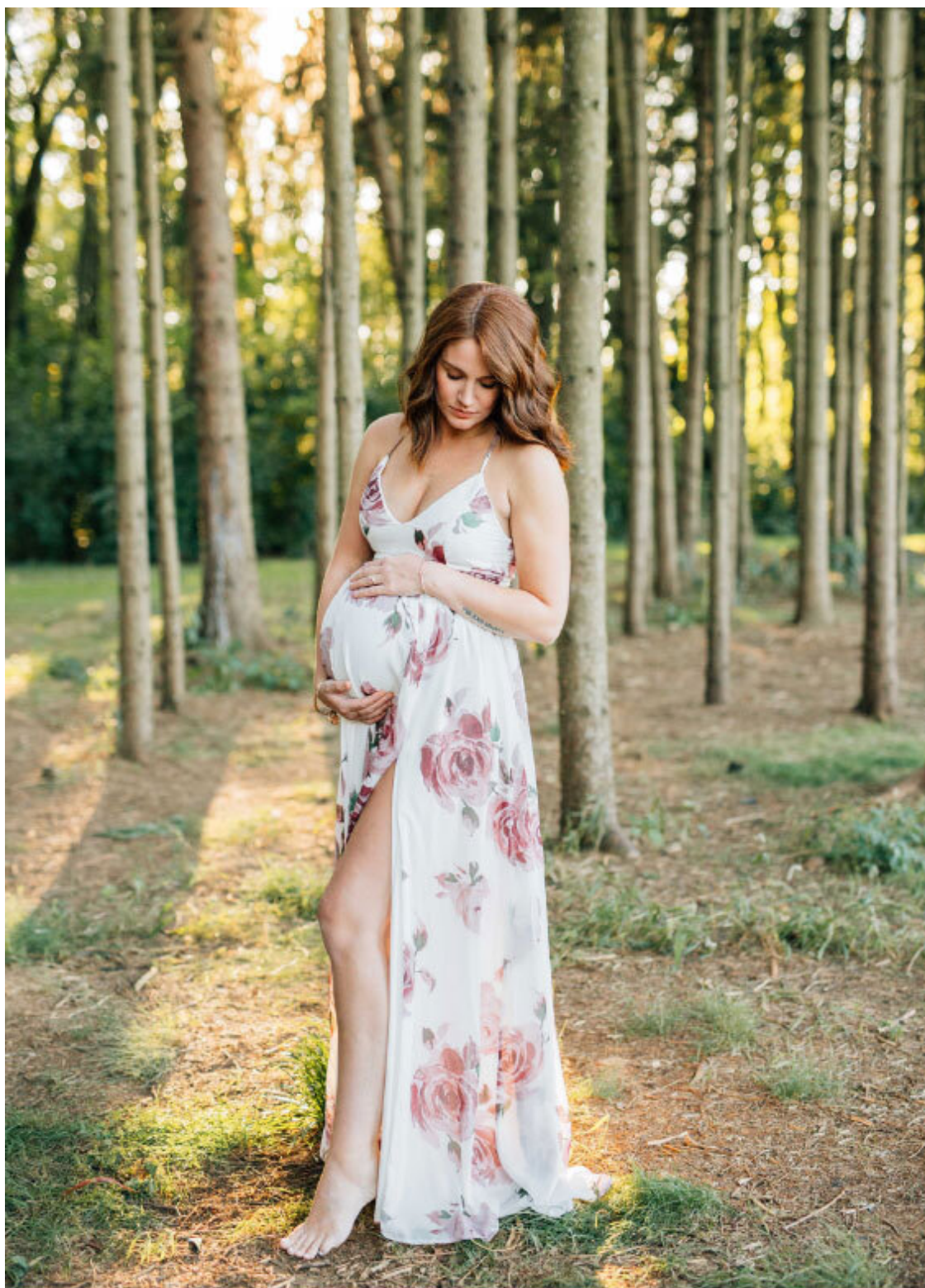
Рис. 1. Образ Берегини читается в заботливой, нежной женственности.