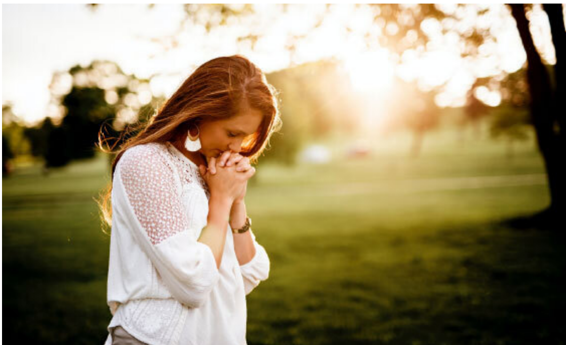
Рис. 2. Сердце женщины-Берегини способно оберегать других...