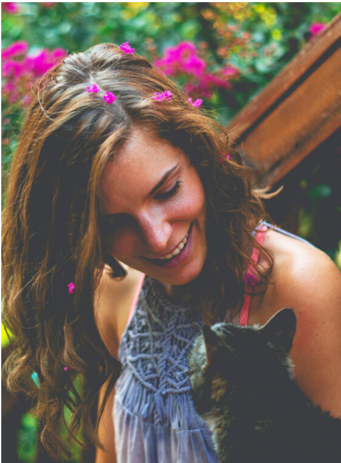
Рис. 7. Женщина-Берегиня отзывчива ко всем, кто ее окружает. Ее дар окутывать своей мягкой энергией, как покрывалом, ощущают все, в том числе животные.