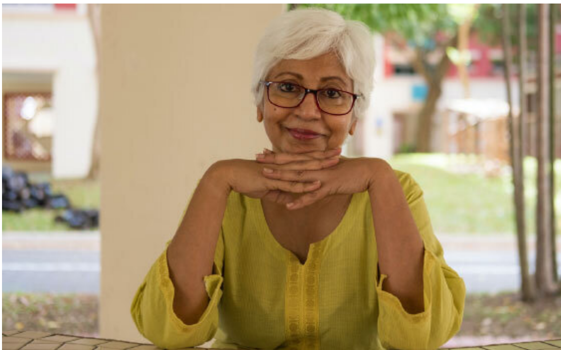
Рис. 6. В лице женщины, проявляющей архетипическую стратегию Березины, всегда читается открытость и готовность выслушать и утешить.