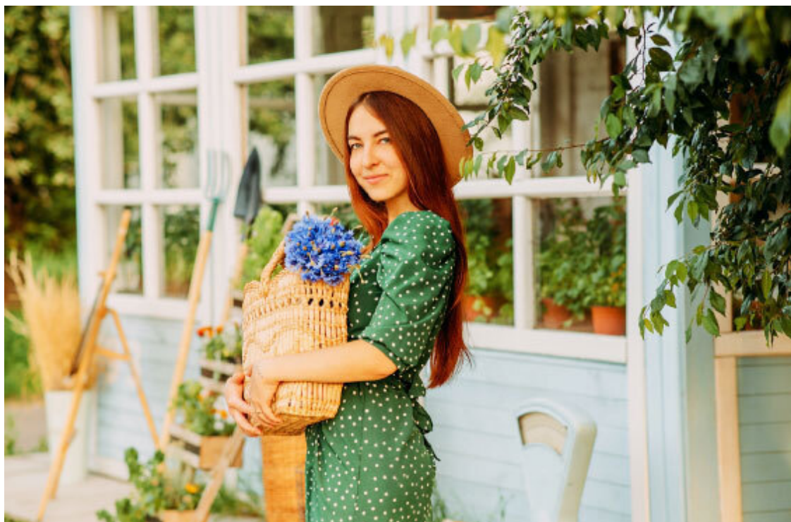
Рис. 5. Березина несет свою энергию в мир, проявляя любовь ко всему живому.