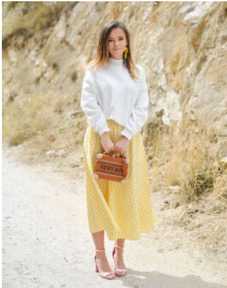
Рис. 4. Для настройки на образ Березины подходят мягкие силуэты, струящиеся ткани, подчеркивающие женственность.