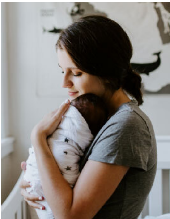
Рис. 3. Нежность, забота и любовь. Материнство раскрывает в женщине дар Берегини.