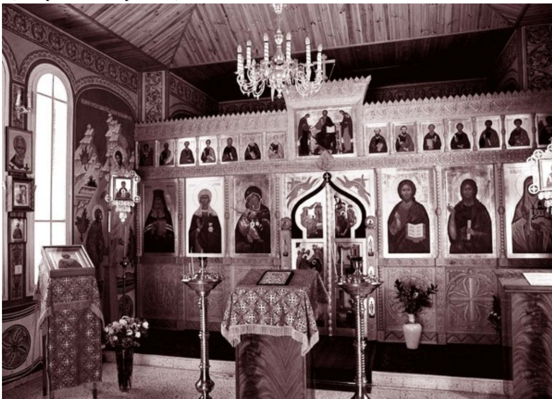
Внутреннее убранство церкви св. Марии Магдалины в Магдале

Женщина, уличенная в прелюбодеянии и приведенная ко Христу, Мария, из которой изгнаны семь бесов, женщина, помазавшая Иисуса драгоценным миром, Мария, сестра Марфы и Лазаря, тоже помазавшая Иисуса миром – традиционно христиане видели во всех этих женщинах одно и то же лицо. Проповедники, богословы, поэты, прозаики и художники все эти события отнесли к Марии Магдалине, о которой, по словам Христа, должно быть возвещено везде (Матф. 26:13; Марк. 14:9).