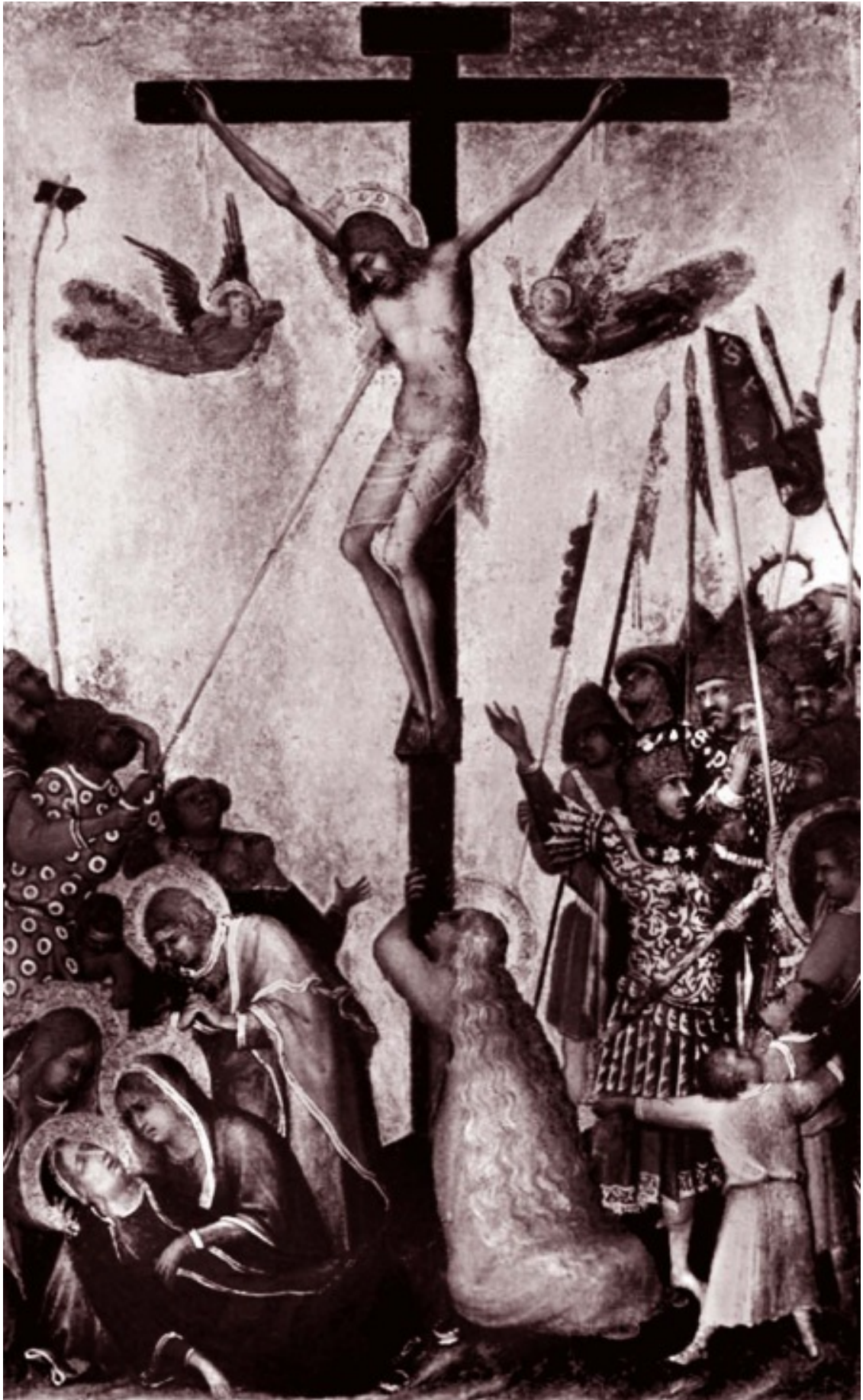
Распятие. Художник Симоне Мартини