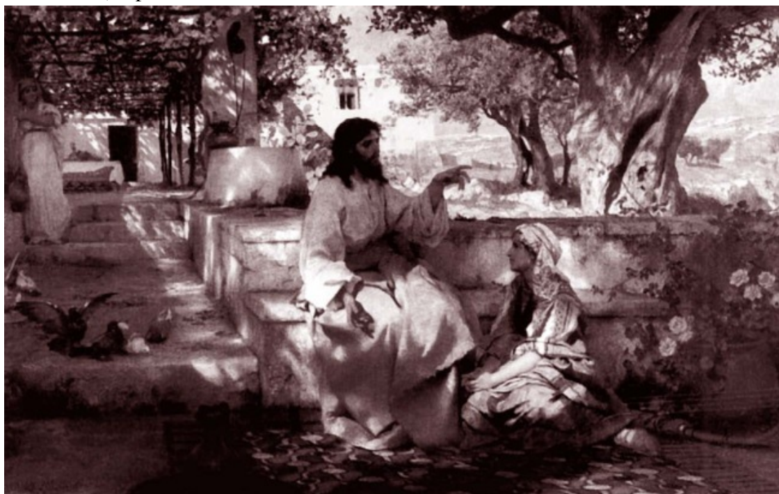
Христос у Марфы и Марии. Художник Генрих Семирадский

«Между тем догадки их были на самом деле справедливы, но только они ошибались в личности соблазнителя. Это вовсе не был смуглый и гибкий, как тростник, молодой рыбак Саул, но тяжелый, некрасивый, волосатый Иуда из Кариота, оборванный бродяга, который скитался по всей Палестине, доходил до края обоих морей, блуждал по берегам Нила, посетил Александрию и даже жил недолго в далеком, таинственном Риме, грозной резиденции железных легионов Цезаря.