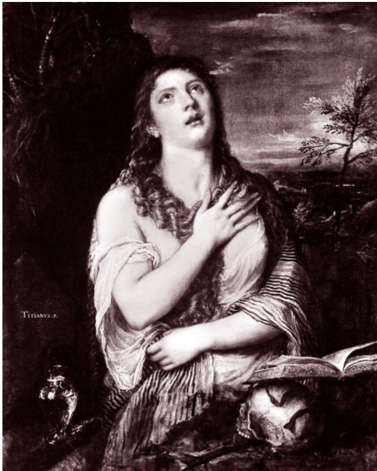
Кающаяся Мария Магдалина. Художник Тициан