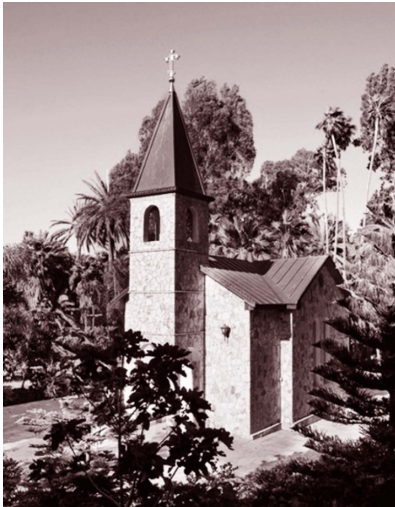
Церковь св. Марии Магдалины в Русском Православном