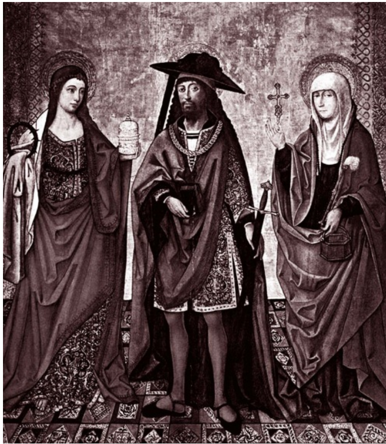
Лазарь с сестрами Марфой и Марией

Согласно Новому Завету, ученица Христа присутствовала при распятии Великого Учителя (Мат. 27: 56; Мар. 15: 40;