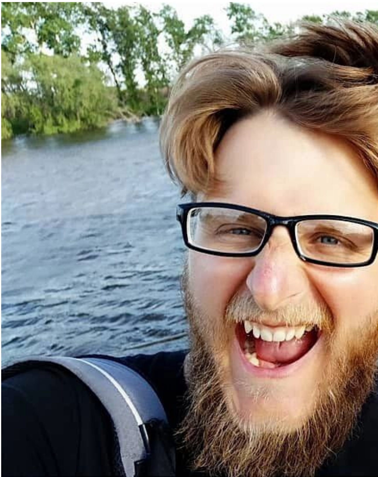
До Челябинска оставалось 582км...