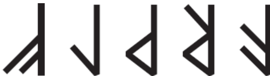
Рис. 4. Перевернутые и повернутые руны

Также есть девять рун, не имеющих обратных позиций: Гебо, Хагалаз, Наутиз, Иса, Иера, Эйваз, Соуло, Ингуз, Дагаз (рис. 5). Их значение постоянно. Но я встречала рунические работы, в которых автор прописывает необратимую руну в перевернутом положении, например Ингуз в формуле «Проклятье местности».