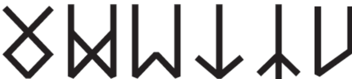
Рис. 2. Обратимые руны

В современной традиции руны принято разделять на четыре группы по положению, которое они занимают относительно своей оси. Симметричные руны – Уруз, Альгиз, Тейваз, Эваз, Манназ, Отал – могут читаться вверх ногами, поэтому называются обратимыми, или переворачиваемыми (рис. 2). Считается, что в инвертированной позиции их значение становится противоположным. В таких случаях перевернутое положение обозначается как «п. п.».