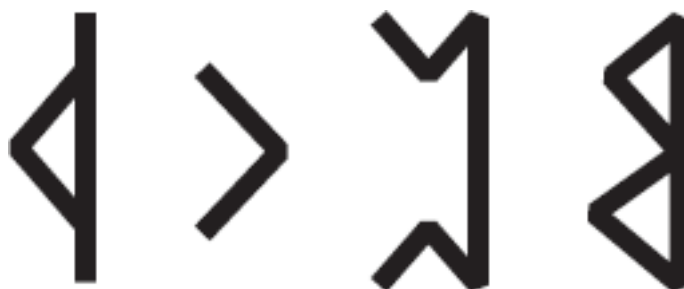
Рис. 3. Зеркальные руны

Несимметричные руны – Турисаз, Кеназ, Перт, Беркана – не меняются при переворачивании, но могут поворачиваться справа налево. Это называется зеркальным положением – «зерк. п.» (рис. 3). Их значение при этом тоже становится другим, но необязательно противоположным.