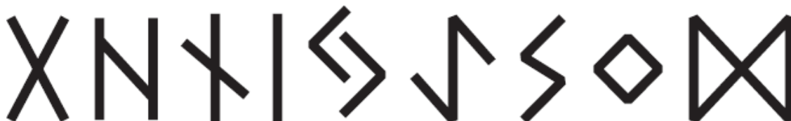
Рис. 5. Необратимые руны

Если придерживаться аутентичности, ни одна руна не имеет перевернутого положения, так как в рунических поэмах есть описание только прямых позиций. Но, как я уже говорила, система развивается, и вполне вероятно, что в дальнейшем нас ожидает много «открытий чудных», основанных на личных инсайтах, а может, и научно обоснованных.