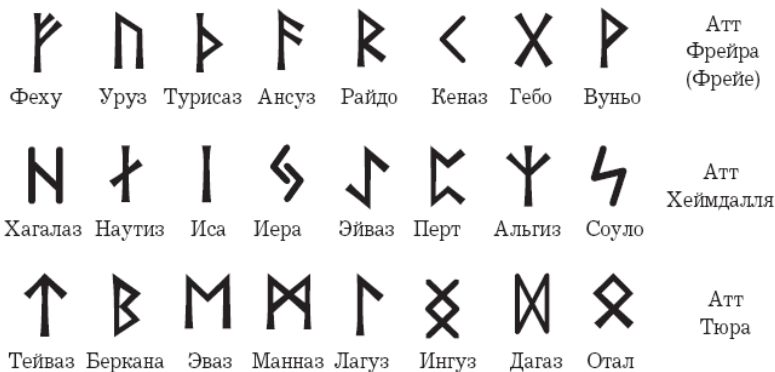
Рис. 1. Футарк и его структура

или буквенным сочетанием th. При таком подходе оба названия рунического алфавита (Fudark или Futhark) верны. Иногда можно встретить и наименование «футорк». Это связано с тем, что в ряде младших футарков 3-я руна Ансуз означала звук «о», а не «а» и называлась Осс (англосаксонский рунический строй).