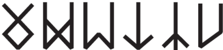
Рис. 2. Обратимые руны

В современной традиции руны принято разделять на четыре группы по положению, которое они занимают относительно своей оси. Симметричные руны – Уруз, Альгиз, Тейваз, Эваз, Манназ, Отал – могут читаться вверх ногами, поэтому называются обратимыми, или переворачиваемыми (рис. 2). Считается, что в инвертированной позиции их значение становится противоположным. В таких случаях перевернутое положение обозначается как «п. п.».