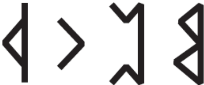
Рис. 3. Зеркальные руны

другим, но необязательно противоположным.