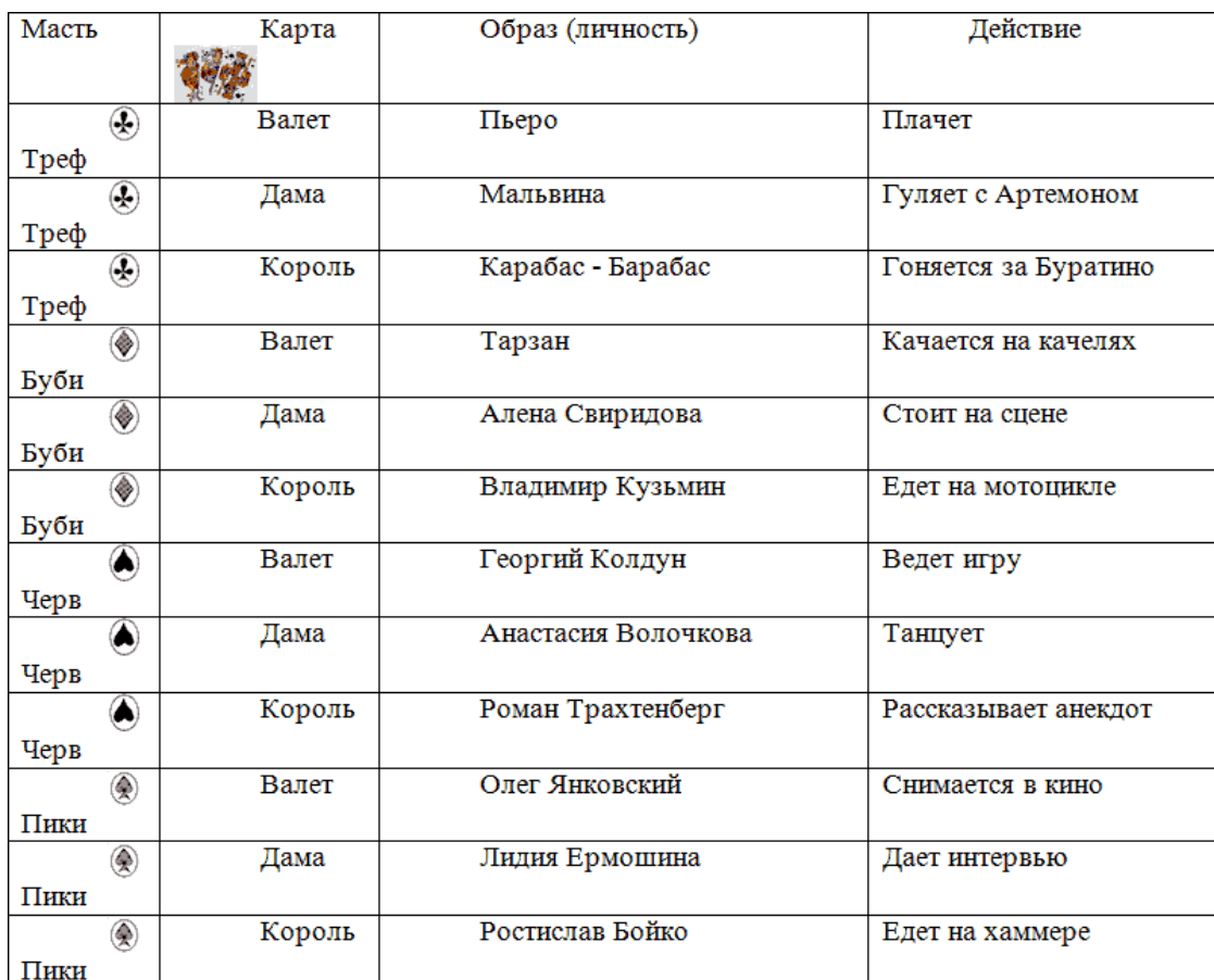
Таблица соответствия образов и карт для масти «трефы»