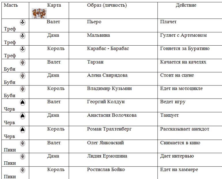
Таблица соответствия образов и карт для масти «трефы»»