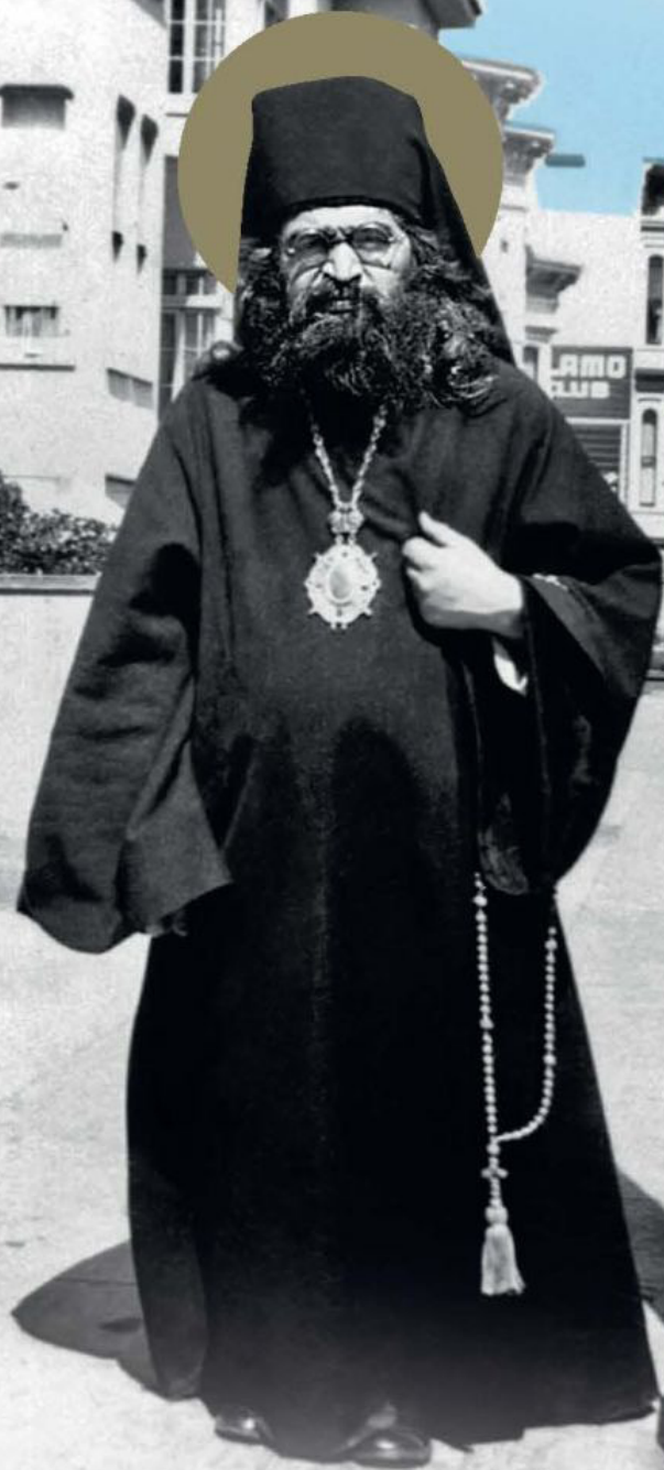
Святитель ✠ Иоанн ✠ Шанхайский и Сан-Францисский чудотворец