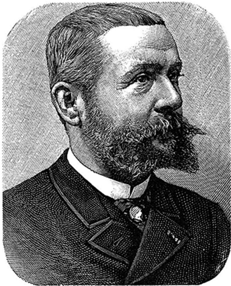
Гастон Тиссандье (1843–1899)